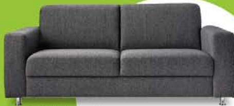
3-zitsbank New Jersey