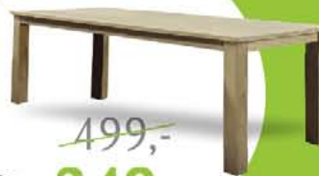
Teak Eettafel Tahoma 200 x 100 cm