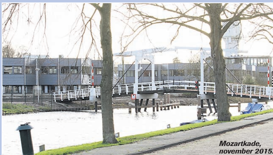
Mozartkade, november 2015.