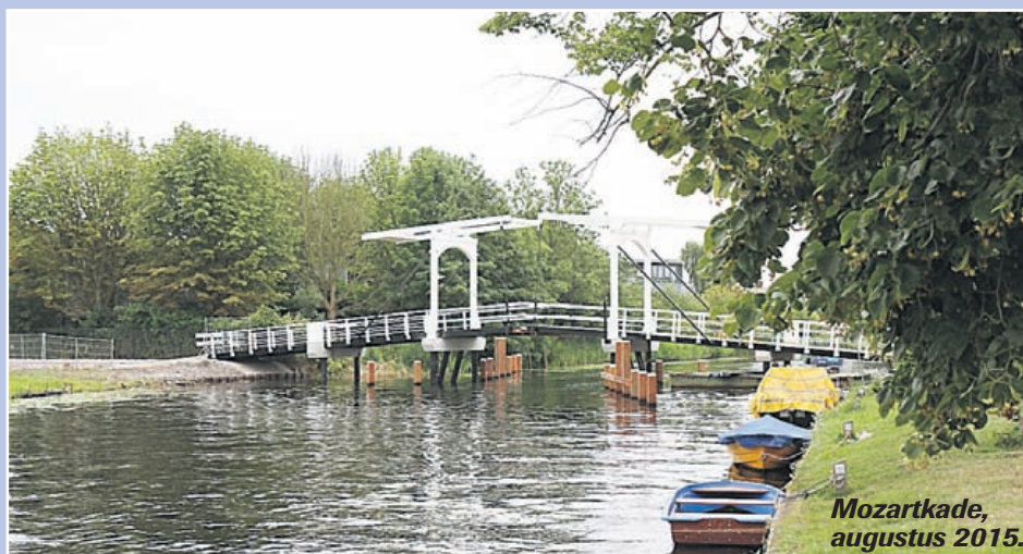
Mozartkade, augustus 2015.