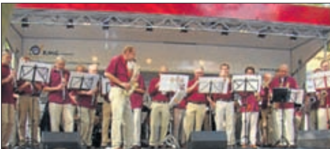
Echt Heemsteeds, de Teisterband.