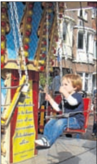
Draaien op de Binnenweg.