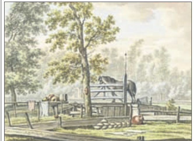
Een paard bij een boerenhek uit 1794

Regio - Op zondag 19 september klinkt er muziek door Schalkwijk. Op die dag vindt de derde editie van Muziek in de Wijk plaats in en rond het voormalige belastingkantoor aan de Surinameweg 2 (Belcantogebouw). Dit najaar luidt het thema: 'Muziek zonder grenzen'. Om 12.00 uur opent Haarlemse wethouder Rob van Doorn het festival. Bezoekers kunnen daarna tot 17.00 uur gratis genieten van een gevarieerd (muziek)programma. Ook voor kinderen zijn er diverse activiteiten.