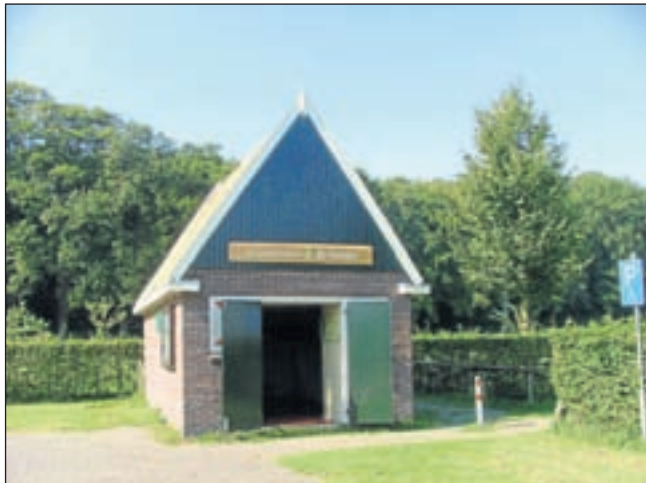
Informatiepunt Kakelye bij landgoed Leyduin