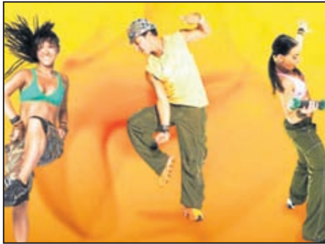
Gezellig en sportief: Zumba dansen.

Zuidam: "Wij zijn natuurlijk enthousiast en willen er graag over vertellen maar het gaat erom dat de mensen makkelijk hun weg naar het centrum vinden en dan ook nog binnenkomen."