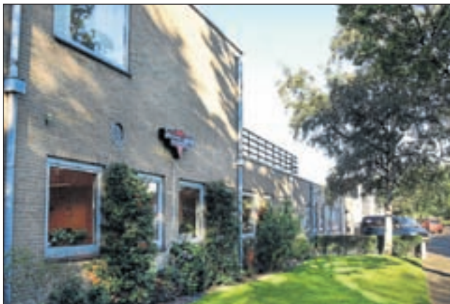
Het nieuwe pand aan de Nijverheidsweg 19.

menschap en kwaliteit zijn hierbij de uitgangspunten. Alle medewerkers zijn al vele jaren bij