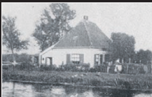
Een niet zo'n scherpe afdruk van Café Holdorp (1971).

Heemstede - Het cafeetje van Holdorp aan de Leidsevaart heeft lang gestaan op de plek waar nu serviceflat De Rozenburg is te vinden, tegenover het station Heemstede-Aerdenhout. Het cafeetje is gesloopt rond 1971 om een jaar later plaats te maken voor het flatgebouw. Wilt u meer info, mail dan naar: info@stationheemstedeardenhout.nl .