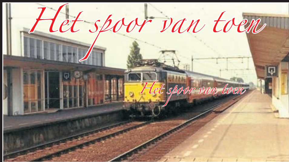
Heemstede-Aerdenhout, de D283 uit Paris Nord.

Heemstede - Het cafeetje van Holdorp aan de Leidsevaart heeft lang gestaan op de plek waar nu serviceflat De Rozenburg is te vinden, tegenover het station Heemstede-Aerdenhout. Het cafeetje is gesloopt rond 1971 om een jaar later plaats te maken voor het flatgebouw. Wilt u meer info, mail dan naar: info@stationheemstedeardenhout.nl .