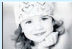
Kinderfoto door Inge Dobbe-Berken.

werken op papier. Galerie 37, Groot Heiligland 37, Haarlem www.galerie37.nl Open: donderdag t/m zondag 12-17 uur