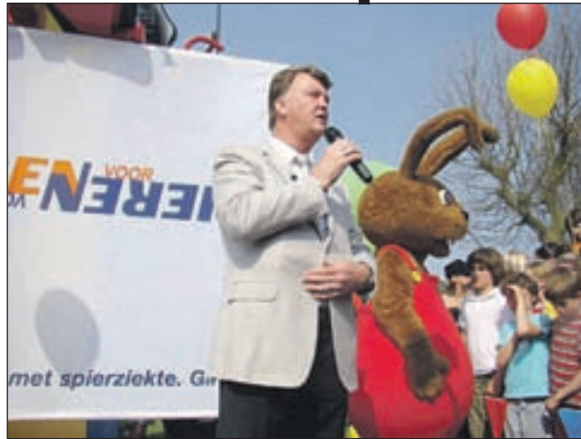
Louis van Gaal vertelt kinderen over Spieren voor Spieren.