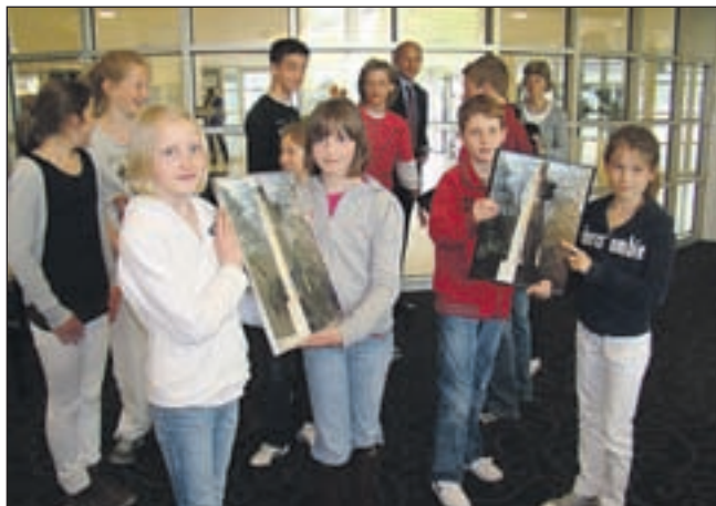
Overdracht oorkondes en foto's monument.