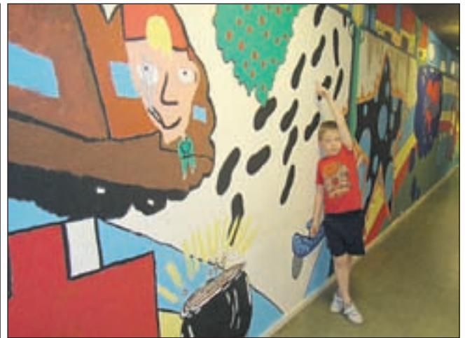
Schilderij van 25 meter.

Het thema van het corso dit jaar is Beroemde Boeken. Het corso vertrekt om 9.30 uur vanaf de boulevard in Noordwijk naar Haarlem. De optocht bestaat uit zo'n twintig praalwagens en meer dan dertig rijk met bloemen versierde luxe en bijzondere wagens. Het geheel wordt traditiegetrouw begeleid door verschillende swingende muziekkorpsen uit de regio. Langs de hele route is er voldoende ruimte voor de duizenden bezoekers die van heinde en verre komen en naar alle waarschijnlijkheid ook dit jaar het corso weer zullen aandoen.