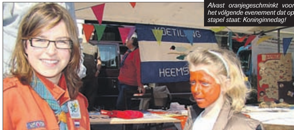
Alvast oranjegeschminkt voor het volgende evenement dat op stapel staat: Koninginnedag!

ten diverse verenigingen zich zoals de scoutinggroepen en kerkelijke instanties. Binnenin de krant een uitgebreidere terugblik op het evenement door Ton van den Brink.