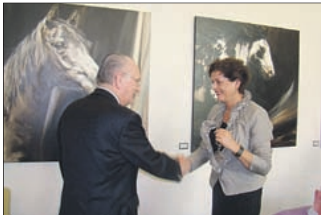
Verrassing vrijheidstoorts voor burgemeester.