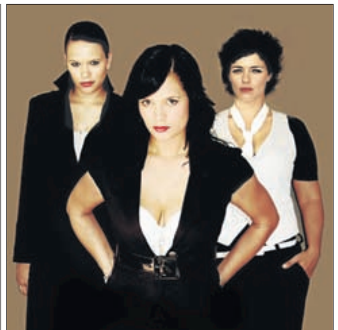
Van der Aa's en Zekhuis - Let's do Her.