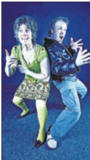
De Berini's - Opgevoerd.

Vrijdag 26 maart is de voorstelling te zien in Theater de Luifel, Herenweg 96 in Heemstede. Aanvang: 20.15 uur. De entree is 17,50 euro. CJP/65+ 16,50 euro. Kaartverkoop van maandag t/m vrijdag van 9.00 tot 16.00 uur en 45 minuten voor aanvang. Telephonisch reserveren via theaterlijn: (023) 548 38 38.