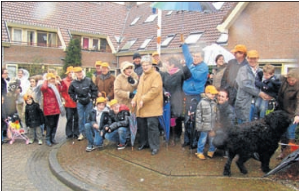
Wij werken met z'n allen aan een klimaatstraatfeest op het Beatrixplein.