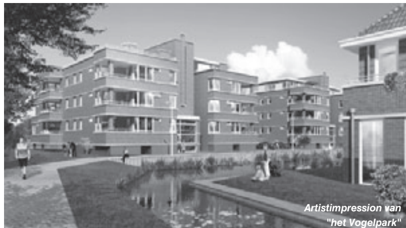
Artistimpression van "het Vogelpark"

De zojuist genoemde ontwikkelingen zijn het resultaat van een intensieve samenwerking