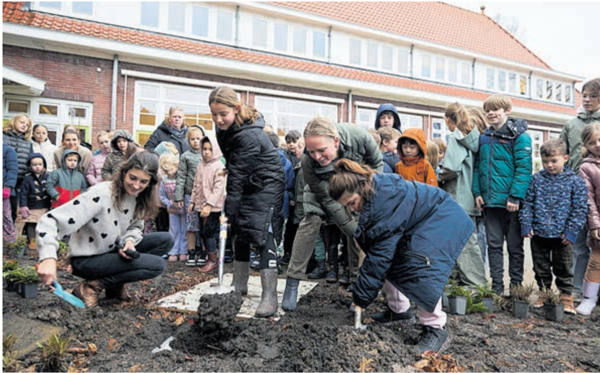
Begraven van de tijdscapsule.

Aansluitend werd het moment voortgezet met het planten van jonge plantjes door leerlingen van groep 6, 7 en 8 waarmee de school niet alleen naar de toekomst kijkt, maar ook letterlijk een nieuw hoofdstuk inluidt.