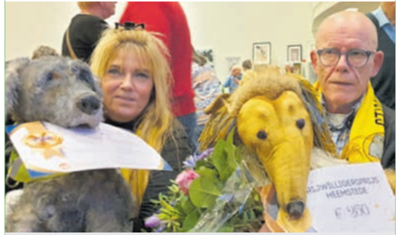
Vrijwilligerswerk, mooi werk.

Ben je geïnspireerd en wil je ook meedoen in het vrijwilligerswerk? Voor meer informatie: www.vrijwilligerswerkheemstede.nl .