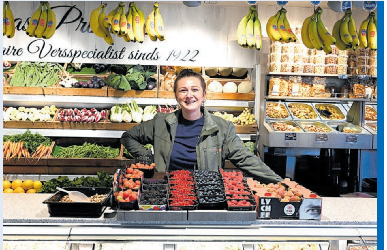
Met Lucas Primeurs bent u klaar voor de feestdagen.

Wordt het een graadje frisser buiten, dan staat bij ons ook overheerlijke erwtensoep te pruttelen. Of andere soepen die we met liefde voor je hebben bereid, zoals bijvoorbeeld onze