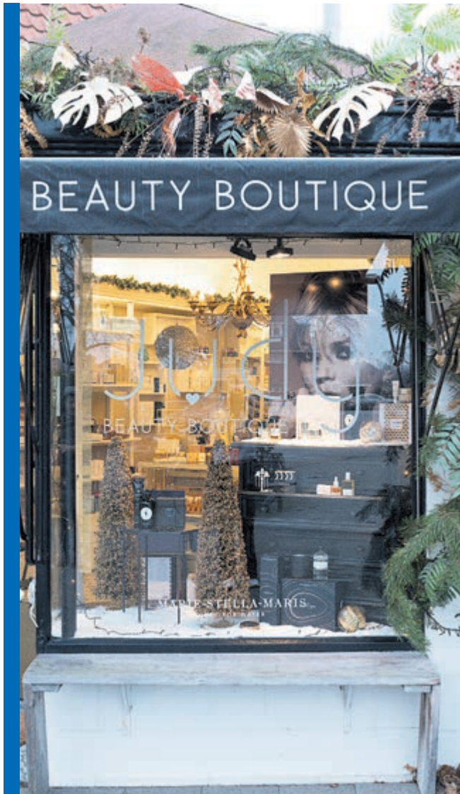
Voor de mooiste en originele beauty cadeaus ga je naar Judy Beauty Boutique.