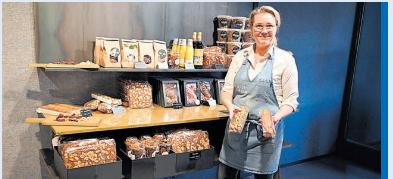
Al het lekkers voor de feestmaand verkrijgbaar bij Bakkerij Van Vessem.

Heel bijzonder is onze cinnamonrol. Dit is een kaneelrol met speculaascrumbles, speciaal voor de feestmaand. En niet te vergeten onze echte roomboter amandelstaaf voor Sinterklaas en kerst."