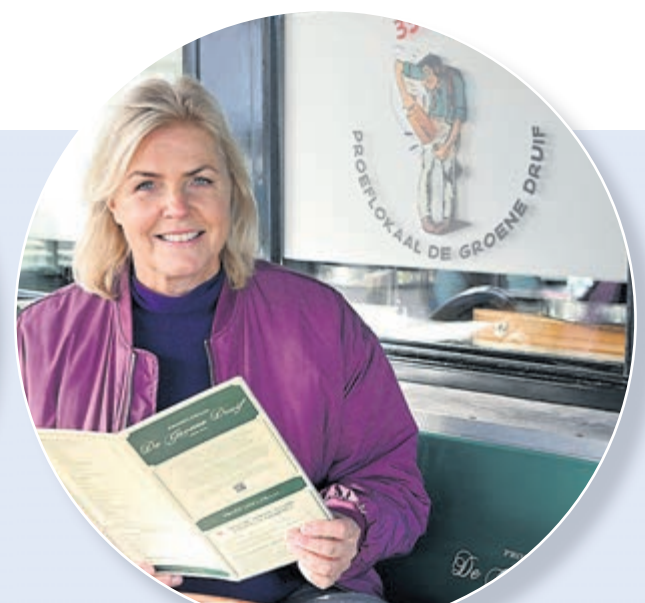
Proeflokaal De Groene Druif