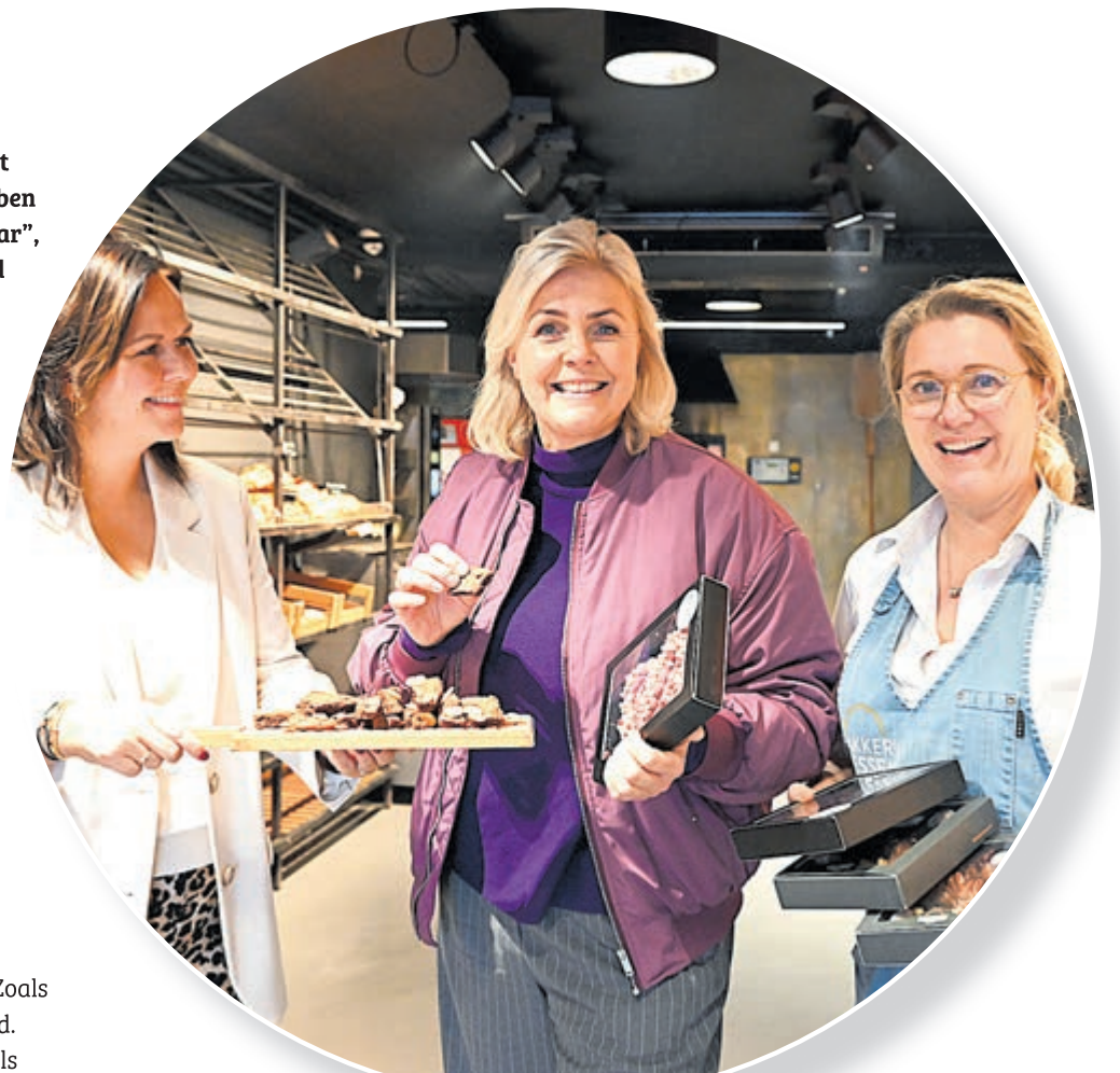
Bakkerij Van Vessem