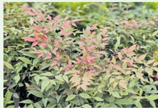
Hemelse bamboe.

Hillegom/Vijfhuizen - Het grote nadeel van een tuin is vaak dat de ruimte beperkt is. Dat maakt het extra belangrijk om voor de juiste planten te kiezen. Het liefst hebben we planten die het grootste deel van de tijd leuk zijn om naar te kijken. Een plant die prima aan die wens voldoet is de hemelse bamboe ( Nandina domestica ). Deze middelgrote heester heeft niets met bamboe te maken, behalve dan misschien dat hij oorspronkelijk uit Azië komt. Hij heeft een elegante