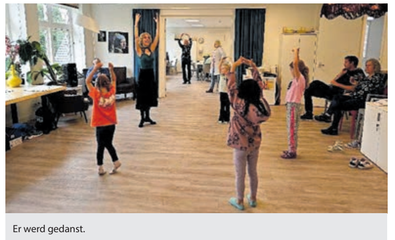
Er werd gedanst.

Ook volgend jaar is er weer een Burendag, de laatste zaterdag van de maand september.