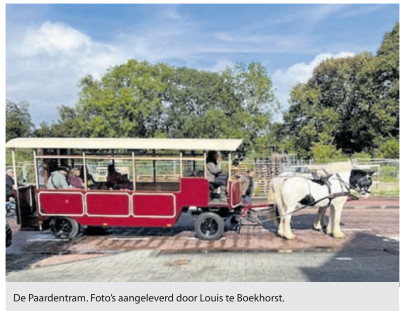
De Paardentram.

Het weer werkte aan het begin niet zo goed mee, en vanwege de heftige regenval kwam de paardentram later dan verwacht op de locatie Plein 1 aan, maar ging vervolgens 'volgeladen' weer op weg naar de andere locaties.