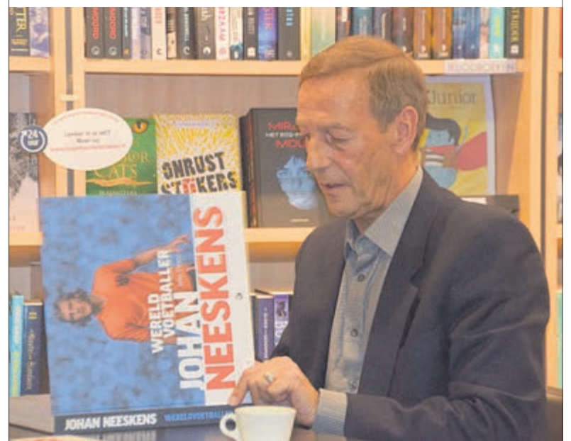
Op 12 januari 2018 signeerde Johan zijn boek bij Boekhandel Blokker.

Met het overlijden van Johan Neeskens verliest Nederland een groot voetbalicoon.