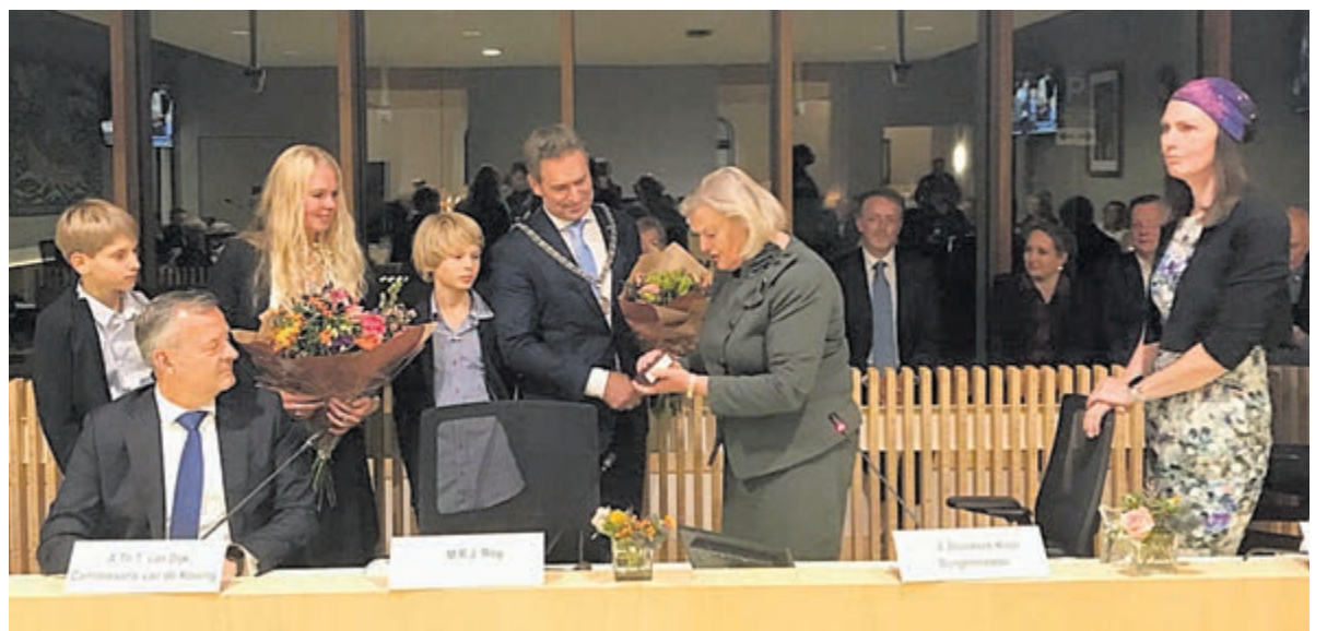
De nieuwe burgemeester en zijn gezin worden verwelkomd.

Het protocol werd keurig en zonder incidenten gevolgd. Na het voorlezen van het koninklijk besluit werd de eed afgelegd en konden ambtsketen en voorzittershamer worden