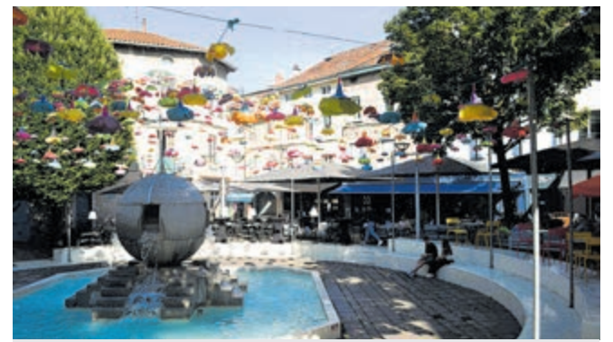
Fontein in hart van de stad op Place Edgar Quinet.