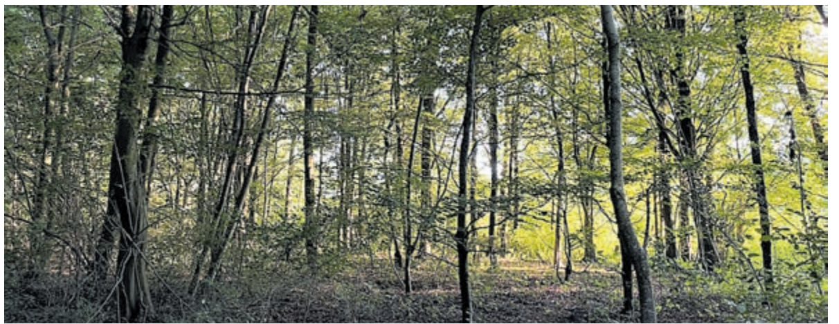
Haarlemmermeerse Bos.