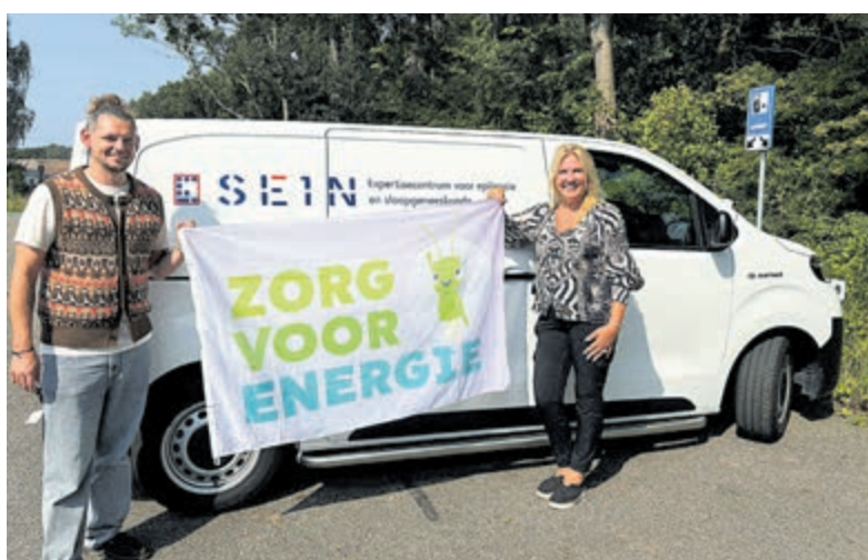
Beeldmedewerkers van de Hartekamp Groep, Viva! Zorggroep en het Sein met de campagnevlag.

Met de campagne 'Zorg voor Energie' wil Milieu Platform Zorgsector (MPZ) verduurzaming van organisaties in de zorg versnellen. Dit initiatief wordt ondersteund door het Expertisecentrum Verduurzaming Zorg en de zorgbranches ActiZ, de Nederlandse ggz, Vereniging Gehandicaptenzorg Nederland, Nederlandse Vereniging van Ziekenhuizen en Nederlandse Federatie van Universitair Medische Centra.