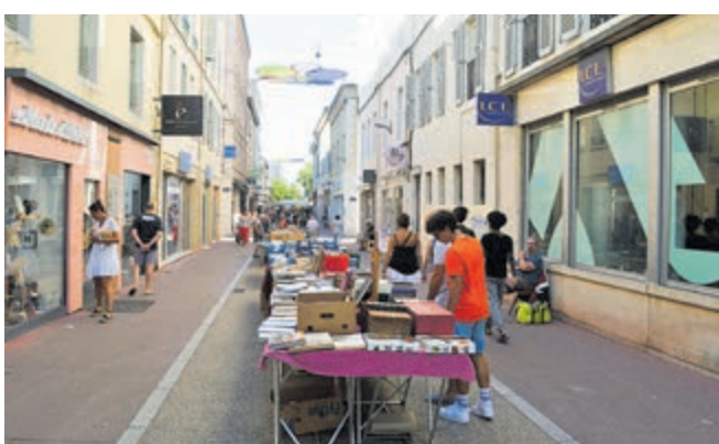
Boekenmarkt in Rue Pasteur.