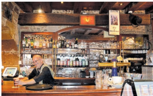
Gastvrije barretjes en restaurants.