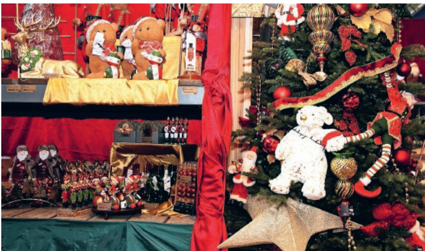
■ Inspiratie te kust en te keur. Trudy Witteman