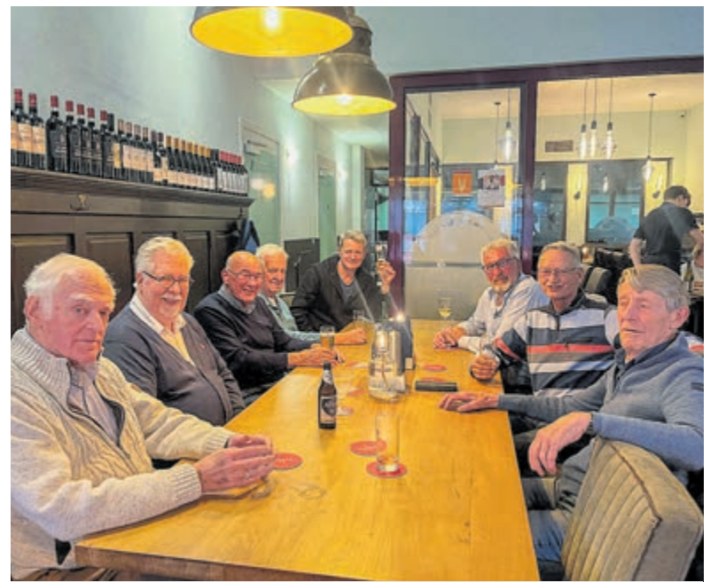
De Heemstede veteranen delen verhalen en herinneringen aan de stamtafel van het Veteranencafé.