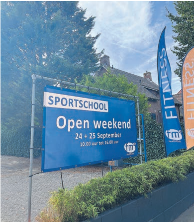
Open weekend bij FM Health.