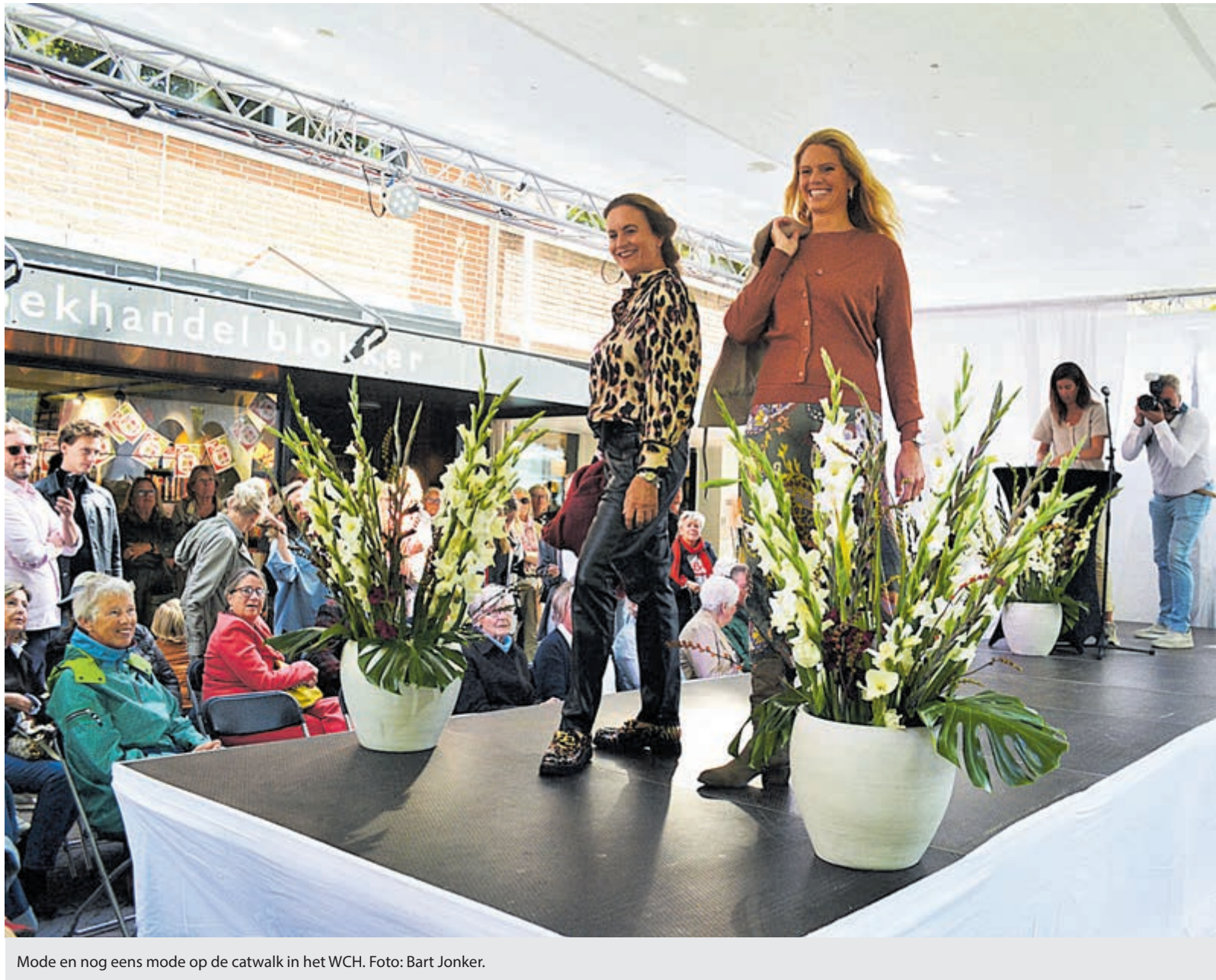
Mode en nog eens mode op de catwalk in het WCH.