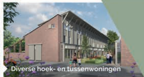
Diverse hoek- en tussenwoningen