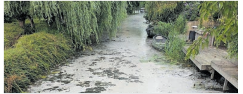
Vervuild water in Rivierenbuurt.

Meer informatie en aanmelden: maartje@maartjebroekmans.com . Tel: 0624621234.