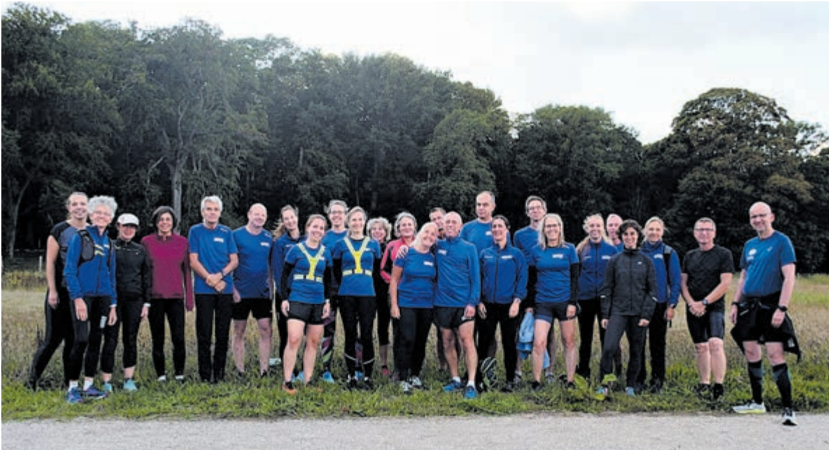
De loopgroep van de Vijfde VerjaardagRun.