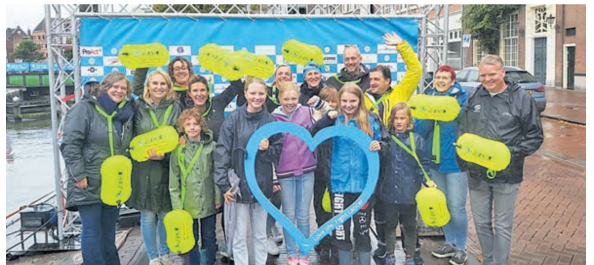
Team 'HPC Heemstede Zwemt Mee Voor Henny!'. Foto aangeleverd.

Groot was de teleurstelling toen afgelopen vrijdag werd besloten dat de Swim niet door kon gaan vanwege de vele blauwalg in het Spaarne. Maar ook nu bleek Team 'HPC Zwemt Mee Voor Henny!' weer veerkrachtig. Direct werd er besloten om op zondagmiddag toch met elkaar naar het programma op het land te gaan. Met hun knalgele