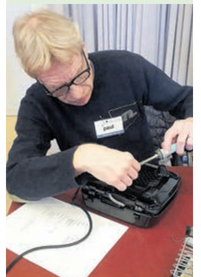
Het repaircafé Vogelenzang start weer. Foto aangeleverd.

Aanleveren wel vóór 12.30 uur, omdat het repaircafé om 13 uur sluit en dan wordt het lastig om reparaties nog voor elkaar te krijgen. Ingeval van vragen over een eventuele reparatie, kunt u een bericht sturen naar: repaircafevogelenzang@yahoo.com of bel naar 0653561413.