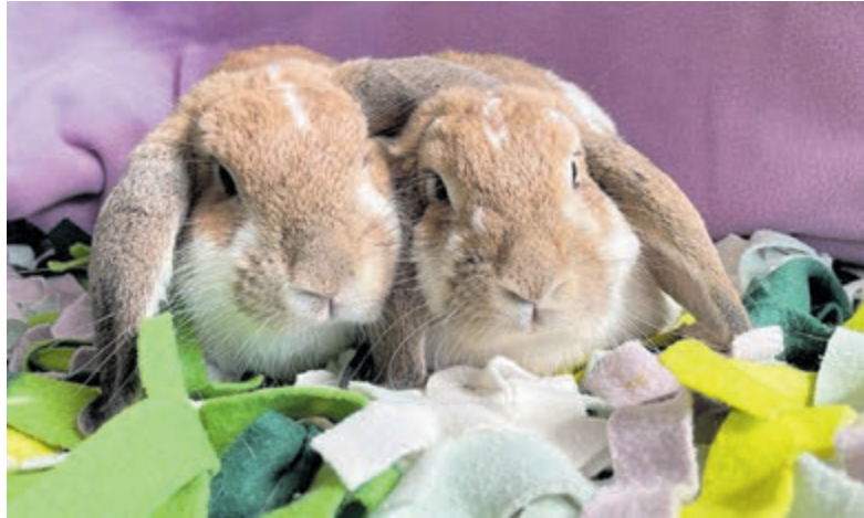
Konijnen Dille en Kamille.