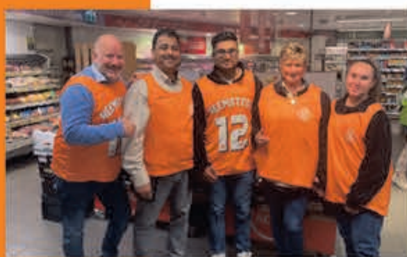
PLUS Heemstede J. v. Goyenstraat 21-23 Uithoorn

ZONDAG 16 JUNI, 15.00 U. POLEN-NEDERLAND 0-5 VRIJDAG 21 JUNI, 21.00 U. NEDERLAND-FRANKRIJK 5-0 DINSDAG 25 JUNI, 18.00 U. NEDERLAND-OOSTENRIJK 5-0