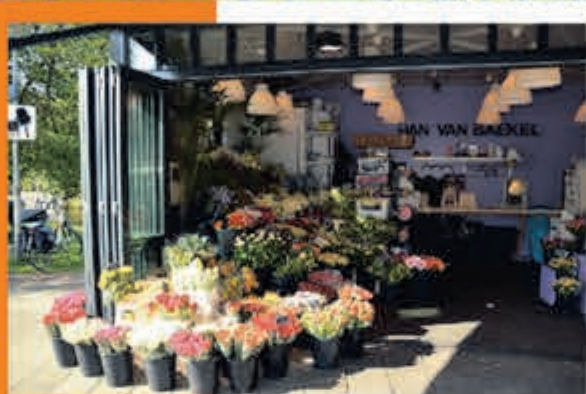
Bloemenhandel Han van Baekel Adriaan van Ostadeplein 6 Heemstede

ZONDAG 16 JUNI, 15.00 U. POLEN-NEDERLAND 0-2 VRIJDAG 21 JUNI, 21.00 U. NEDERLAND-FRANKRIJK 1-2 DINSDAG 25 JUNI, 18.00 U. NEDERLAND-OOSTENRIJK 1-0