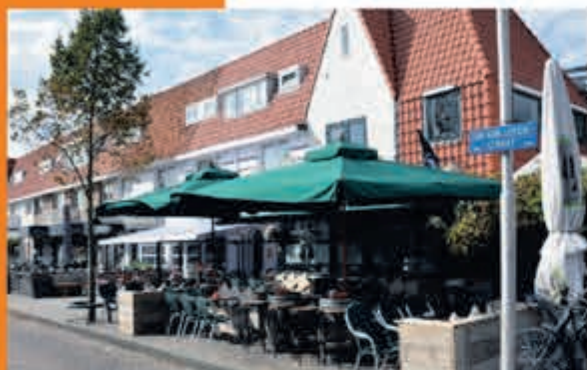
De Groene Druif J. v. Goyenstraat 33 Heemstede

ZONDAG 16 JUNI, 15.00 U. POLEN-NEDERLAND 0-5 VRIJDAG 21 JUNI, 21.00 U. NEDERLAND-FRANKRIJK 5-0 DINSDAG 25 JUNI, 18.00 U. NEDERLAND-OOSTENRIJK 5-0