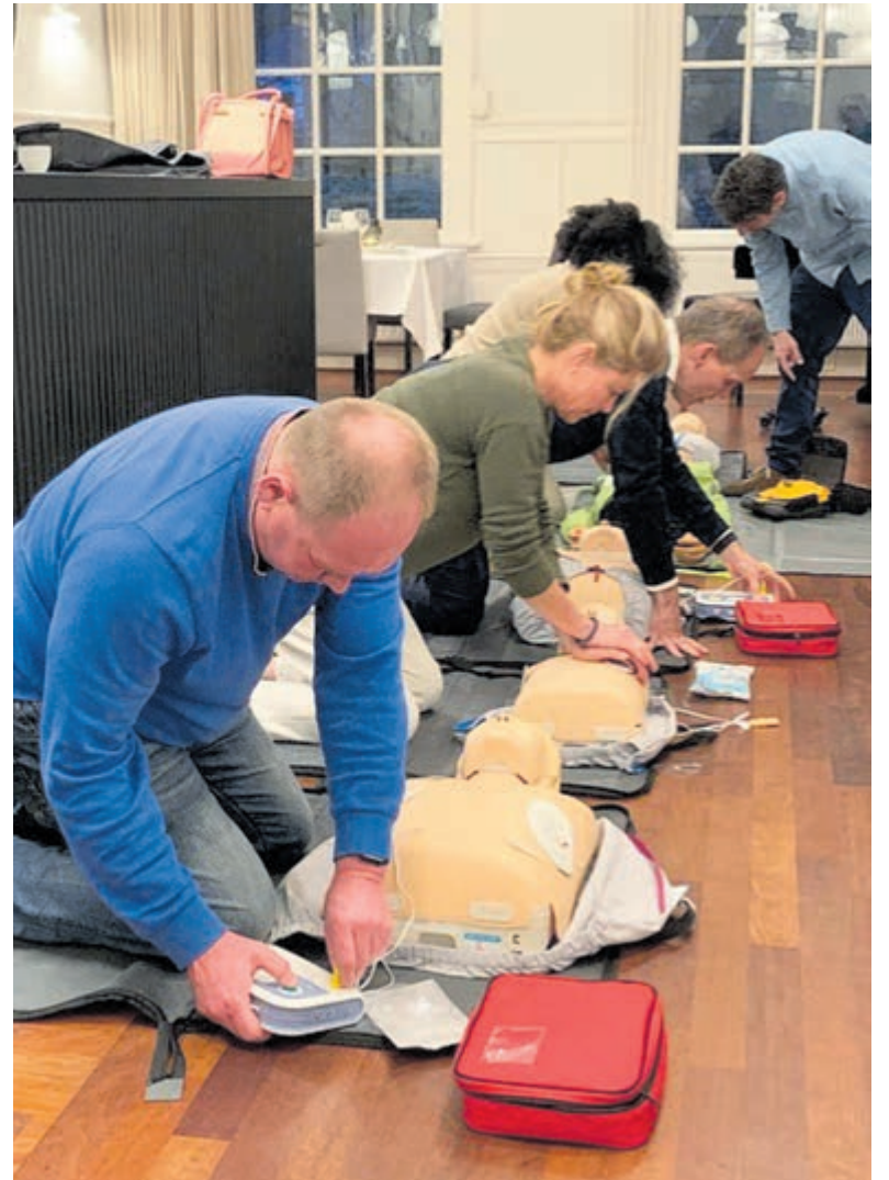
Reanimatietrainingen bij EHBO Heemstede.

Wil jij je ook aanmelden voor een reanimatie training? Ga dan naar www.ehboheemstede.nl . Voor meer informatie over Rotaryclub Heemstede check: www.rotary.nl/heemstede .