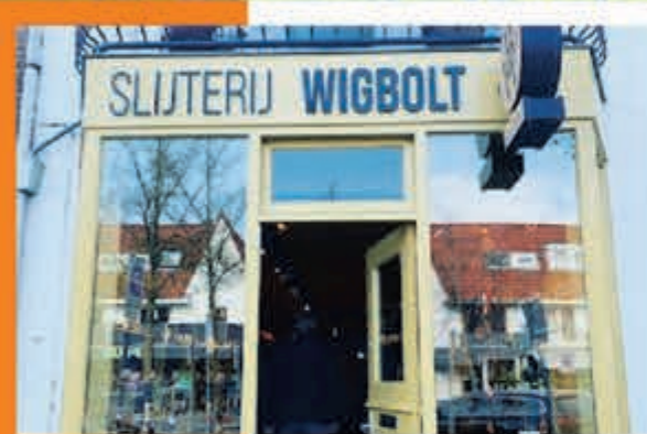
Slijterij Wigbolt J. v. Goyenstraat 12 Heemstede

ZONDAG 16 JUNI, 15.00 U. POLEN-NEDERLAND 1-1 VRIJDAG 21 JUNI, 21.00 U. NEDERLAND-FRANKRIJK 1-2 DINSDAG 25 JUNI, 18.00 U. NEDERLAND-OOSTENRIJK 2-1