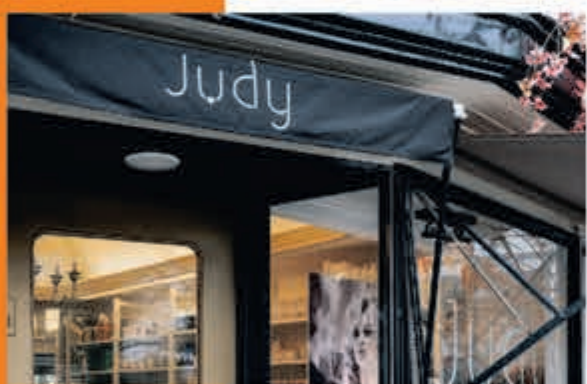
Judy Beauty Boutique J. v. Goyenstraat 35 Heemstede

ZONDAG 16 JUNI, 15.00 U. POLEN-NEDERLAND 0-2 VRIJDAG 21 JUNI, 21.00 U. NEDERLAND-FRANKRIJK 0-2 DINSDAG 25 JUNI, 18.00 U. NEDERLAND-OOSTENRIJK 2-0