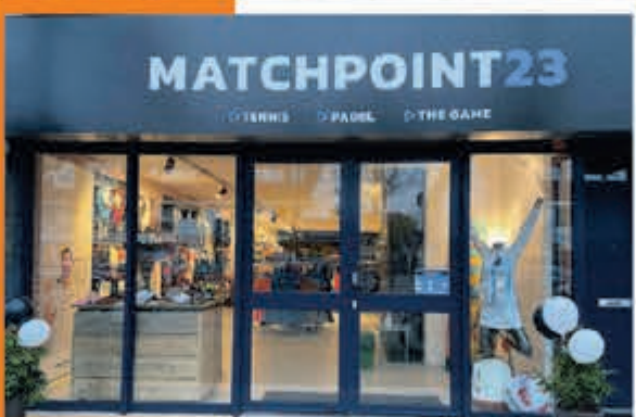
Matchpoint23 J. v. Goyenstraat 14 Heemstede

ZONDAG 16 JUNI, 15.00 U. POLEN-NEDERLAND 0-2 VRIJDAG 21 JUNI, 21.00 U. NEDERLAND-FRANKRIJK 0-1 DINSDAG 25 JUNI, 18.00 U. NEDERLAND-OOSTENRIJK 1-0