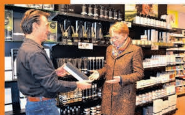
DA Drogisterij & Parfumerie J. v. Goyenstraat 13 Heemstede

ZONDAG 16 JUNI, 15.00 U. POLEN-NEDERLAND 0-2 VRIJDAG 21 JUNI, 21.00 U. NEDERLAND-FRANKRIJK 2-2 DINSDAG 25 JUNI, 18.00 U. NEDERLAND-OOSTENRIJK 3-0