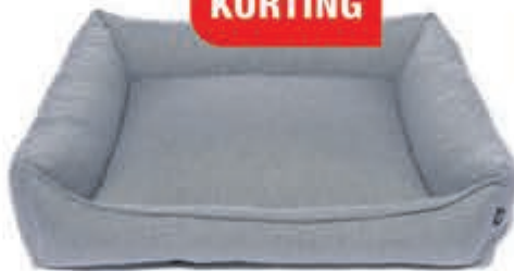
snObbs orthopedische hondenmand Kingston Diverse maten en kleuren. Vanaf 64.95 51.95