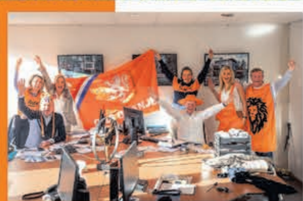
Van Wonderen Makelaars J. v. Goyenstraat 16 Heemstede

ZONDAG 16 JUNI, 15.00 U. POLEN-NEDERLAND 1-2 VRIJDAG 21 JUNI, 21.00 U. NEDERLAND-FRANKRIJK 3-0 DINSDAG 25 JUNI, 18.00 U. NEDERLAND-OOSTENRIJK 2-0