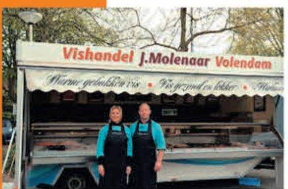
Vishandel John Molenaar J. v. Goyenstraat Heemstede

ZONDAG 16 JUNI, 15.00 U. POLEN-NEDERLAND 1-1 VRIJDAG 21 JUNI, 21.00 U. NEDERLAND-FRANKRIJK 1-3 DINSDAG 25 JUNI, 18.00 U. NEDERLAND-OOSTENRIJK 2-0