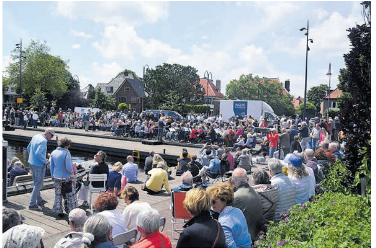
Drukte in de Haven van Heemstede voor het Havenconcert.

Het wordt een non-stop programma van 14 tot 16 uur. Het Symfonisch Blaasorkest blies de aftrap met een compilatie van musicalmuziek. Voor het Voorwegkoor was het de 'eerste keer' aan de haven. Die zongen ze dan ook van harte toe met fraaie liederen, want ze stonden met hun rug naar het publiek. Dat kon ook niet anders, want de dirigent stond aan de havenkant, evenals de muzikale begeleiding. Ook het zingen zonder microfoons en versterkers deed het vocale gebeuren tekort en dat was erg jammer. Ondertussen had de Harmonie St. Michaël zijn