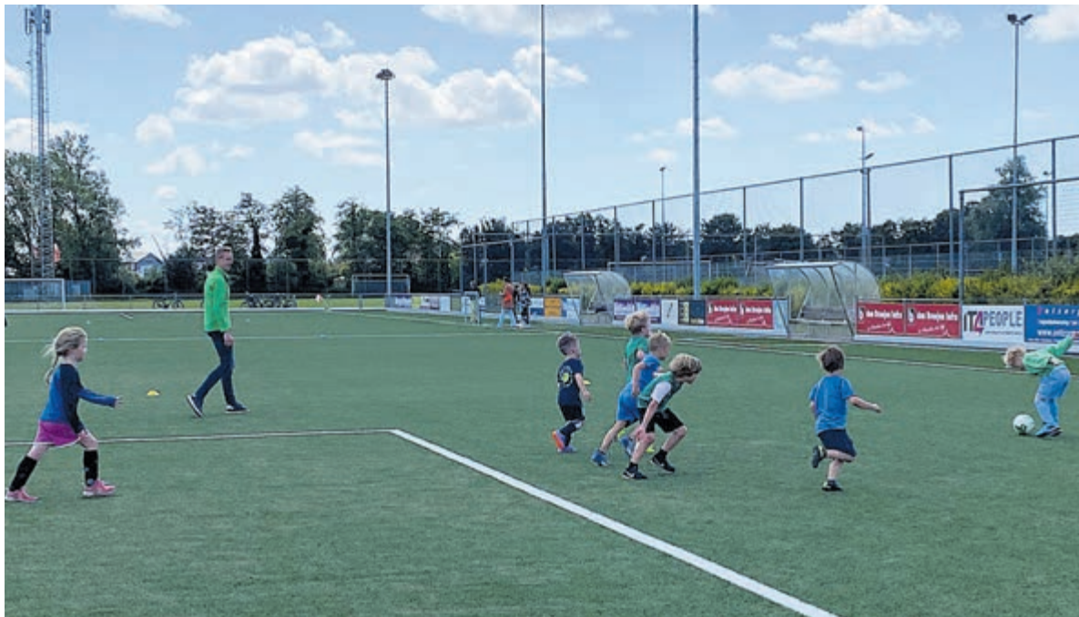
Groep 2 van de Ark had veel plezier op het schoolvoetbaltoernooi.