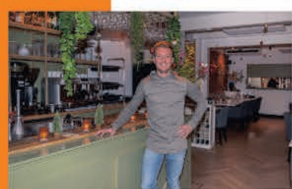
Brasserie Boudewijn J. v. Goyenstraat 31 Heemstede

ZONDAG 16 JUNI, 15.00 U. POLEN-NEDERLAND 0-1 VRIJDAG 21 JUNI, 21.00 U. NEDERLAND-FRANKRIJK 1-1 DINSDAG 25 JUNI, 18.00 U. NEDERLAND-OOSTENRIJK 2-0