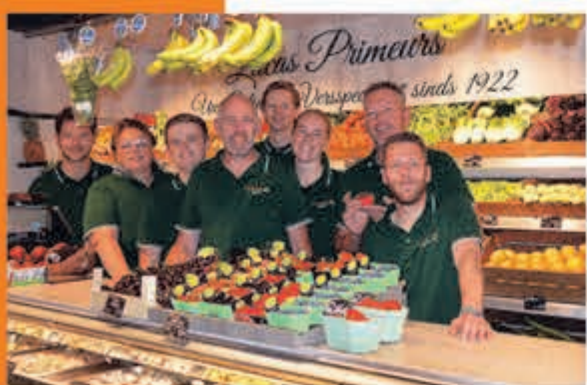
Lucas Primeurs J. v. Goyenstraat 10 Heemstede

ZONDAG 16 JUNI, 15.00 U. POLEN-NEDERLAND 1-2 VRIJDAG 21 JUNI, 21.00 U. NEDERLAND-FRANKRIJK 1-3 DINSDAG 25 JUNI, 18.00 U. NEDERLAND-OOSTENRIJK 2-0