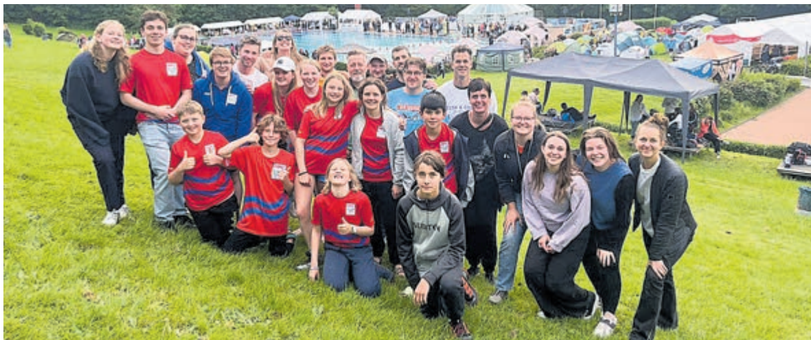
De HPC-groep in het Duitse Hagen.

Heemstede/Hagen - Ook dit jaar is zwemvereniging HPC Heemstede in het Pinksterweekend met 29 enthousiaste wedstrijdzwemmers afgereisd naar Hagen in Duitsland om daar mee te doen aan de 27ste editie van de Internationale Sprint Cup. Om op zaterdagochtend op tijd te zijn voor de wedstrijd, vertrok de bus 's morgens om 5:15 uur vanuit Heemstede richting Hagen. Aangezien de wedstrijd in een buitenbad gehouden werd, waren er onder de HPC'ers toch wat zorgen over de verwachte weersomstandigheden. Gelukkig bleef de verwachte regen en onweer op zaterdag uit en hebben de HPC'ers kunnen genieten van een lekker zonnetje aan de badrand. De sfeer zat er ook dit jaar weer goed in bij de zwemmers en begeleiders van HPC. Terwijl er hard gezwommen werd, werd er op de kant zo hard aangemoedigd dat verschillende HPC'ers al snel hun stem kwijt waren. Dat de sfeer er goed in zat, was ook wel te merken aan het feit dat er zelfs achter het startblok, terwijl er gewacht werd op