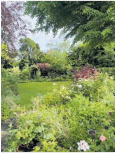
Open Tuinen Weekend in Zuid-Kennemerland.