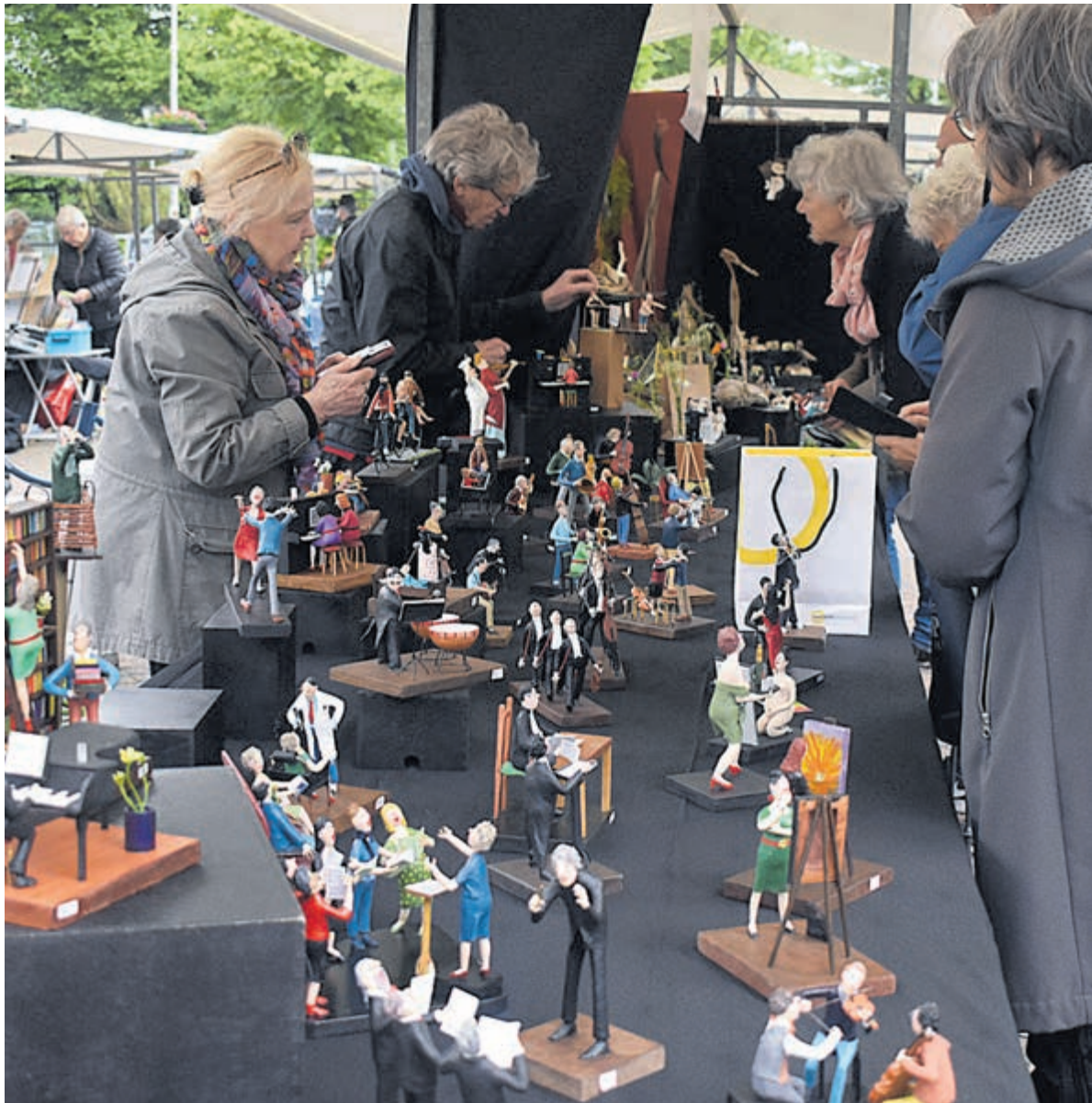
Allerhande kunst te bewonderen in de Jan van Goyenstraat.

Heemstede - Wat een mazzel hadden de standhouders met het weer op de traditionele Kunstmarkt in de Jan van Goyenstraat, die afgelopen zondag 2 juni werd gehouden. Eindelijk eens een dag zonder regen, zodat zij in volle glorie hun kunstuitingen konden tentoonstellen. Er was dan ook weer van alles te zien. Beeldende kunst, houtsnijwerk, sieraden, schilderijen in alle soorten en maten, kussens, werk in glas, tassen of miniatuurtjes. Mooi om te zien tot welke prachtige stukken de kunstenaars, amateurs of professionals komen. Hun geest bedenkt iets en vervolgens komt er iets heel alledaags of juist iets heel apart uit hun handen. Of het nu iemand is die met steen werkt, of een edelsmid het zijn allemaal kunstwerkjes op zich. De bezoekers kwamen rond 10.30 uur langzaam aangelopen om te zien of er iets is waar ze naar op zoek zijn of wat opeens in hun interieur blijkt te passen. Het blijft natuurlijk heel subjectief, het waarderen van kunst. Wat de een schitterend vindt, vindt de ander juist geen betekenis hebben. Zo is het nu eenmaal en dat loopt daarmee in de pas met overige cultuuruitingen. Ook films, toneel, cabaret, muziek e.d. hebben veelal hun eigen publiek. De winkeliers van de Jan van Goyenstraat kunnen met voldoening terugkijken op de jaarlijkse kunstmarkt in 2024. Het is wederom een succes geworden.