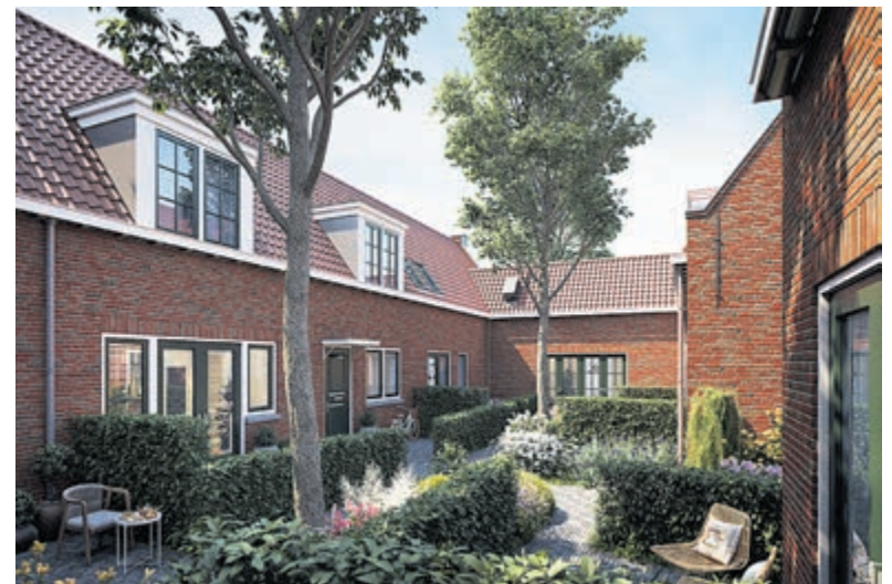
Hofwoningen met binnentuin.