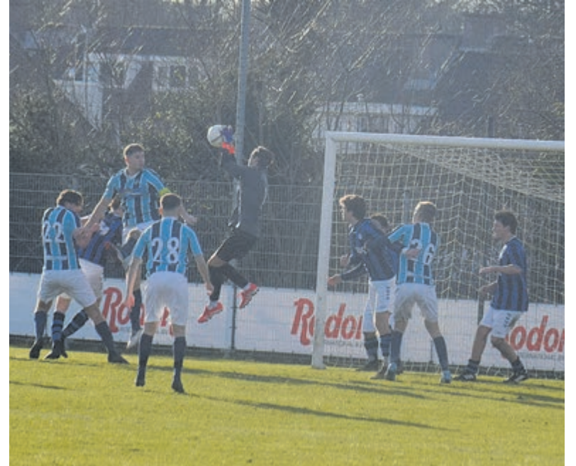
Hoge redding.

De toespraak van de UNO trainer wiep zijn vruchten af. UNO kon het opeens wel opbrengen om uit hun verdedigende stelling te komen en aan te vallen. Opnieuw was er tot