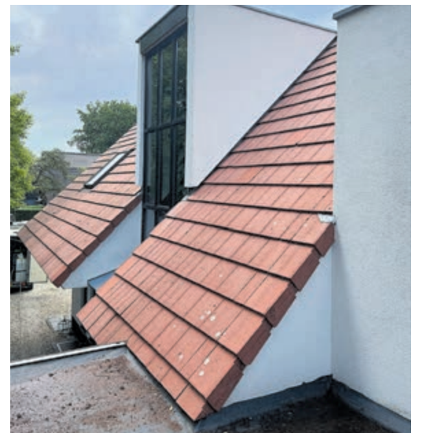
Voor en na reiniging met overduidelijk verschil.