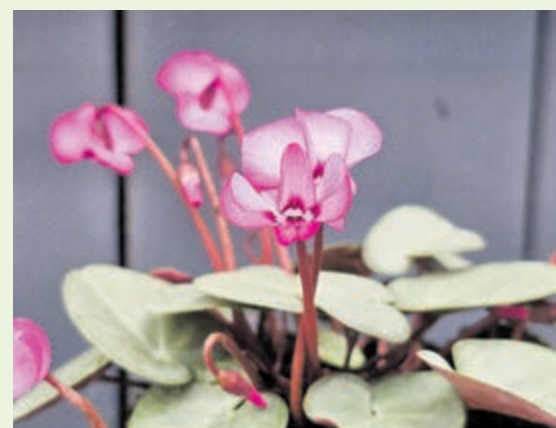
Cyclamen coum.

Hillegom/vijfhuizen - Op de laatste dagen van de winter voelt de lente o, zo heel dichtbij. Zomaar ineens zijn we alweer bij maart beland en overal begint het heel zachtjes aan weer te groeien en te bloeien. De vaste planten beginnen al voorzichtig uit te lopen en de eerste bloemen aan verschillende Magnolia- en Prunussoorten durven het aan om zich te laten zien. De vogels zingen elke dag een beetje luider, het licht