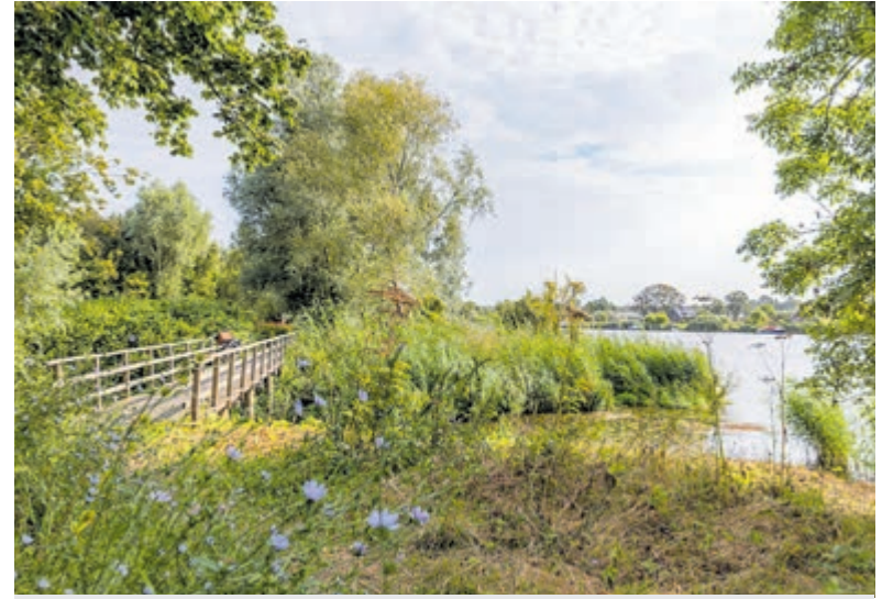
Groen gebied in 't Groot Clooster.

Via de site www.grootclooster.nl kunnen inwoners en belanghebbenden zich aanmelden voor de bijeenkomst. In maart en april staan verder straatgesprekken, wandelingen en een afsluitende bijeenkomst op de planning.