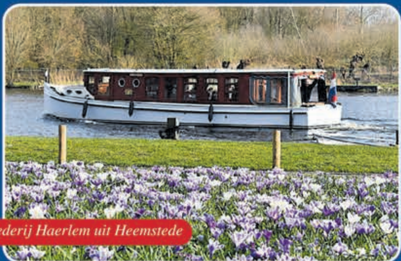
Rederij Haerlem uit Heemstede

Varen in Holland met de luxe salonboot 'Heerlijkheid'