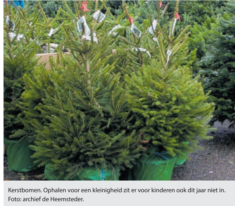
Kerstbomen. Ophalen voor een kleinigheid zit er voor kinderen ook dit jaar niet in.