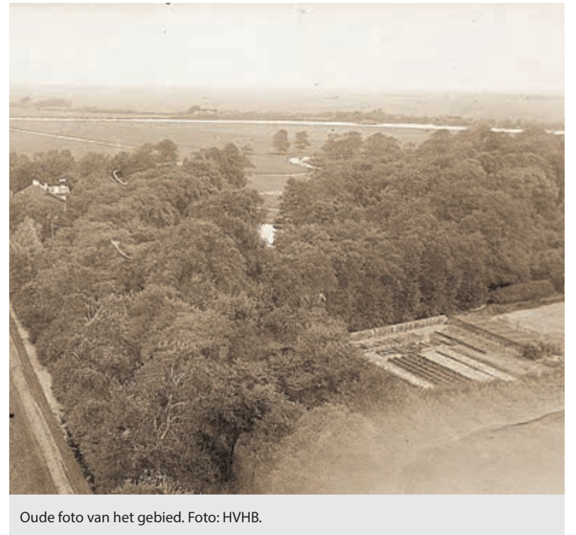
Oude foto van het gebied. Foto: HVHB.

(Bron: boek 'Landgoed Hageveld Heemstede, 5000 jaar bewonersgeschiedenis, door F.R. Hazenberg.)