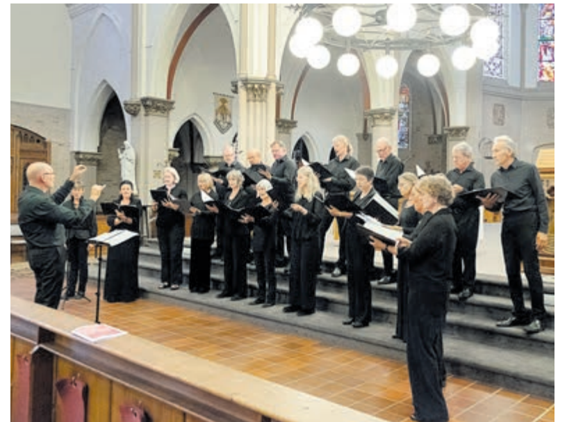
Sola Re Sonare.

Boekhandel Blokker, Binnenweg 138, Heemstede. Tel. 023 5282472.