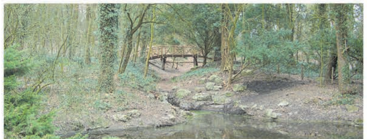
Natuurgebied 'de Overplaats'.

Nadere informatie en aanmelden op www.landschapnoordholland.nl/activiteiten .