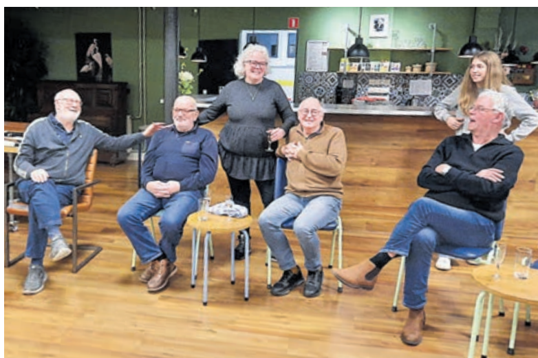
Feestelijk moment om stil te staan bij 100 jaar De Molenwerf.

In de avond van de 12e werd er door buurtbewoners samen met de biljartgroep geproost op de volgende 100 jaar! Deze avond was de start van de wekelijkse ontmoetingsavond