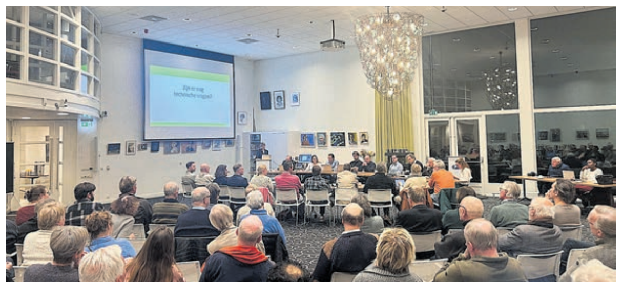
Volle raadszaal tijdens de openbare technische sessie over de plannen Van Merlenlaan.

In de komende maand(en) komt het collegevoorstel opnieuw in de gemeenteraad, pas dan valt de beslissing. Alle politieke partijen zullen zich achter de oren krabben hoe de massale proteststemmen te waarden.