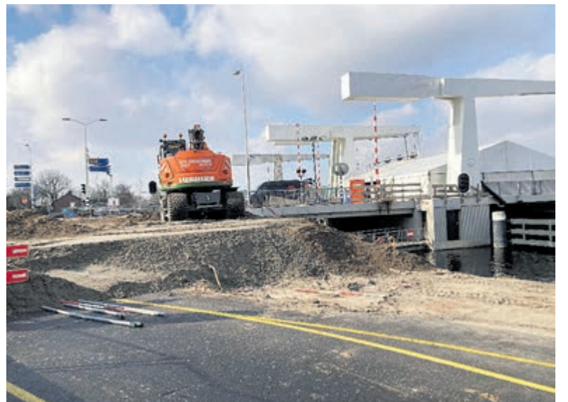
Er wordt duidelijk gewerkt aan een stukje verhoging van de weg.