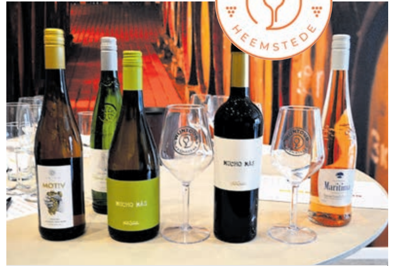
Tijdens de Wijntour kunnen er fijne wijnen worden geproefd. Je kunt meedoen met een speciaal Wijntour-glas, hier op de foto.

Dit jaar introduceert de organisatie (WCH) bij De Wijntour een stempelkaart die de deelnemer laat afstempen bij elke winkel waar hij/zij een glaasje wijn haalt.