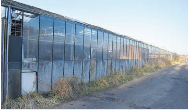
Huidige kassen in het gebied.