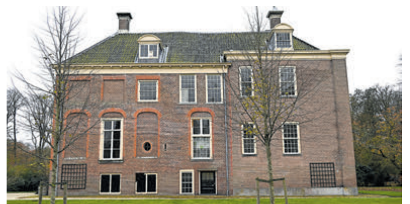
Rechterzijkant Huis te Manpad.

Het park van Huis te Manpad, Herenweg 9 te Heemstede is alleen in excursieverband te bezoeken. Ook dit jaar weer van begin februari t/m 15 oktober is er iedere zaterdag om 10.00 uur een excursie. Van februari t/m mei is er ook op dinsdag om 14 uur een rondleiding. Op deze tijdstippen staat er bij de poort een gids klaar die u, als belangstellende meeneemt voor een boeiende wandeling. Aanmelden is niet nodig en er worden geen kosten berekend. Het hoofdhuis en de overige woningen worden particulier bewoond en zijn dus niet te bezichtigen. Een groepsbezoek is ook buiten de openstellingstijden mogelijk, behalve op