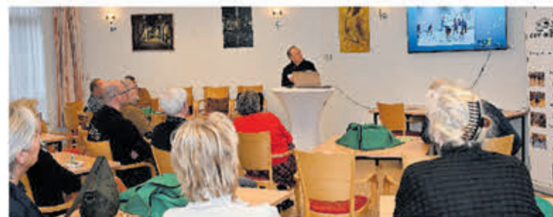
Tekst en uitleg.

andere sporthal in Haarlem worden gehouden. Nordic Walking is een sport die met veel verve werd uitgelegd door de instructeur die deze sport al meer dan 17 jaar beoefent. In wandelbos Groenendaal en in de Amsterdamse Waterleidingduinen wordt op zaterdag gelopen. Na het zien van de Nordic Walking song krijg je als bezoeker meteen zin in om mee te doen. Deze sport is echter pas veilig te beoefenen na het volgen van een cursus, de Nordic Walking stokken krijg je dan te leen. Naast dit alles is er nog een belangrijke tak vertegenwoordigd, de denksporten bridge en klaverjas. En ook deze kaartspelen zijn als gymnastiek, maar dan voor de hersenen. Zelfs het immuunsysteem wordt versterkt.