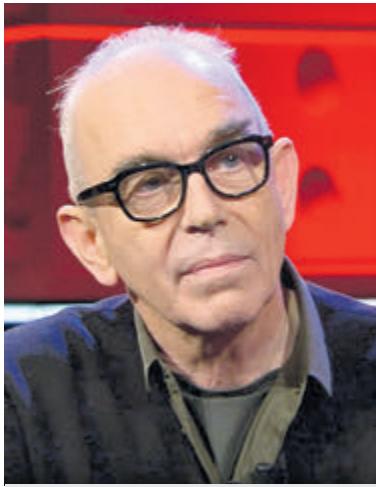
Joos Swarte.

In dit boek wordt een poging gedaan die sleutelmomenten te reconstrueren. Journalist Ward Wijndelts sprak urenlang met Joost Swarte en andere bepalende figuren in diens leven, keerde lades om met jeugdtekeningen en nooit gepubliceerde schetsen - op zoek naar de gebeurtenissen die leidden tot de methode-Swarte.