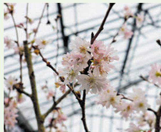
Een sierkers als de Prunus.

Hillegom/vijfhuizen - Sierkersen behoren tot de soorten bomen waarvan men het meest uitkijkt naar het moment dat ze gaan bloeien. Het is bijna magisch, het ene moment zitten ze nog vol met knop en dan, met een zonnetje op een wat zachtere dag, is de hele boom veranderd in een wolk van witte of roze bloesem. En weer wat later vormt er een zacht tapijt onder