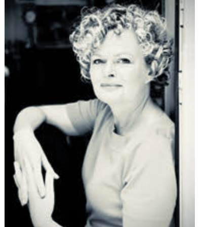
Anne-Gine Goemans.

Anne-Gine Goemans (1971) is werkzaam als schrijver, journalist en scenarioschrijver. Ze debuteerde met de veelgeprezen roman Ziekzoekers en won daarmee de Anton Wachterprijs 2008. Met Glijvlucht won ze de Dioraphte Jongerenliteratuur Prijs 2012 en de Duitse M-pionier Prijs voor beste literaire nieuwkomer. Honolulu King (2015), waarvan meer dan 60.000 exemplaren werden verkocht, wordt verfilmd door NL Film. Hierop volgde de roman Holy Trientje. Goemans' recentste roman,