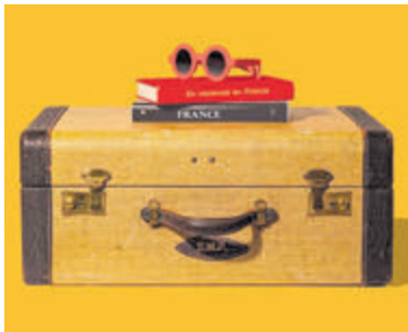
Haal meer uit uw Franse vakantie.

Kennemerland -Wie kent de Alliance Française niet? Een organisatie van vrijwilligers die zich over de hele wereld inzet voor de Franse taal en cultuur. In Kennemerland worden cursussen georganiseerd in Haarlem-Noord, Haarlem-Centrum en in Heemstede. Met kleine lesgroepen, lesstof uit het dagelijks leven en enthousiaste en gekwalificeerde docenten leert u de Franse taal op een degelijke manier. Frans spreken opent, vooral in Frankrijk, vele deuren. In februari begint het tweede semester van de cursussen en er zijn nog enkele plaatsen beschikbaar op alle niveaus. Op de website is een gratis test te vinden om uw niveau te bepalen. Mail de cursuscoördinator (cursus.kennemerland@afpb.nl) voor des-