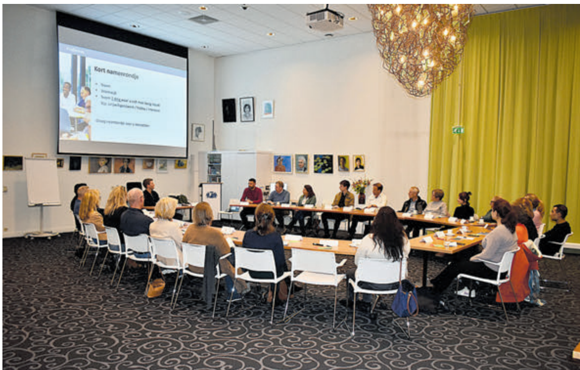
Grote groep cursisten.