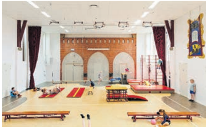
Ook de kerk in Zuidermeer heeft een nieuwe bestemming.

Regio - In Paviljoen Welgelegen aan de Paviljoenslaan 3 in Haarlem is vanaf vrijdag 17 januari een expositie te zien over historische Noord-Hollandse panden met een nieuwe bestemming. Fotograaf Lars van den Brink laat zien hoe deze gebouwen door menselijke inventiviteit nieuw leven en bestaansrecht hebben gekregen. Zoals restaurant de DAKKAS op een parkeergarage in Haarlem en Fort Markenbinnen als opleidingslocatie.