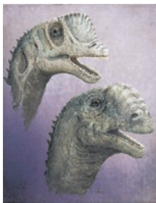
Afbeelding: Mark Witton, Europasaurus holgeri (2017).

nomakers krijg je een overzicht van twee eeuwen paleokunst: de spannende, verrassende en soms controversiële verbeelding van dino's en ander prehistorisch leven door kunstenaars en wetenschappers. Fossielen, schilderijen, tekeningen, toverlantaarnplaatjes, films en modellen: wonder je over de enorme verbeeldingskracht van de dinomakers en ontdek hoe hun creaties steeds veranderden. Dinomakers is te zien van 31 januari tot en met 1 juni. Dinomakers wordt gemaakt in samenwerking met gastconservator Esther van