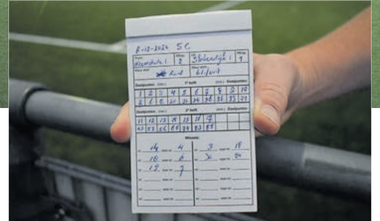
Het boekje van de scheidsrechter.