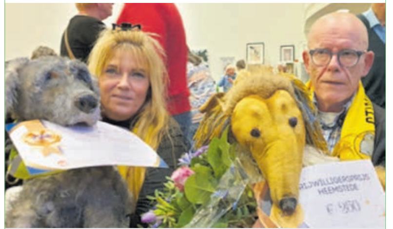
Vrijwilligerswerk, mooi werk.

Ben je geïnspireerd en wil je ook meedoen in het vrijwilligerswerk? Voor meer informatie: www.vrijwilligerswerkheemstede.nl .