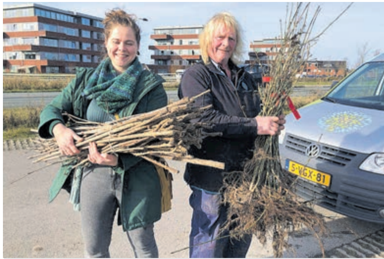
Voor gratis bomen is altijd veel belangstelling.

Om te voorkomen dat iedereen tegelijk komt, is inschrijving op een tijdslot verplicht. Inschrijven voor een tijdslot kan via de link: https://bomenplanner.meerbomen.nu/portal/events/2889 . Bij aankomst wordt u ontvangen bij een informatietafel en geholpen bij de keuze van boompjes. U dient zelf voor een zak of ander materiaal te zorgen om de boompjes in mee te nemen. Voor meer informatie: 06-48226490 (Franke van der Laan) of info@stichtingmeergroen.nl .