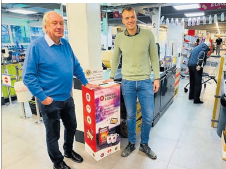
Plus Glipperdreef.