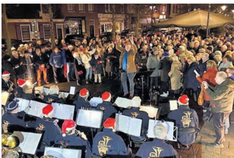
Een vol plein voor de Kerstsamenzang.