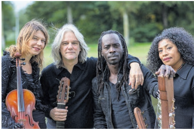
Boi Akih: Foto: Matthieu Landweer.

Bij bestelling via website of kassa ontvang je een tweede kaartje gratis. 'Messiah' van Händel van het muzikale gezelschap BOI AKIH op zaterdag 14 december in Concertzaal De Oude Kerk aan het Wilhelminaplein, aanvang 20.15u. Kaarten bestel je via podiaheemstede.nl .