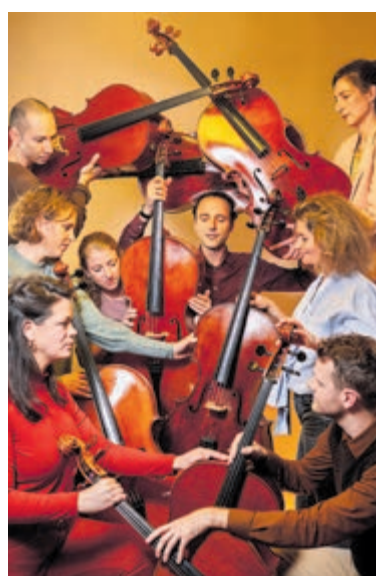
Cello Octet Amsterdam.

15.00 uur, de Agathakerk is gelegen aan de Grote Krocht 45. De deuren openen om 14.15 uur. Er is parkeergelegenheid in de parkeergarage naast de kerk. Kaarten à 25 euro zijn aan de zaal verkrijgbaar (pinnen kan) en via de site www.classicconcerts.nl . En, uitsluitend contant, via Kaashuis Tromp, tegenwoordig de Zuivelhoeve, Grote Krocht 3-5, Zandvoort. Voor vrienden en een introducee met korting à 20 euro (als ze via de website bestellen). Voor jongeren tot 18 jaar 10 euro. Consumpties in de pauze of een drankje na afloop kunnen in de kerk alleen contant betaald worden.