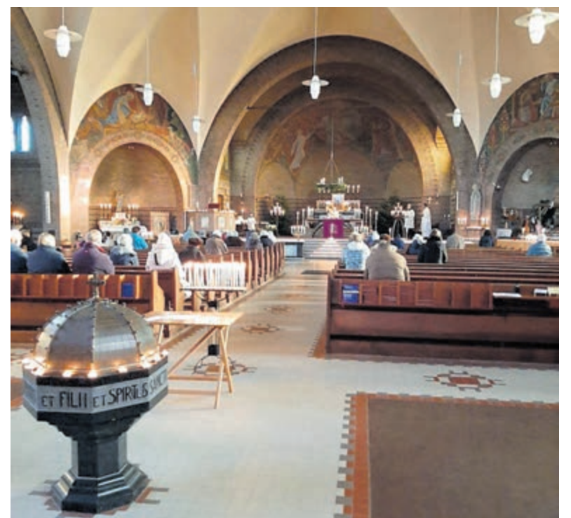
Stemmig in de kerk.

Locatie: Valkenburgerplein 20. Heemstede.