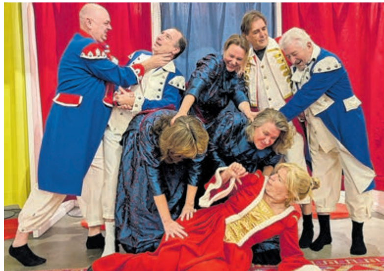
Groepsfoto Haarlemsche Tooneel Club.

Na het in ontvangst nemen van het applaus door de gehele vereniging is het aan de voorzitter om de jubilaris in het zonnetje te zetten. Ook dit verloopt niet helemaal vlekkeloos en vanaf dat moment gaat alles moeizaam. De sfeer zakt in een razendsnel tempo naar een dieptepunt. Alle welgemeende beleefdheden maken plaats voor ongezouten meningen en het is nog maar zeer de vraag of Charivarius de avondvoorstelling gaat halen. Misschien helpt de gezamenlijke maaltijd bij de pizzeria om de problemen met elkaar op te lossen. Hoewel, niet iedereen eet mee... De spelers zijn zichzelf, maar ook