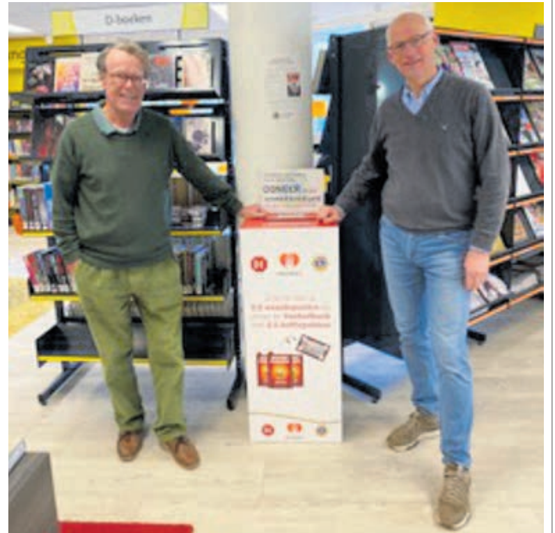
Inzamelpunt in de Bibliotheek Bloemendaal.

De diverse Lions Clubs in de regio Zuid-Kennemerland hebben op een aantal locaties in Bloemendaal, Heemstede en Bennebroek zuilen geplaatst. Het verzamelen van DE-punten en vreemd en oud geld is dus een gezamenlijke actie van Lions Clubs in de Zone Zuid-Kennemerland als onderdeel van de landelijke actie van Lions Nederland. Na 10 januari worden de DE-punten en het geld geteld en ingeleverd op centrale punten. De ambassadeur van de voedselbank René Froger zal een cheque aanbieden aan een vertegenwoordiger van Douwe Egberts marketing. Op basis van de wereldwijde koffiebeurs prijs stelt Douwe Egberts de waarde van de waardepunten vast waar zij, bij wijze van sponsoring, een toeslag aan toevoegen. Op basis hiervan worden de voedselbanken, pro rata naar de opbrengst per regio, voorzien van pakken koffie. Zoals René Froger het traditiegetrouw in zijn speech aanhaalt: "koffiedrinken is een van de oudste sociale gebeurtenissen in