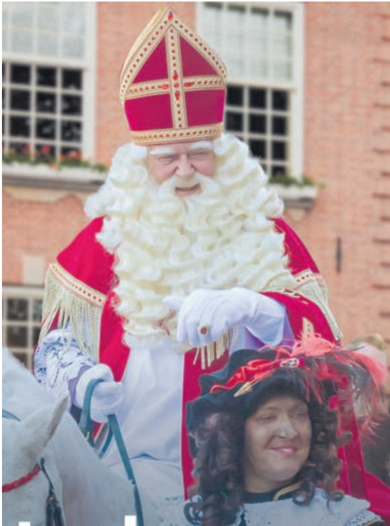
Sinterklaas komt op zaterdag 16 november naar Heemstede. Het publiek kan onder andere genieten van een Talentshow, meld jij je aan? Foto: onderdeel van de Sintposter elders in deze krant.

Aanmelden Stuur een video of gesloten YouTube-link van maximaal 3 minuten waarin je jezelf (jullie) voorstelt en jouw talent laat zien naar sinterklaasintochttheemstede@gmail.com (sluiting inschrijvingen: 10 november). Uit de inzendingen kiest de organisatie 5 acts die mogen optreden op zaterdag 16 november tussen ongeveer 15.30 en 16.30 uur. Zie voor het volledige programma op 16 november de poster elders in deze krant.