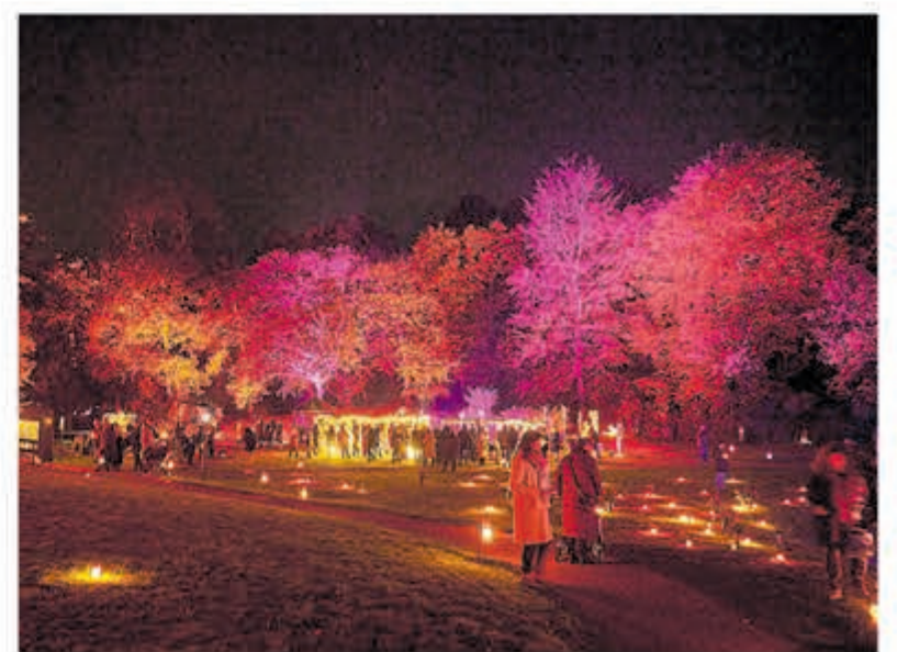
Grote belangstelling voor de Gedenkavond van Westerveld.

Kijk op de website voor meer informatie: www.bc-westerveld.nl .