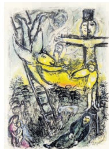
De witte kruisiging (1938).

Na afloop is er nog een hapje en een drankje. De zaal gaat open om 19.30 uur, de toegang is gratis en vooraf aanmelden is niet nodig.