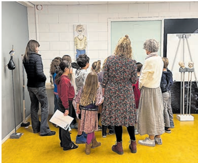
Er wordt aandachtig geluisterd.