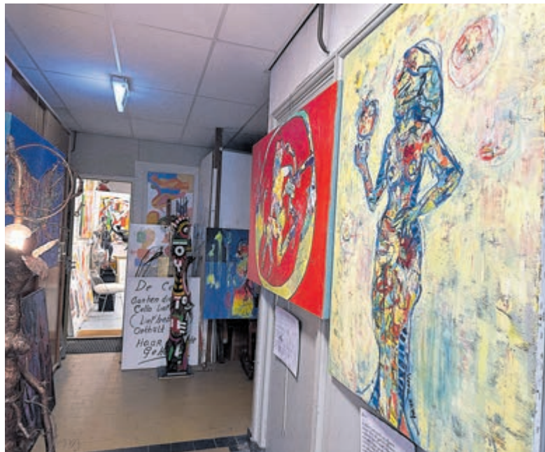
Heel veel kleur in Atelier Voorweg.