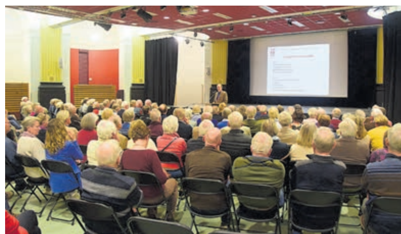
De najaarsbijeenkomst in 2023 trok veel belangstelling in College Hageveld.

Het was geen straf zaterdag en zondag om in een heerlijk zonnetje de verschillende locaties van Kunstlijn per fiets of wandelend te bezoeken. Op de Voorweg, Hageveld, Blekersvaart, Kerklaan openden kunstenaars ook de deuren van hun ateliers. En ook hier namen nieuwsgierigen naar kunst, de kunstenaars en een gemoedelijk gesprekje met hen graag even een kijkje.