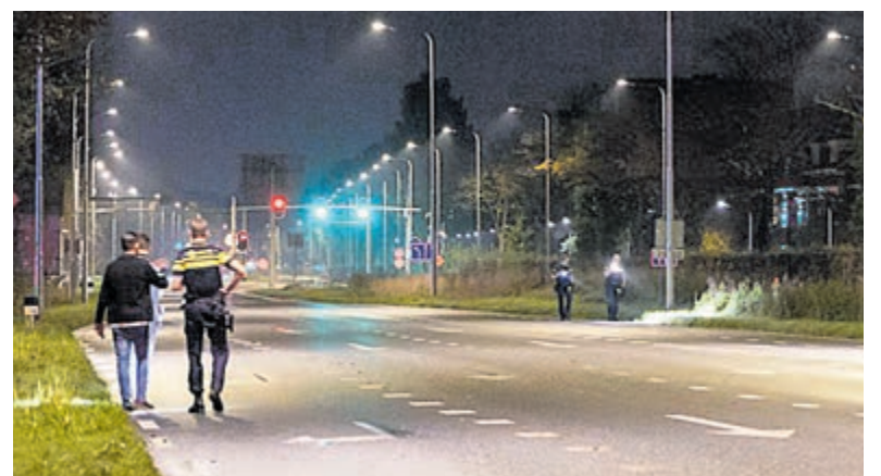
Agenten zoeken tevergeefs naar de sleutels van de taxi.