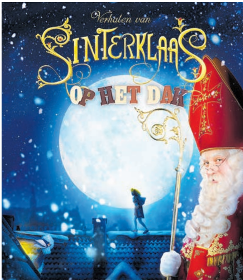
Sint op het Dak in de Jan van Goyenstraat.

De avond begint met een warme opwarming door een sprankelende band die je alvast in de feeststemming brengt. Vervolgens ontvouwt zich een sprookje vol wonderen en plezier, live op het dak. Laat je betoveren door een programma van een uur vol zingen, dansen, en een nostalgisch Sinterklaasverhaal voor de hele familie. Dit is het enige moment in het jaar dat je Sinterklaas en zijn Pieten op het dak kunt zien, dus grijp deze unieke kans om samen met je ge-