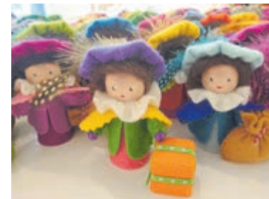
Lieve Sintjes en gezellige Pietjes.