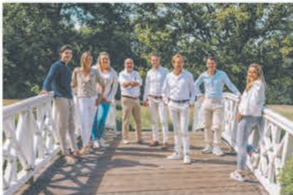
*Het team van wbos makelaars

*Naak vrijblijvend een afspraak voor een oriënterend gesprek en ontdek hoe wij jouw woning optimaal in de markt zetten!