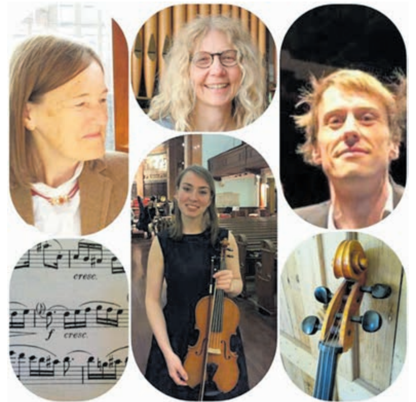
Don Familie.

Een prachtig programma waarbij u van harte welkom bent. Na het concert is er de deurcollecte waarbij uw bijdrage zeer welkom is. Daarna is er in de Pauwehof, onder het genot van thee, koffie en gebak, alle tijd om bij te praten de musici te ontmoeten.