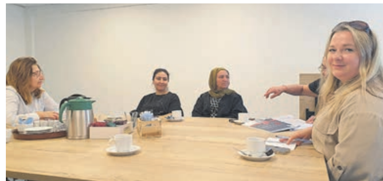
Eerst een kopje thee/koffie, dan met taalles aan de slag.

taalloop en er zijn vrijwilligers aanwezig die helpen. Gestart wordt met koffie/thee en daarna komt een thema aan bod met alle woorden die daarbij horen. Contactpersoon is Ellen Swart van WIJ Heemstede, telefoon 06 -40 30 45 98.