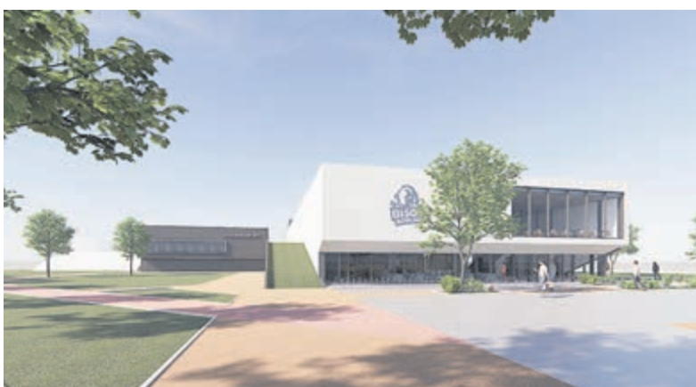
Vooranzicht van het nieuwe uitgaanscentrum aan het Badmintonpad.

Met de komst van Bison Bowling is er een absolute toevoeging aan dit deel van Haarlem. Het is niet enkel het architectonische sluitstuk maar draagt bij aan de sociale controle in de avonden, iets dat mooi aansluit op het Spaarne College, Spaarne Sport en de Duinwijk badmintonhal.