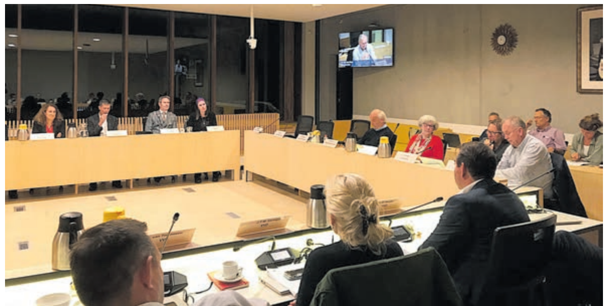
Twee lege stoelen in de raadszaal.

Het eerste agendapunt dat tot discussie leidde was de verhoging van de kosten van diensten door de Omgevingsdienst IJmond. Dat drukt weer extra op de gemeentelijke begroting, maar er is helaas weinig aan te doen. De diensten zijn noodzakelijk en er is geen alternatieve aanbieder. Wel zal de gemeente middels een zgn. zienswijze laten weten dat zij inzicht wil krijgen in de achterliggende redenen. Aan het amendement (door Hart voor Bloemendaal) werd op voorstel van de