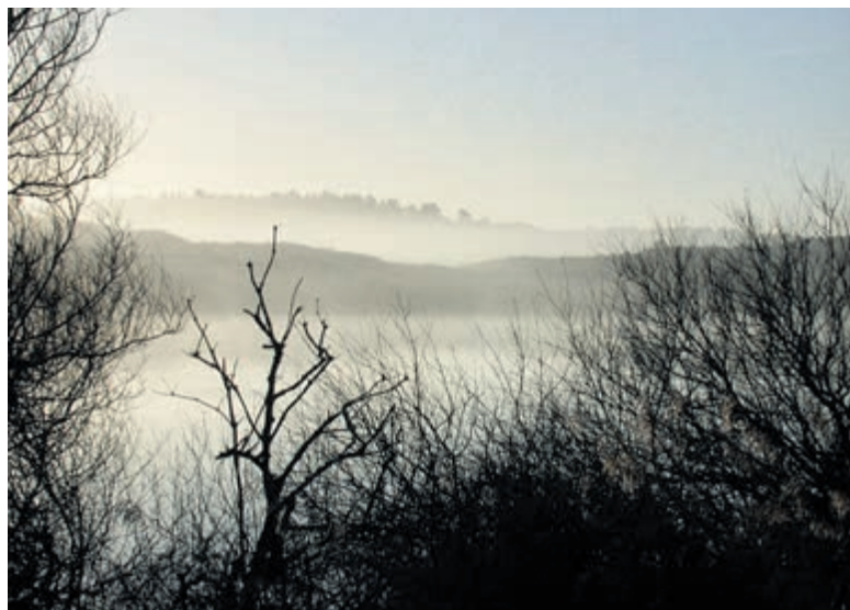
Schemer in het bos- en duingebied.

Een konijn voelt zich het veiligst in de schemering. Konijnen zijn prooidieren waardoor ze constant op hun hoede zijn voor roofdieren. Tijdens de schemering zijn de lichtomstandigheden niet ideaal voor roofdieren waardoor het relatief veilig is voor konijnen om het hol te verlaten en te grazen. Daarmee vallen ze onder de