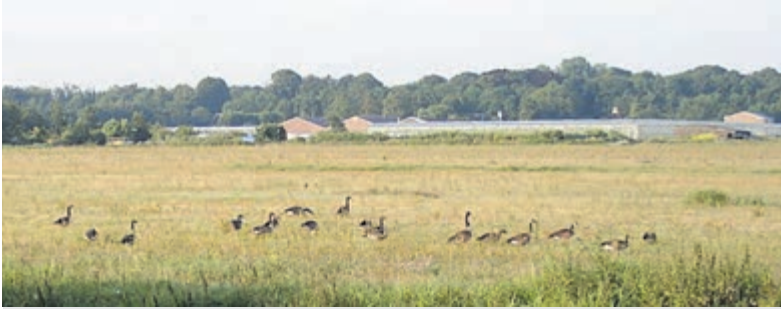
Een (nog) groene oase waar woningen komen maar ook natuur gespaard wordt. De vraag is: is dat beeld realistisch?