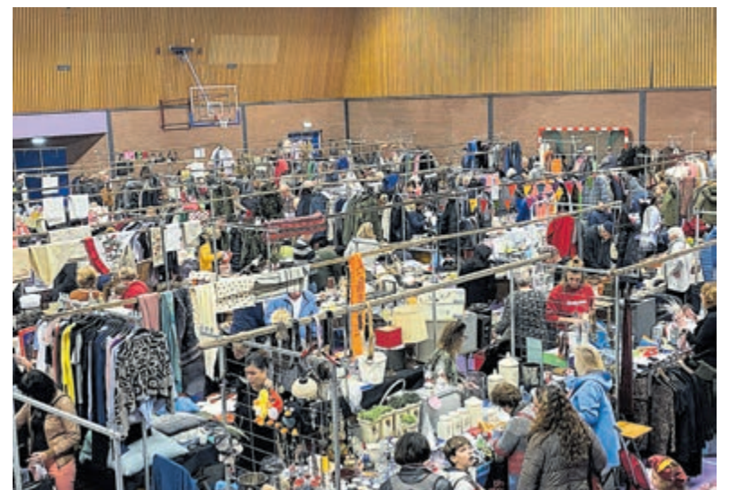
Een walhalla voor liefhebbers van mooie tweedehands artikelen.

Voor meer informatie of reserveringen: Organisatieburo MIKKI, 0229-24 47 39 of 24 46 49. Of www.mikki.nl .