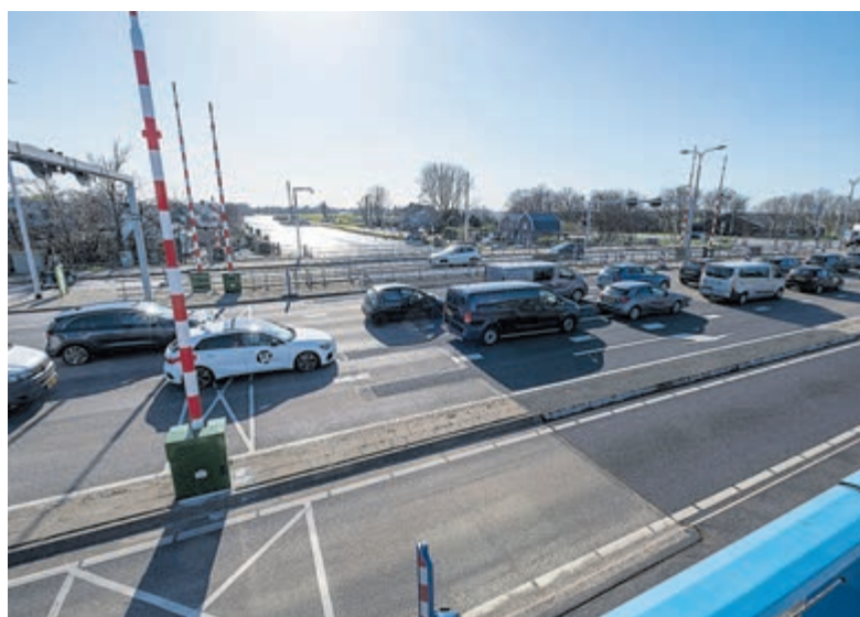
Veel bruggen zijn aan onderhoud of vervanging toe.

Haarlem - De provincie Noord-Holland neemt extra maatregelen om storingen bij bruggen, veerponten en sluizen zo veel mogelijk te voorkomen. Ook worden er maatregelen getroffen om storingen sneller te verhelpen wanneer deze zich voordoen. De maatregelen zijn bepaald na een interne analyse van de beweegbare bruggen, veerponten en sluizen in Noord-Holland. Deze analyse volgde na de grote overlast die weg- en vaarweggebruikers in 2023 ervoeren door meerdere storingen bij de Leimuiderbrug, in combinatie met storingen aan andere bruggen in de provincie. Gedeputeerde Jeroen Olthof: "Hoewel in 2023 het aantal storingen in totaal iets afnam, was de hinder voor de weg- en vaarweggebruikers juist heel groot. Iedere brug is een belangrijke schakel in het hele netwerk van wegen en vaarwegen. Nu het steeds drukker wordt en er al veel hinder is door langdurige stremingen en wegwerkzaamheden, moeten we actie ondernemen en er alles aan proberen te doen om storingen tegen te gaan."