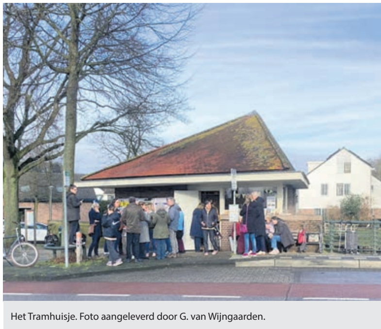
Het Tramhuisje.

Anita. Een band waarbij het plezier in muziek maken vooropstaat met zo nu en dan een optreden. De bandleden komen uit Den Haag en omstreken. Ze spelen vooral covers uit alle mogelijke muziekstijlen van de jaren 70 waaronder ook eigen composities. Iedereen is welkom die zich verwant voelt met de Regenbooggemeenschap. Toegang gratis, voor hapjes wordt gezorgd.