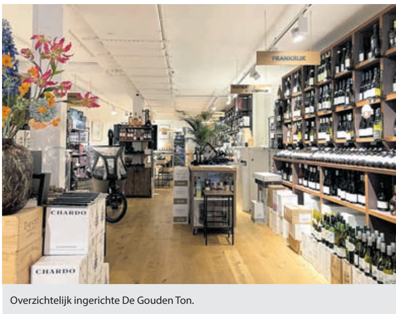
Overzichtelijk ingerichte De Gouden Ton.

Daarnaast is het vooral bijhouden: 1) Wat wil de klant? Die wil minder maar vooral beter en 2) de opwarming van de aarde heeft degelijk invloed op de wijngaarden. Bas zijn laatste vakantie was in Noord-Italië en daar bezocht hij de wijnboer Alois Lageder. Zijn wijngaard ligt bij een vulkaan en daar spelen de weersomstandigheden een grote rol. Indrukwekkend om te zien.