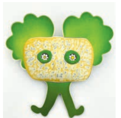
Sylvia Blickman, pay attention: de boom, broche.

De Kunstlijn geeft een speciale krant uit met informatie over het evenement en plattengronden. Tijdens het evenement is de krant verkrijgbaar bij Kunstcentrum Haarlem, VVV en de meeste grote deelnemende expositieruimtes.