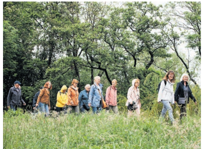
Wandelen voor de gezondheid.

De wandelingen van Stichting Gezond Natuur Wandelen worden mede mogelijk gemaakt door Oranje Fonds, Zorg en Zekerheid, Brentano's Steun des Ouderdoms, Stichting RCOAK, Fonds1818, provincie Noord-Holland, provincie Zuid-Holland en Een tegen Eenzaamheid.