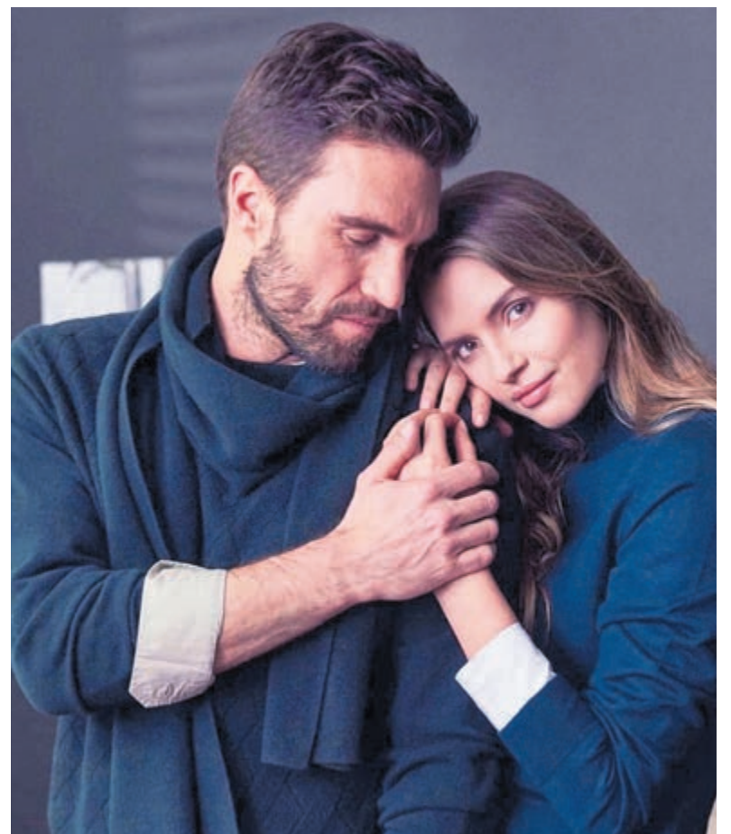
Campell en Ivo.