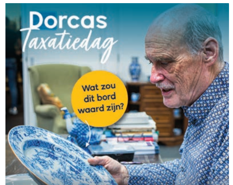
Waardevol of waardeloos?