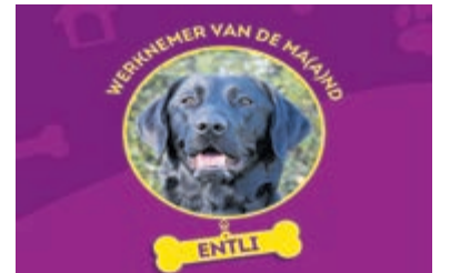
De geleidehond speelt een belangrijke rol.

Belangstellenden zijn welkom vanaf 13.30 uur. De lezing begint om 14.00 uur en wordt gehouden in BAVO gebouw naast de BAVO kerk aan de Herenweg 88, Heemstede. Leden kunnen de lezing gratis bijwonen, niet-leden betalen €5,-.