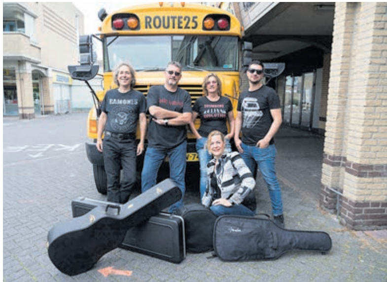
So What.