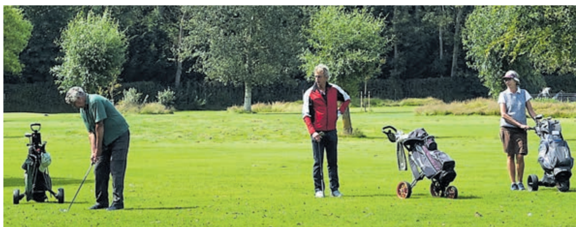
Golfen en ontmoeting bij Mariënweide Aerdenhout.