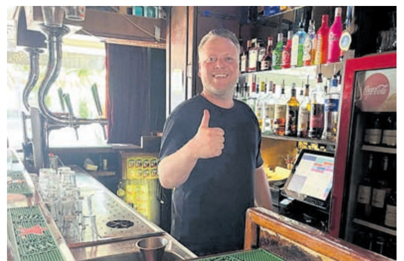
De nieuwe eigenaar van 't Bremmetje.

't Bremmetje is aan de Raadhuisstraat 12 en dagelijks open vanaf 16.00 uur.