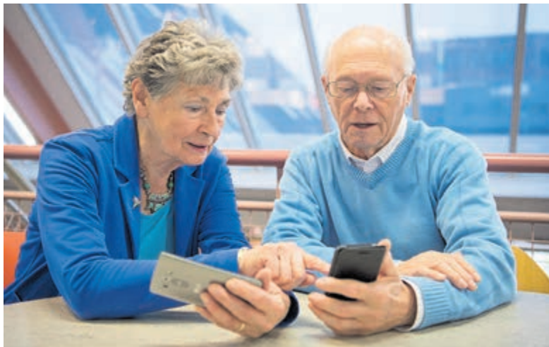
WhatsApp is niet meer weg te denken uit ons leven.

Bijna de helft van de ondervraagden (46%) kan niet meer zonder WhatsApp. En maar liefst 90% neemt deel aan appgroepen met familie, vrienden, hobbyclubs en (mede-)vrijwil-