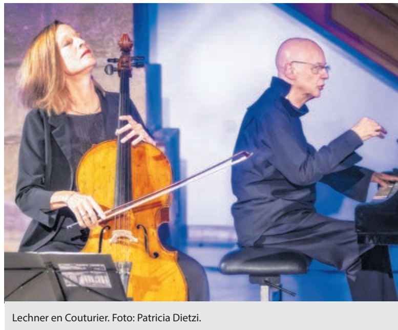
Lechner en Couturier.

Het concert wordt georganiseerd door Muzenforum. Deze stichting organiseert ieder jaar van september t/m april acht zondagochtendconcerten. Diversiteit in het aanbod staat voorop: van solisten tot ensembles en zowel instrumentaal als vocaal. Op de website www.muzenforum.nl vindt u meer informatie over het concert.