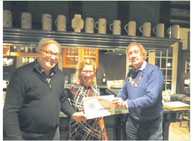
Mooie gift voor Voedselbank Haarlem.