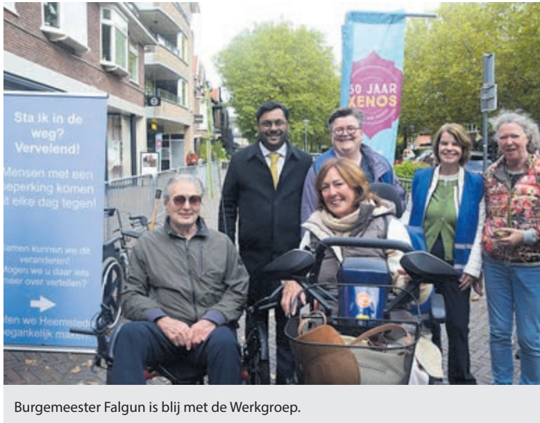
Burgemeester Falgun is blij met de Werkgroep.

Ze maakt zich al jaren sterk voor de toegankelijkheid van Heemstede op