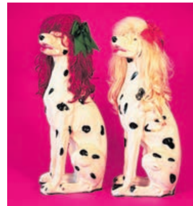
Vuile Huichelaar.

Oude Kerk Heemstede, Wilhelminaplein. Aanvang 20.15 uur.