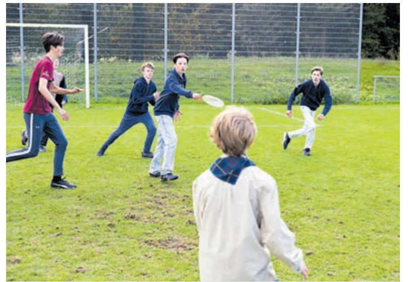
Frisbeetoernooi bracht actie en teambuilding.

Al meer dan 100 jaar is Scouting actief in de regio Haarlem. De regio loopt van IJmuiden tot Heemstede en van Zandvoort tot Zwanenburg. In totaal zijn er 25 groepen bezig met een uitdagend en gevarieerd programma, waarin avontuur, persoonlijke ontwikkeling en vriendschap centraal staan. Zowel op het land, in de vorm van kamperen, pionieren en vuurmaken, als op het water, in de vorm van zeilen.