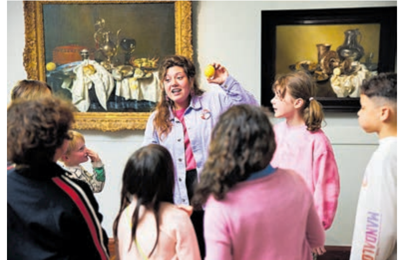
Op ontdekkingstour in het Frans Hals Museum.

De activiteiten sluiten aan bij de tentoonstelling Maarten van Heemskerck, die van 28 september 2024 tot en met 19 januari 2025 te zien is in het Frans Hals Museum, Stedelijk Museum Alkmaar en Teylers Museum. In deze eerste overzichtstentoonstelling ooit over deze 16de-eeuwse meester maken bezoeken