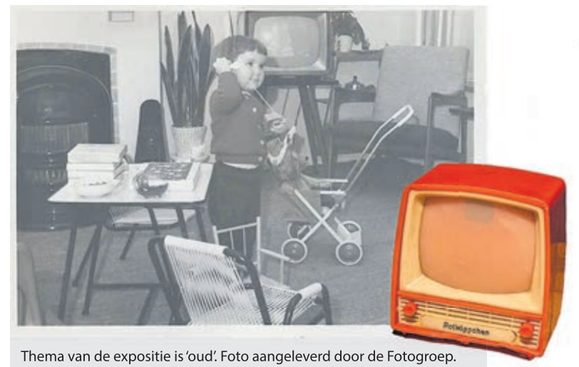
Thema van de expositie is 'oud'.

De Fotogroep bestaat uit een kleine groep enthousiaste amateurfotografen uit Bennebroek en omgeving, die in clubverband hun hobby fotografie op een hoger niveau