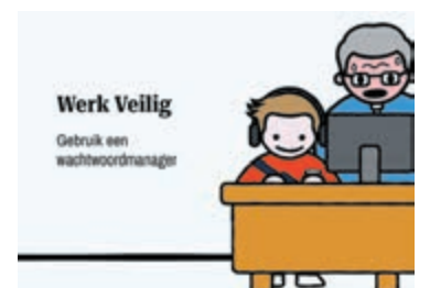
Illustratie: Platform Veilig Ondernemen Noord-Holland.

"Wachtwoordincidenten staan op nummer één als oorzaak van cyberveiligheidsproblemen, terwijl ze relatief eenvoudig te voorkomen zijn," stelt Hoorn. "Met een wachtwoordmanager kunnen ondernemers al hun gebruikersnamen en wachtwoorden veilig opslaan én beheren. Door wachtwoorden regelmatig en veilig te wijzigen, kan veel schade en leed worden voorkomen." Ze benadrukt dat een wachtwoordmanager onmisbaar is in de strijd tegen cybercriminaliteit: "Het helpt medewerkers sterke, unieke wachtwoorden te gebruiken. In combinatie met tweestapsverificatie versterkt je de beveiliging van bedrijfskritieke systemen nog beter."