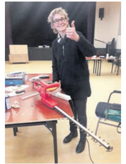
Een bezoeker van het onlangs gehouden Repair Café.