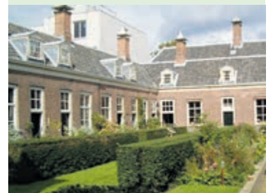
Hofjes bekijken.

Aanmelden is noodzakelijk via www.gildehaarlem.nl , gildewandelingen@gmail.com of 06-16410803.