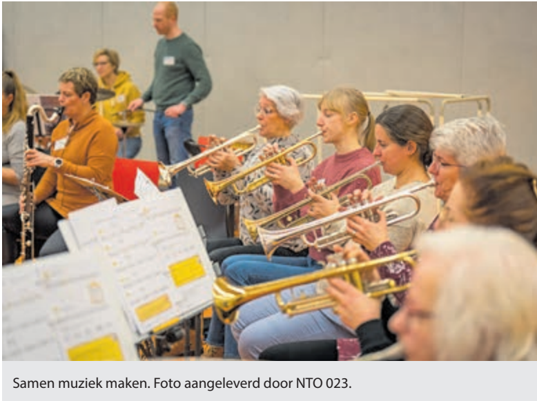
Samen muziek maken.