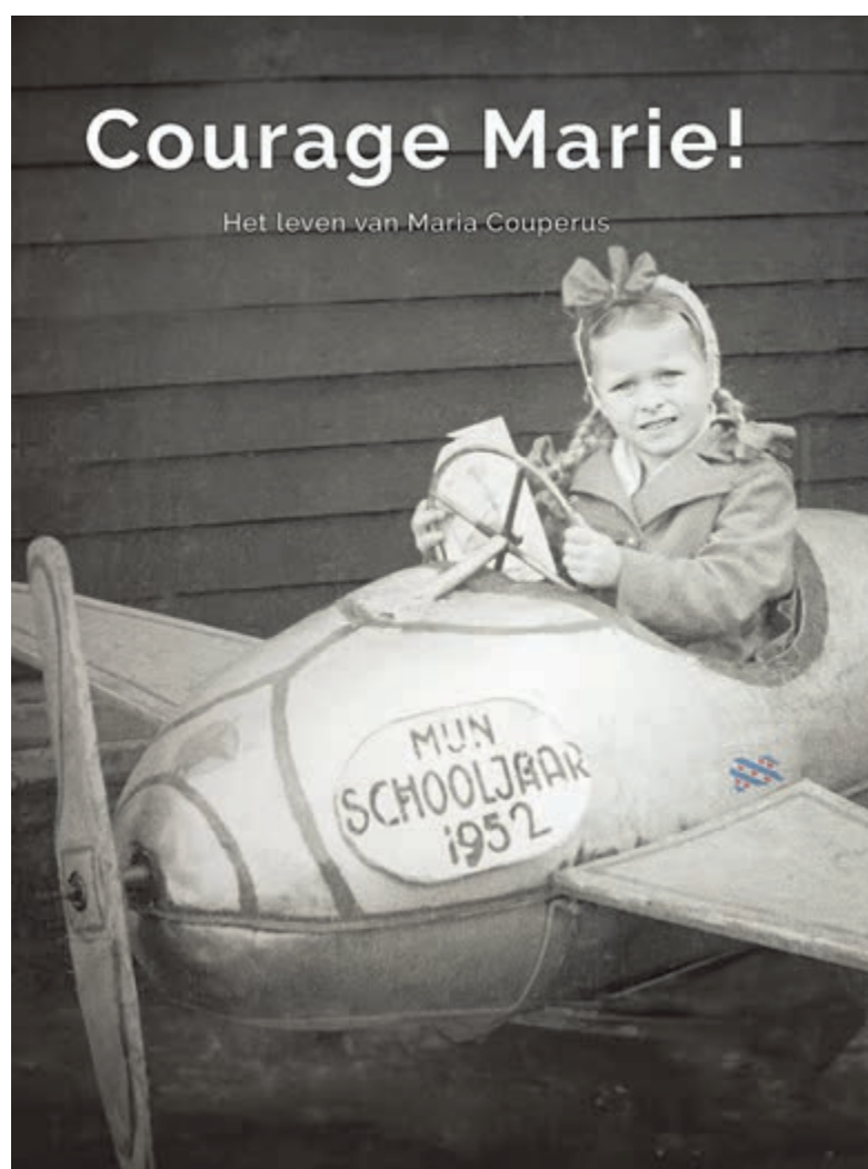
Boekomslog Courage Marie!

Rietveld hoopt dat muzikliefhebbers met veel enthousiasme naar de Adventskerk aan de Leeuwerikenlaan 7 in Aerdenhout komen. Het evenement is gratis, al zijn vrije donaties voor de reiskosten van de artiesten - in een open schaal collecte aan het einde - meer dan welkom.