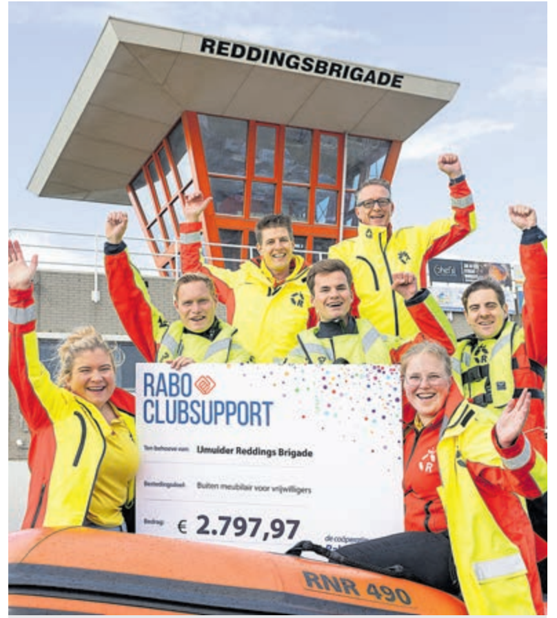
Rabo ClubSupport: Reddingbrigade blijgemaakt.

Tot slot vervult Rabobank een belangrijke netwerkfunctie voor verenigingen en clubs. Op lokaal niveau, maar ook als landelijke partner van NOC-NSF.