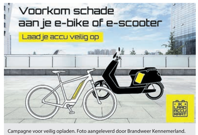
Campagne voor veilig opladen.