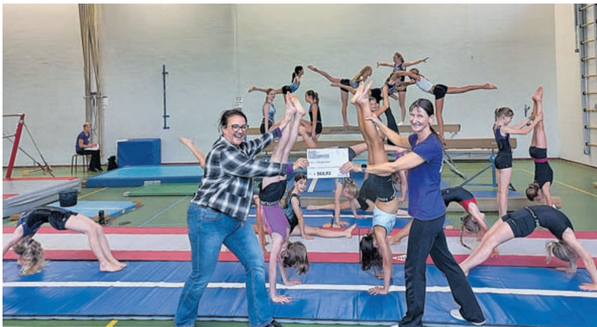
Een mooi bedrag van de Rabobank.

Een heel mooi bedrag dat ingezet kan worden voor het opleiden van trainers en assistenten. Om de nog steeds groeiende vereniging te kunnen voorzien van genoeg leiding en assistenten, moeten zij investeren in opleidingen en dit kost veel geld. Mede door deze extra inkomsten is het mogelijk ook in de toekomst genoeg trainers te hebben die alle turnsters en gymmende jeugd en volwassenen goed lesgeeft.