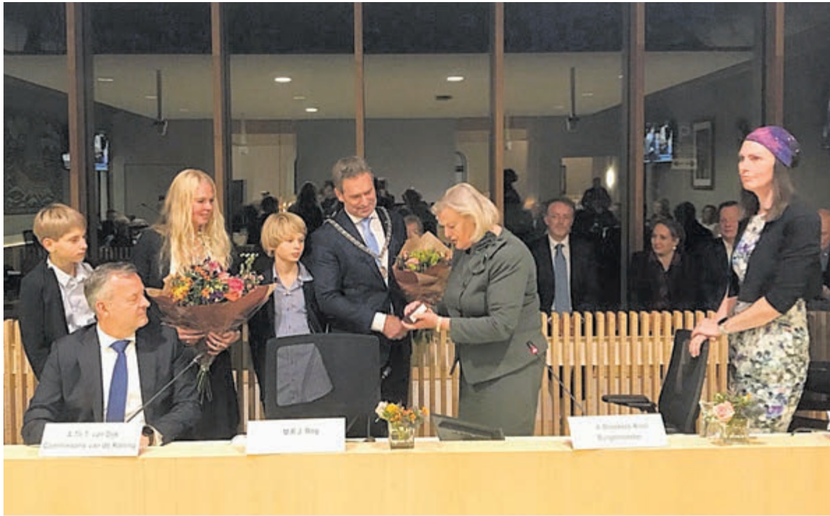
De nieuwe burgemeester en zijn gezin worden verwelkomd.

Op de vacature waren in totaal 21 reacties ontvangen. Toch een bevestigend aantal voor deze bestuursfunctie waarin een aantal voorgangers geen gemakkelijke tijd heeft gehad. Natuurlijk, het is een prachtige gemeente met veel groen. Maar ook met zeer 'betrokken' inwoners. Vooral de omgang met de gemeenteraad viel nog wel eens zwaar. Het vervullen van een bestuurlijke functie is toch al veel lastiger dan voorheen, tengevolge van de toegenomen mondigheid en de vele kanalen die daarvoor gebruikt kunnen worden.