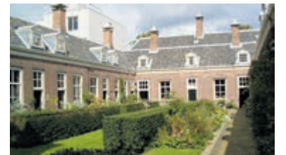
Hofje Haarlem.

Haarlem - Vrijdag 11 oktober om 13.30 uur (vertrek Vleeshal op de Grote Markt) kunt u Haarlemse hofjes bezoeken. Haarlem telt meer dan 20 hofjes, waaronder het oudste hofje van Nederland. U kunt mee met een van de Gilde gidsen. Deelname €5,- per persoon (graag contant). Aanmelden voor deze wandelingen is noodzakelijk en kan via het aanmeldingsformulier op de website www.gildehaarlem.nl , via een mail naar gildewandelingen@gmail.com of telefonisch via 06-16410803.