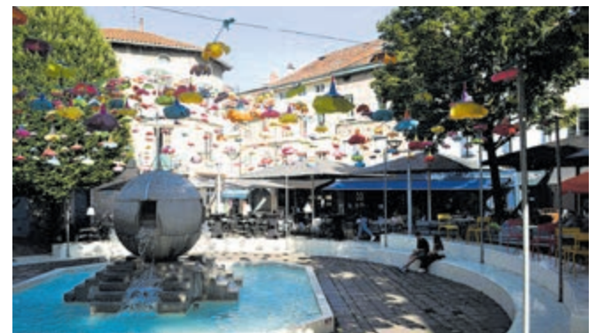
Fontein in hart van de stad op Place Edgar Quinet.