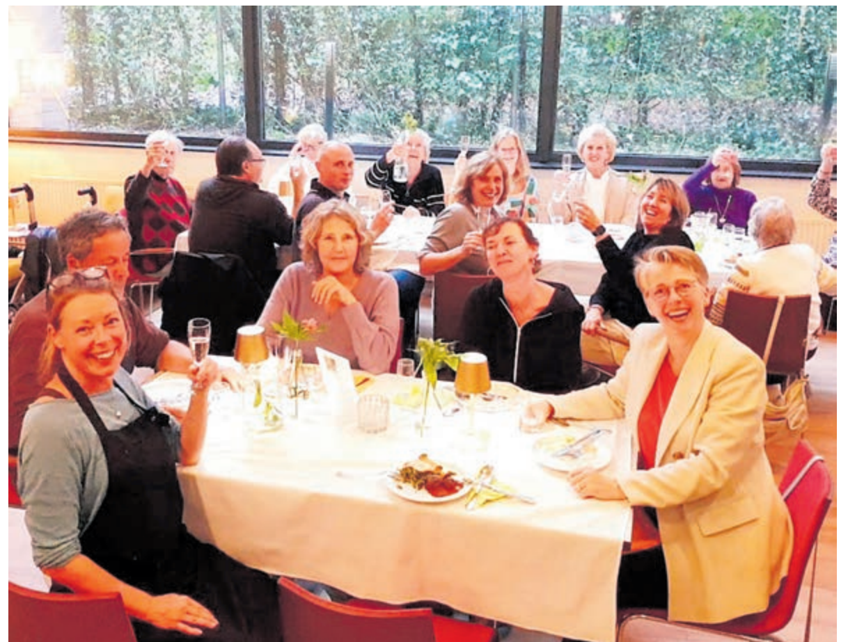
Eetclub voor buurtbewoners met rechts vooraan wethouder De Wit.

Voor het eerste gezamenlijke etentje op 1 oktober was veel belangstelling. Naast een twintigtal buurtbewoners schoven ook enkele genodigden aan. Wethouder Arianne de Wit was een van hen en ze prikte gezellig een