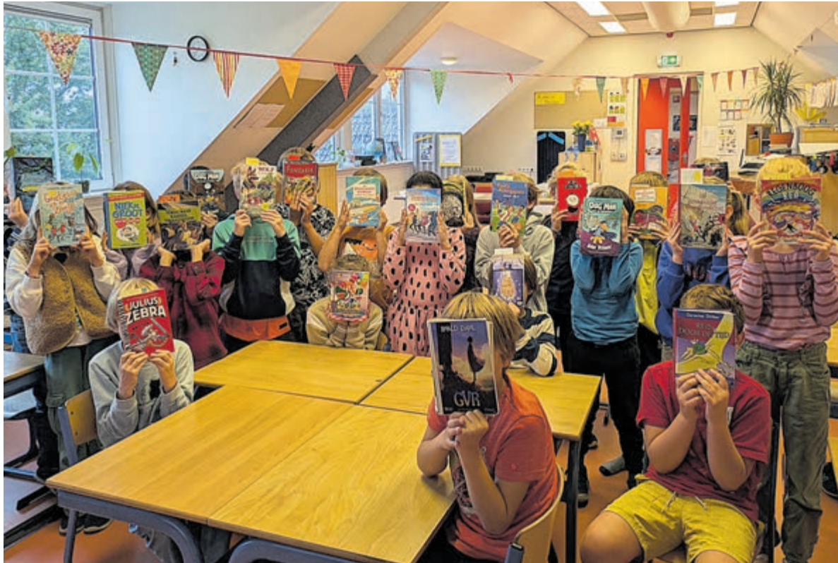
Leerlingen Bornwaterschool Bloemendaal.

Onderdeel van Regio Media Groep B.V. www.regiomediagroep.nl