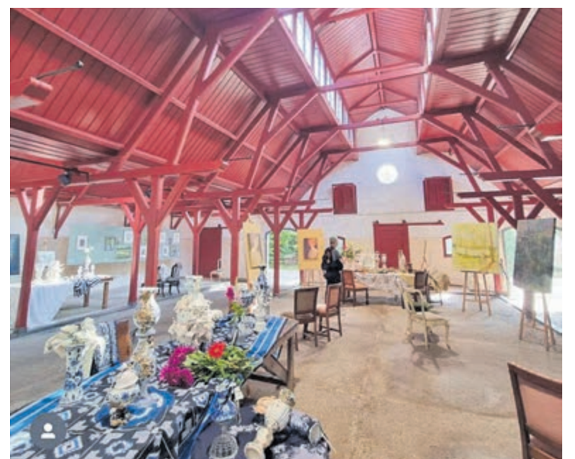
Sfeerbeeld van 2023.

Het eerste weekend van de expositie valt tijdens de Open Monumentendagen op 14 en 15 en daarna op 20 en 21 september. De modelboerderij van Elswout is normaal gesloten voor het publiek, dus dit is een unieke kans om de boerderij een keer van binnen te zien én bijzondere kunstenaars uit de regio te ontdekken. Er worden ook rondleidingen op het landgoed georganiseerd door de boswachter van Staatsbosbeheer. Er is koffie verkrijgbaar bij de Coffee-Jeep en er worden korte schilderworkshops georganiseerd. De expositie is gratis toegankelijk.