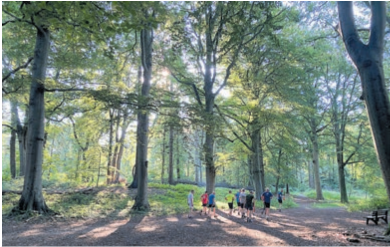
Trimmen in het wandelbos.