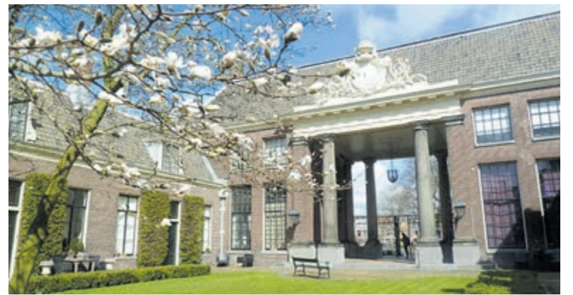
Hofje Haarlem.

Naaiatelier Haarlem, Spaarnwouderstraat 124, Haarlem. Openingstijden: 5 - 15 september (donderdag tot en met zondag), 12.00 - 17.00 uur. Voor meer informatie over de expositie 'Echoes of Being' en de kunstenaars ga naar www.naaiatelierhaarlem.nl . De nieuwe expositieruimte Naaiatelier Haarlem is een informele plek voor kunst. Beeldende kunstenaars kunnen hun werk voor een korte periode exposeren in het mooiste straatje van Haarlem, de Spaarnwouderstraat 124. De naam ontleent zich aan de furnituurenwinkel die er voorheen in het pand gevestigd is.