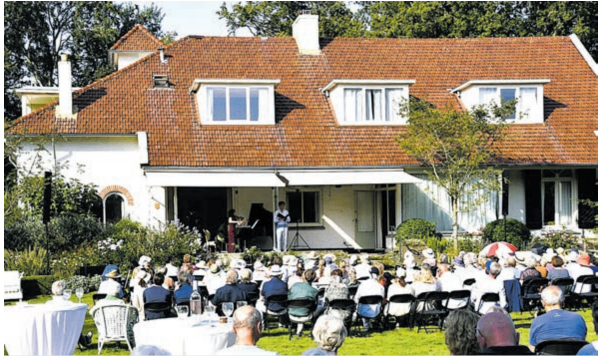
Een heerlijk stuk muziek door jonge talenten.