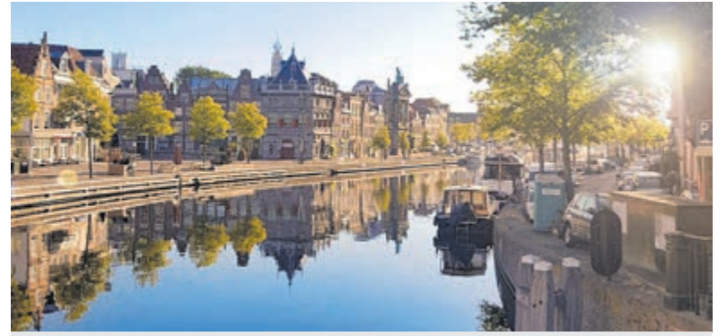
Het Spaarne.

Haarlem - Lennart Nijgh schreef 'Het Spaarne stroomt'. Aan deze levensader dankt Haarlem mede zijn ontstaan. Op vrijdag 6 september start een prachtige wandeling in de binnenstad met zijn historische gebouwen en hofjes. Vervolgens voert de gids van Gilde Haarlem u langs de gebouwen aan het Spaarne. Kortom: twee gezichten van de stad in één wandeling. De wandeling (1,5 uur) start om 13.30 uur bij Verwey Museum Haarlem (Groot Heiligland 47). De kosten bedragen €5 p.p.