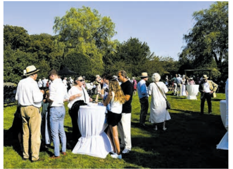
Goed toeven in een sfeervolle ambiance.

Voor steun aan het Prinses Christina Concours en voor meer informatie over promotie van klassieke muziek voor kinderen, kunt u mailen naar: info@christinaconcours.nl .