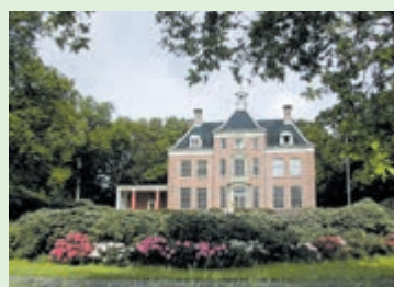
Huize Leyduin.

Rondleidingen in Huize Leyduin, op afspraak, via www.gaatumee.nl . Om 10 en 12 uur.