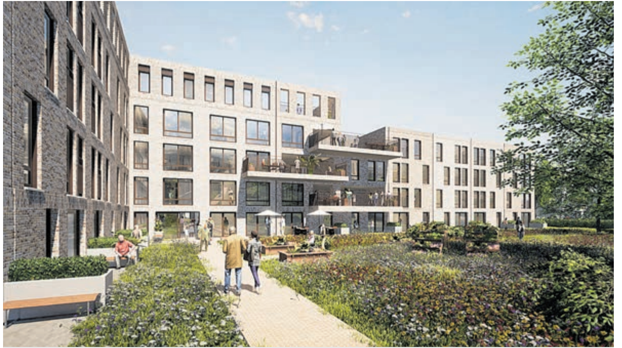
Impressie Hof van Jacob.

GGD Kennemerland ondersteunt de acties van 113 zelfmoordpreventie sinds het begin in 2016. De GGD werkt samen met partners als GGZinGeest, Kenter Jeugdzorg, huisartsen en gemeenten aan het aantal suïcides in de regio terug te dringen. Dat gebeurt door in te zetten op publiekscampagnes, het trainen van sleutelfiguren, aandacht voor risicogroepen en een netwerkbrede samenwerking waarmee de GGD Kennemerland meewerkt aan de landelijke ambitie het aantal suïcides terug te dringen. Het doel is dat elk mens bij iemand terecht kan met zijn of haar verhaal, een luisterend oor vindt en de juiste steun kan krijgen.