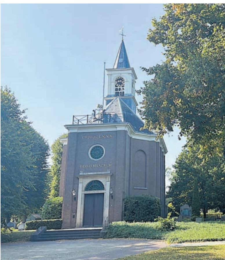
Hervormde kerk Bennebroek.