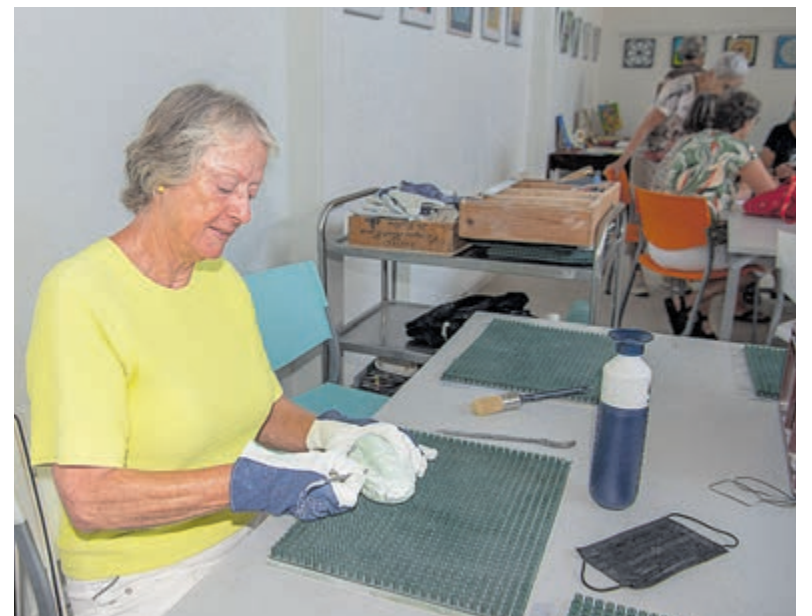
Een cursist geeft een demonstratie bewerken van speksteen.