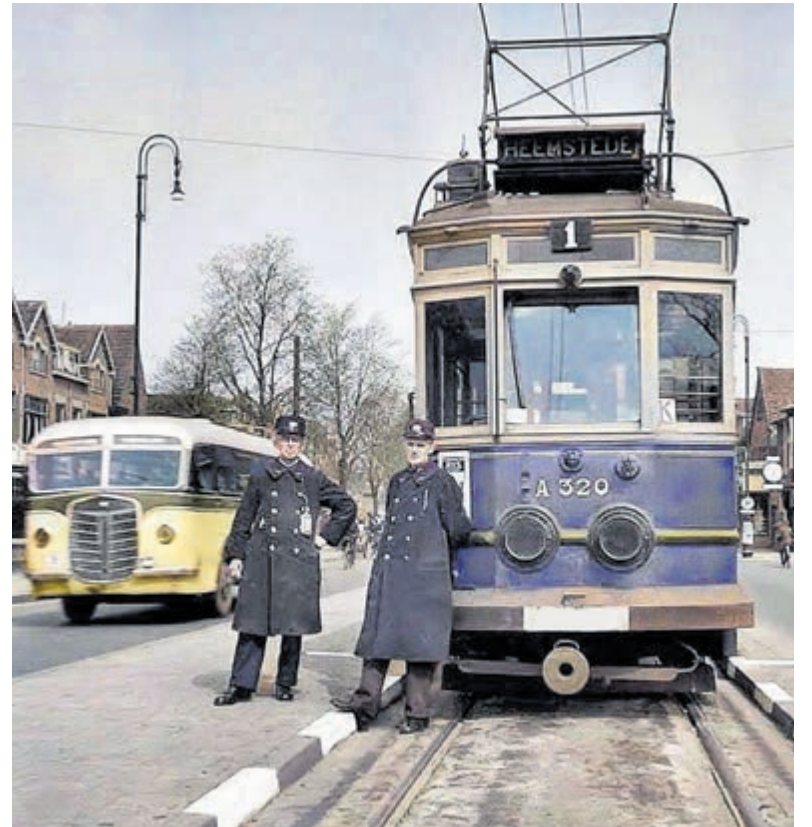
Voor de Blauwe Tram.