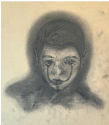
Een deel van het kunstwerk van Mattia Rubino.

Haarlem - Jonge, talentvolle kunstenaars én een oude rot in het vak presenteren hun werk in Naaiatelier