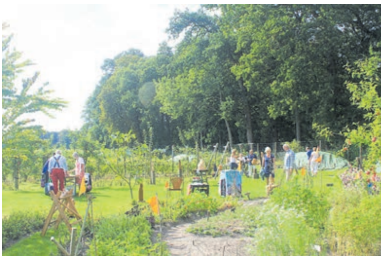
Moestuyn Leyduin.

Voor de namen van alle insectachtige waterdierjes zijn met deze kaarten superleuk te ontdekken, dit vormde zodoende een mooi, bevredigend slot van de safari. Plus natuurlijk de aanwezige limonade en ijsje, die na deze drassige tocht gretig werden genuttigd door de jonge avonturiers.