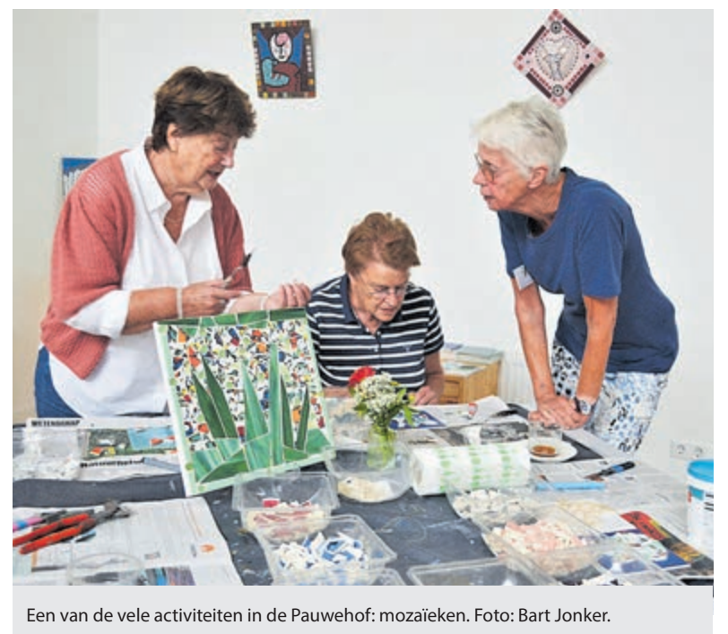
Een van de vele activiteiten in de Pauwehof: mozaïeken.

Heemstede - Ontmoetings- en activiteitencentrum voor ouderen de Pauwehof op de Achterweg 19 in Heemstede (achter de Oude Kerk), houdt Open Huis op woensdag 28 augustus, van 10 tot 12 uur. De activiteiten in de Pauwehof zijn een samenwerking tussen de diaconie van de Protestantse Gemeente Heemstede en WIJ Heemstede. Voor u is het de plek om leeftijdgenoten te ontmoeten en samen creatief, educatief en/of actief bezig te zijn in een gezellige en gemoedelijke sfeer. Op woensdag 28 augustus kunt u op het Open Huis gezellig binnenlopen, informatie krijgen over de activiteiten en cursussen en staat de koffie voor u klaar tussen 10.00 en 12.00 uur. U bent van harte welkom! Kijk ook op de website www.wijheemstede.nl/pauwehof voor meer informatie.