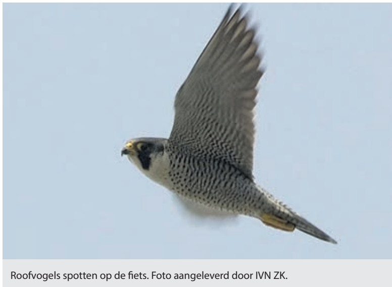
Roofvogels spotten op de fiets.

Spaarnwoude - Een roofvogelexcursie al fietsend door het Recreatieschap Spaarnwoude op zoek naar roofvogels op zondag 1 september. Door de variatie in het landschap en de vergezichten is dit namelijk een uitstekend gebied voor diverse soorten roofvogels. Van 11 tot 15 uur. In het uitgestrekte polderlandschap van Spaarnwoude zijn in september meerdere stand- en broedvogelsoorten met jonge aanwas aanwezig. Bovendien bevinden zich er vaak roofvogelsoorten die op doortrek zijn vanuit noordelijke regionen. Grote kans dus om deze indrukwekkende vogels te kunnen bespeuren. Met name de buizerd, de sperwer en de torenvalk laten zich gemakkelijk