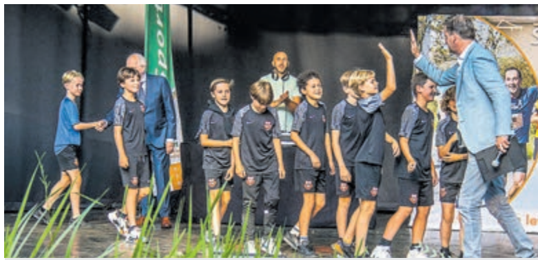
Bloemendaalse sportkampioenen.

Dit is een laatste oproep voor aanmeldingen. Aanmeldingen worden uiterlijk tot 29 augustus 2024 in behandeling genomen.