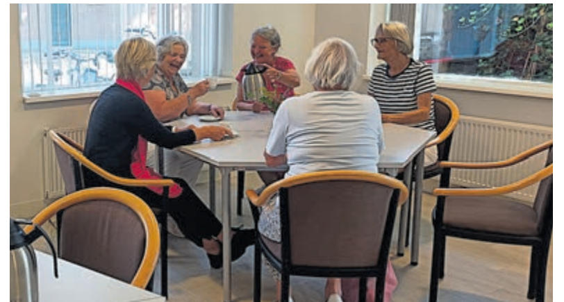
Gezellige buurtinloopochtenden in de Pauwehof.

Om u een idee te geven: in de Glip hebben buurtkoffie-inlopen geleid tot het ontstaan van een enthousiast groepje dat nu in het Tramwachtershuisje regelmatig activiteiten organiseert voor de buurt.