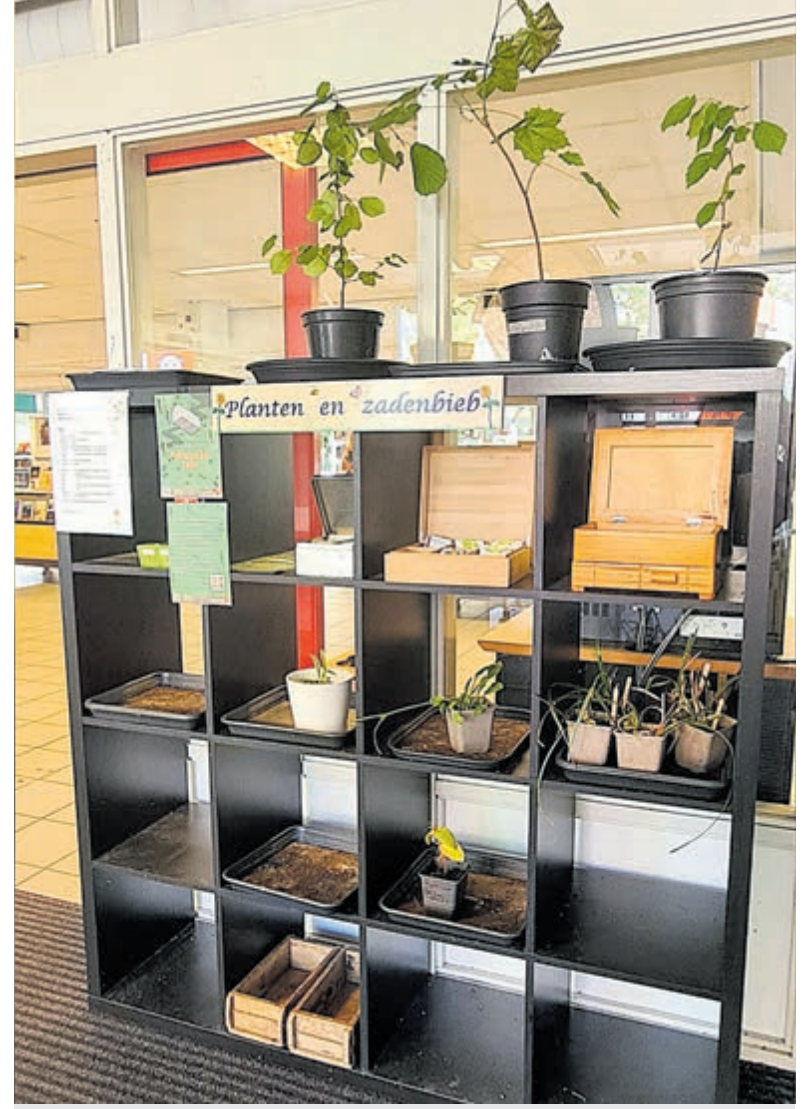
Zaden- en plantenbieb.

Geïnteresseerd? Lees meer op bibliotheekzuidkennemerland.nl/meemaaktuin .