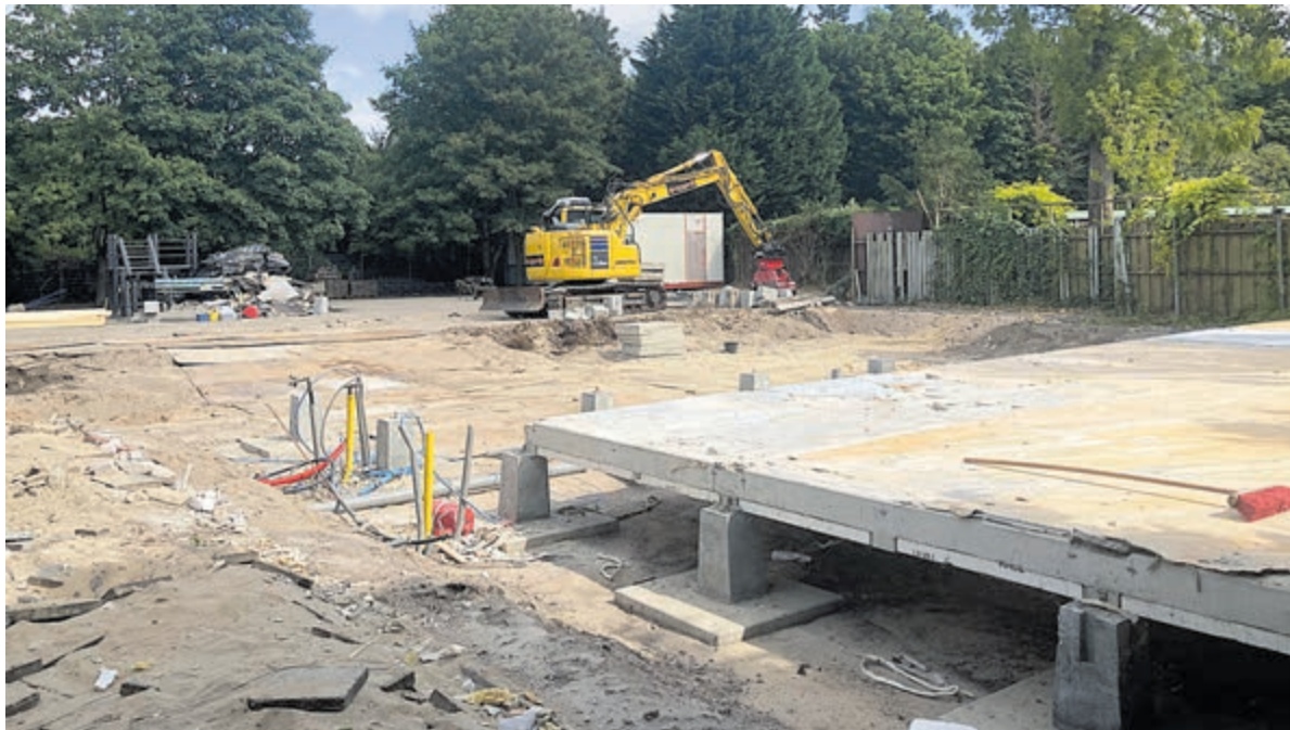
Extra ruimte op het oude schoolplein.

Sloop en nieuwbouw hebben zeker een schooljaartje nodig, maar dan komt er ook wel iets moois te staan.