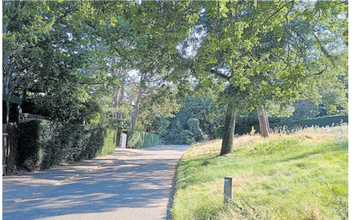
Blik op Midden Duin en Daalseweg.

De familie Eichholtz en Hospice Haarlem e.o. hebben in onderling