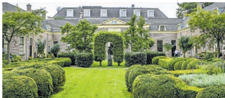
Het Hofje van Oorschot in Haarlem.

dag 17 augustus). De gidsen nemen u mee in de geschiedenis van deze onderwerpen en weten u hiermee te boeien. De wandelingen op vrijdag en zaterdag beginnen om 13.30 uur bij de Vleeshal op de Grote Markt.