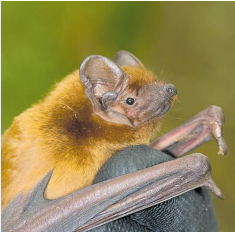
Rosse vleermuis.

Nadere informatie en aanmelden voor de excursie op: www.gaatumee.nl .