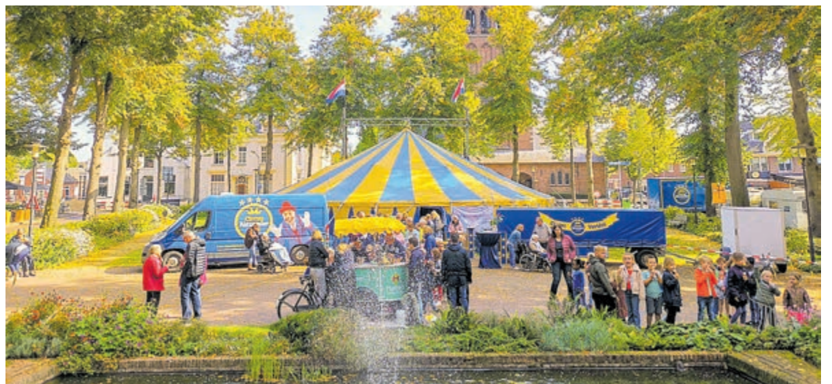
Circus in de zorg. Foto aangeleverd.

Voor meer informatie kunt u contact opnemen met Frank Gort, f.gort@alzheimerwilligers.nl of 06-37327817.