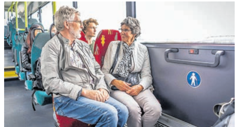
Wegwijs over het OV bij het Reisloket. Foto aangeleverd.

(Korte Kleverlaan 9, 2061 ED Bloemendaal). Voor het persoonlijk reisadvies wordt samen met u uitgezocht welke reizen u met het OV kunt maken. Ook kunt u geholpen worden met het installeren van een reisplanner op uw smartphone. Verder kunt u geïnformeerd worden over hoe voordelig de bus anno nu is: er zijn meerdere aantrekkelijke voordelen voor senioren. En wilt u in het OV reizen met uw bankpas met 34% leeftijdskorting? Neem dan uw smartphone en bankpas mee. Het reisloket helpt u daar graag bij!