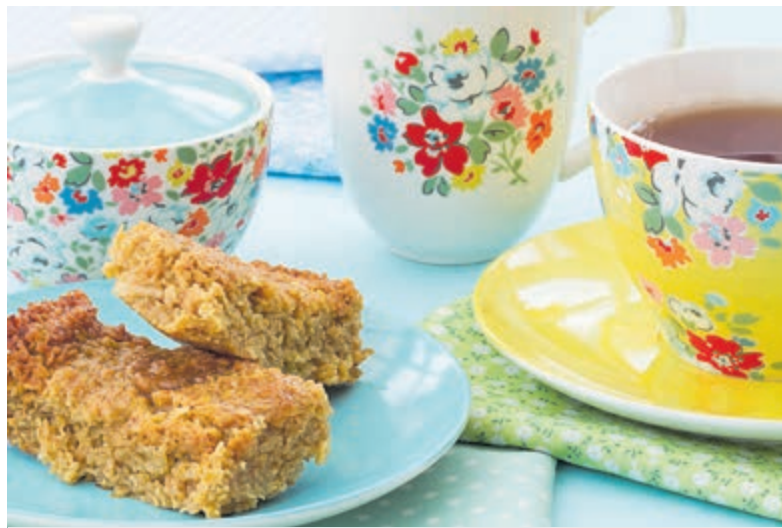
High Tea op de Gillestuin.