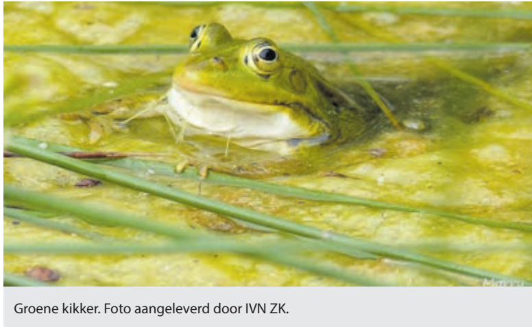
Groene kikker.

Overveen - Op zondag 1 september ga je van 12 uur tot 13.30 uur op ontdekking in en om de slootjes bij Middenduin. Tijdens deze tocht gaan kinderen (van 4 t/m 10 jaar) op zoek naar diersporen, waterbeestjes en bodemdierpjes. Met loeppotjes kun je de waterbeestjes en bodemdierpjes heel precies bekijken. Verzamelen bij Middenduin, ingang Duinlustweg Overveen, einde van de parkeerplaats. De kinderen mogen zelf de beestjes vangen en bekijken, indien nodig, is er natuurlijk hulp. Om de dieren te vangen gebruiken we schepnetten en om ze uit te zoeken en te bekijken hebben we witte plastic bakken,