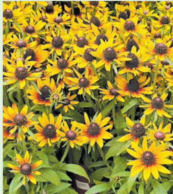
Rudbeckia fulgida 'Goldsturm'.

Zonnehoed- oftewel Rudbeckiasoorten zijn te vinden in het veelzijdige assortiment van Tuincentrum De Oosteinde, met filialen op de Zandlaan 22 in Hillegom en op de Schipholweg 1088 in Vijfhuizen.