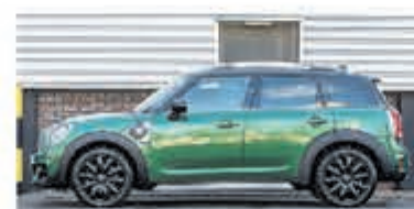
Mini Countryman 1.5 Co.S E ALL4 Chil € 37.900,-