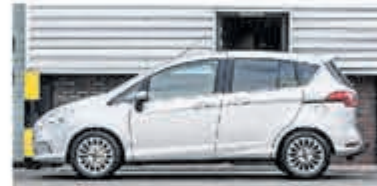
Ford B-Max 1.0 EcoB. Titanium € 9.950,-