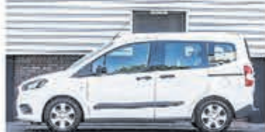
Ford Tourneo Courier 1.0 Titanium € 14.950,-