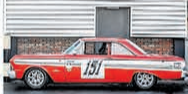
Ford Usa Falcon FUTURA SPRINT € 79.000,-