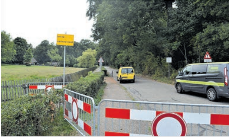
Burgemeester Van Rappardlaan afgesloten.

Heemstede – Maandagochtend 15 augustus heeft de gemeente Heemstede besloten om de Burgemeester Van Rappardlaan in Wandelbos Groenendaal tot nader order af te sluiten voor alle verkeer en het publiek wegens het gevaar van spontaan vallend hout. De weg en een deel van het bos zijn voor minimaal een week afgesloten vanaf de kruising met de Vrijheidsdreef tot vlakbij de kruising Sparrenlaan en Bosbeeklaan. De afsluiting staat met borden aangegeven. Een omleidingsroute volgde dinsdag.