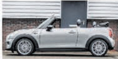
Mini Cooper Cabrio 1.5 C. Chili S. Bns € 25.950,-