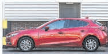
Mazda 3 2.0 S.A. 120 TS € 22.900,-