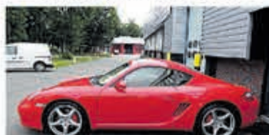
Porsche Cayman S Tiptronic Uniek 76.000 km € 29.950,-