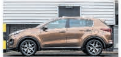
Kia Sportage 1.6 T-GDI 4WD GT-L. € 25.750,-