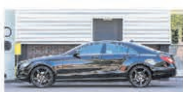
Mercedes-benz CLS-klasse 350 € 22.750,-