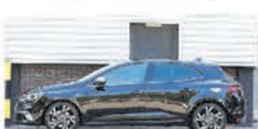
Renault Megane 1.6 TCe GT € 21.950,-