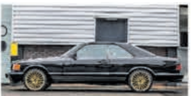
Mercedes-benz S-klasse 380 SEC € 9.750,-