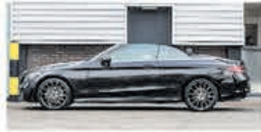
Mercedes-benz C-klasse 220 d Cabrio Premium Pack € 47.900,-