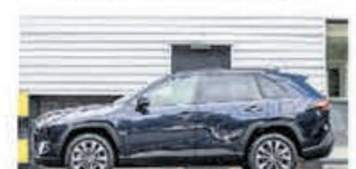
Toyota RAV4 2.5 Hybrid Dynamic € 41.900,-

Turenhout de occasiondealer van Heemstede en al meer dan 40 jaar uw vertrouwde onderhoudsadres.