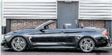
BMW 4 Serie 430i Cabrio € 49.950,-