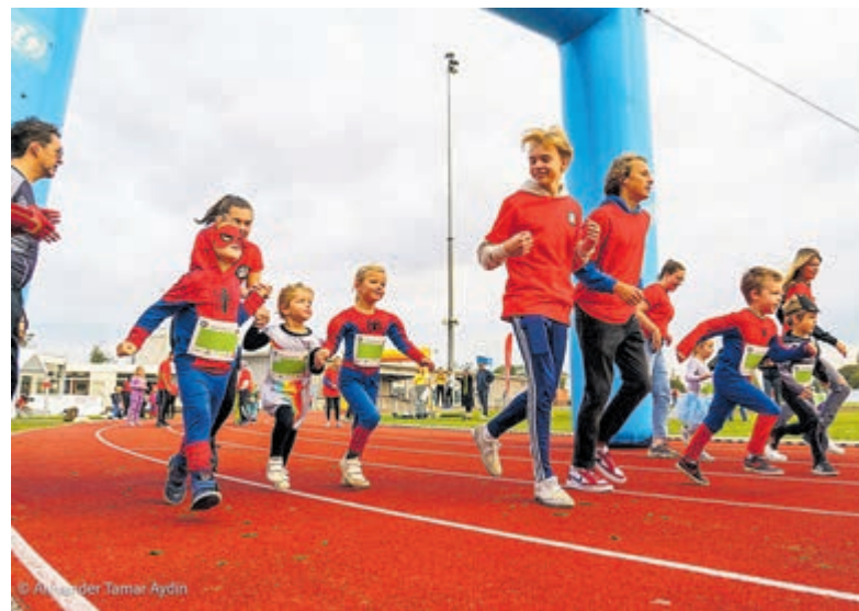
SuperHero Kidsrun.

Het evenement wordt georganiseerd door een kernteam van vrijwilligers vanuit CityShapers, in samenwerking met vele mooie organisaties uit Haarlem. Ze zijn nog op zoek naar vrijwilligers die op de dag zelf een handje willen helpen. Aanmelden daarvoor kan ook op de eerdergenoemde website. Meer informatie over de organisatie is te vinden op www.cityshapers.nl .