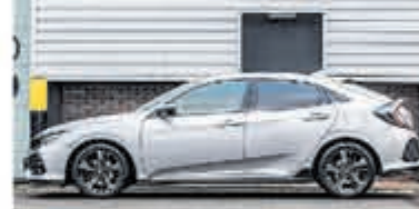
Honda Civic 1.5 i-VTEC Sport + € 24.950,-