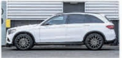
Mercedes-benz GLC-klasse 250 d 4MATIC Luchtvering € 44.900,-