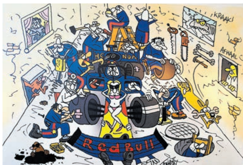
De afbeelding van Toon van Driel.

Zandvoort Beyond is het Side Events programma waarmee de 'Formula 1 Heineken Dutch Grand Prix' niet alleen gevierd wordt op het Circuit, maar ook in Zandvoort én in de regio. Zandvoort Beyond biedt een breed programma voor iedereen. Ook deze expositie is onderdeel van het veelzijdige side events programma. Meer informatie: www.zandvoortsmuseum.nl .