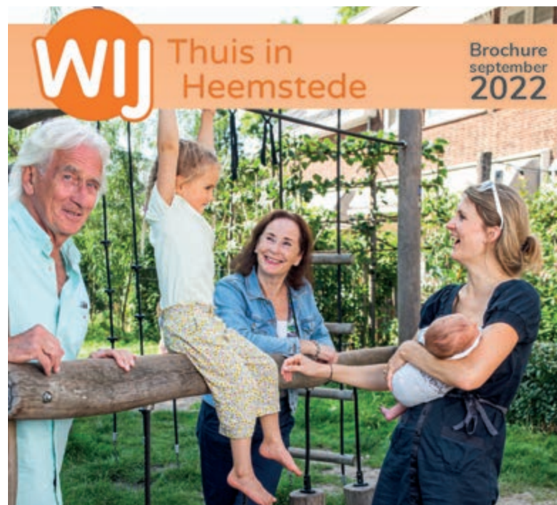
Voorzijde nieuwe brochure WIJ Heemstede.

mooier Heemstede. De activiteiten van WIJ Heemstede zijn erop gericht dat mensen elkaar kennen en er voor elkaar zijn. En dat mensen die ondersteuning nodig hebben dit ook krijgen. Bij WIJ Heemstede werken naast de vaste medewerkers, veel vrijwilligers. Voor mensen die graag iets willen betekenen voor een ander biedt WIJ Heemstede de mogelijkheid om vrijwilligerswerk te doen. Samen organiseert WIJ veel activiteiten en bieden WIJ hulp waar dat nodig is. Meer informatie over alles wat WIJ Heemstede doet leest u in de nieuwe brochure en op: www.wijheemstede.nl .