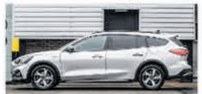
Ford Focus Wagon 1.0 EcoB. Tit. Bns € 27.900,-