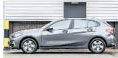
BMW 1-serie 116d Sp.Line Edition € 28.900,-