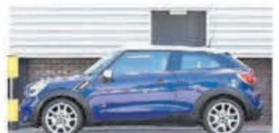
Mini Paceman 1.6 Cpr S ALL4 Chili € 12.950,-