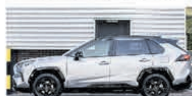
Toyota RAV4 2.5 Hybrid Bi-Tone € 38.750,-