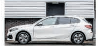
BMW 1-serie 118i € 26.750,-