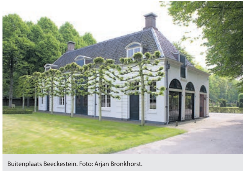
Buitenplaats Beeckestijn.

Vanaf 18 uur kunt u genieten van het 3-gangen Chefs Menu in Brasserie Beeckestijn. De chefs van Brasserie Beeckestijn zijn ware kunstenaars op