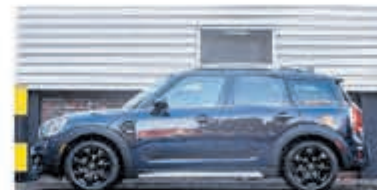
Mini Countryman 1.5 Cooper Salt € 24.950,-