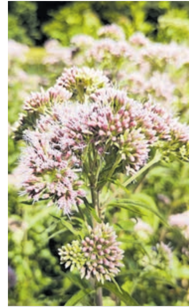
Koninginnen- of leverkruid.

Aanmelden is niet nodig. Informatie: Wim Swinkels, tel.nr.: 06-52788835.