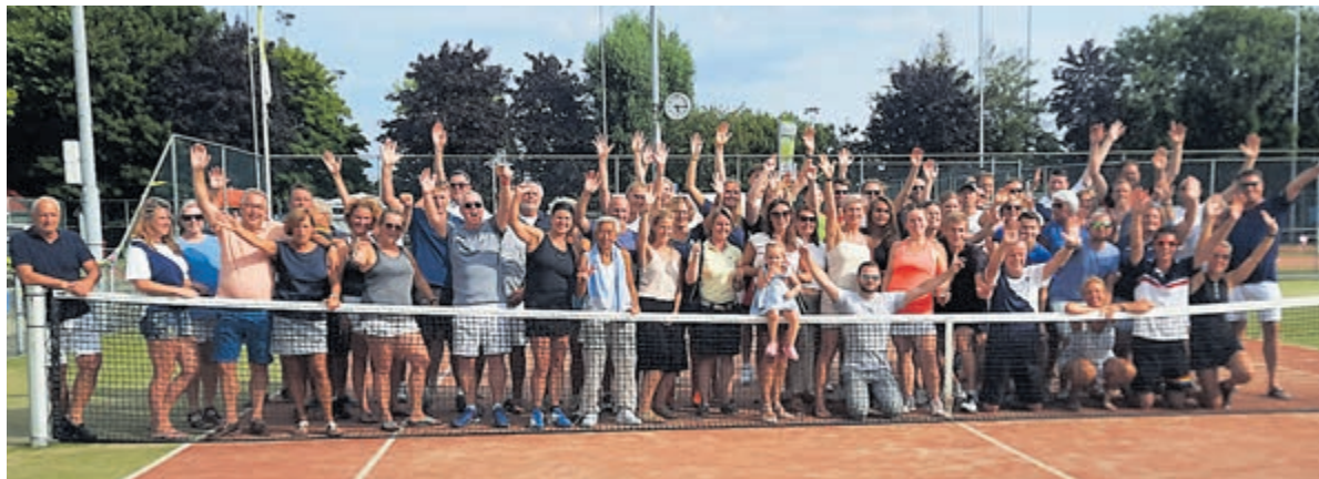
Winnaars TV HBC Open 2022.