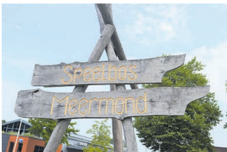
Speelbos Meermond.

Heemstede – Op zaterdag 20 augustus wordt van 14-17 uur een picknick gehouden op Speelbos Meermond, gelegen aan de Cruquiusweg 47 in Heemstede. De picknick is voor kinderen en volwassenen. Neem je eigen eten mee. Drinkjes en lekkers worden daar verstrekt. Wel van tevoren aanmelden als je aan deze picknick wilt deelnemen via e-mail: marlies@marliesvanheese.com . Bij deze picknick draait het om gezamenlijk spelen, eten en plezier. Deze picknick is georganiseerd door Stichting Taalcoaches Zuid-Kennemerland en Stichting Haarlem Mozaïek.