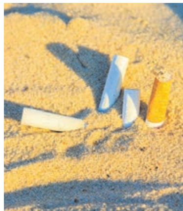
Veel sigarettenpeuken op Nederlandse stranden.

Ook dit jaar zijn er weer bijzondere vondsten gedaan. Zo werd er op Schiermonnikoog een appelsapverpakking gevonden uit 1983, al bijna veertig jaar oud. Ook is er een coronatest en een hoefijzer gevonden. Drieënhalve jaar na de containerramp met MSC Zoe, waarbij 342 containers boven de Waddeneilanden overboord sloegen, werd er ook dit jaar nog afval gevonden dat afkomstig is uit deze containers. Dit toont volgens de stichting aan hoe belangrijk het is