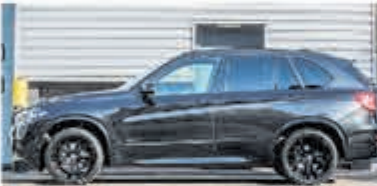
BMW X5 xDrive40e M Sp. Ed. € 59.900,-