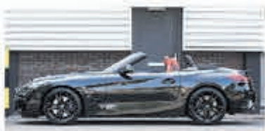
BMW Z4 Roadster sDrive30i Hi. Ex. Ed € 54.950,-