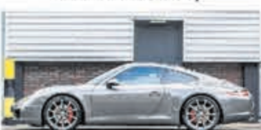
Porsche 911 3.8 Carrera S € 84.900,-