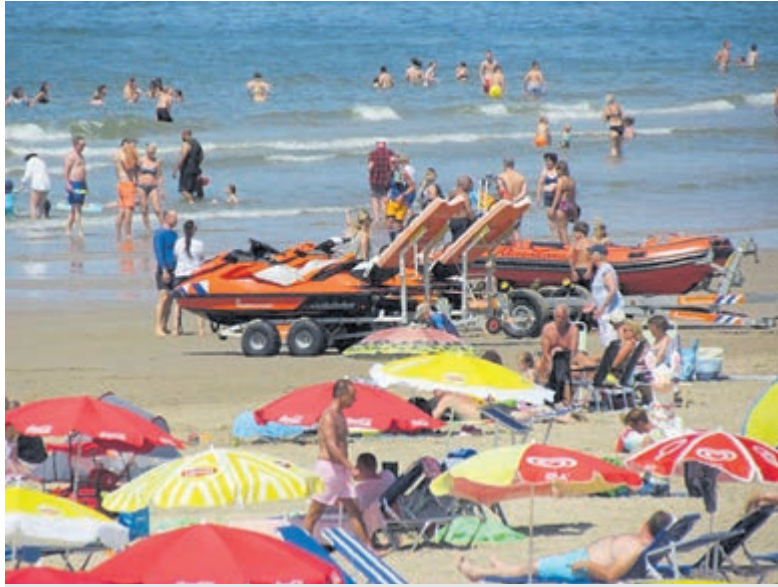
Drukke aan de kust bij Egmond aan Zee.

Meer veiligheid in, op en langs het water. Dat is het doel waarvoor de lifesavers en lifeguards van reddingsbrigades zich dagelijks vrijwillig inzetten. Ze doen het uiterste om te zorgen dat er niemand verdrinkt en iedereen veilig kan genieten van het vele water dat Nederland telt. Maar de verantwoordelijkheid voor