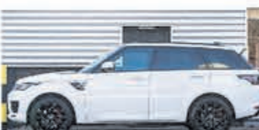
Land Rover Range Rover Sport P400e HSE € 102.950,-