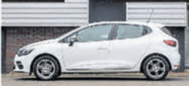
Renault Clio 0.9 TCe GT Line € 9.750,-