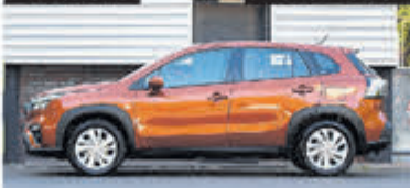
Suzuki S-Cross 1.4 B.jet Comfort SH € 27.750,-