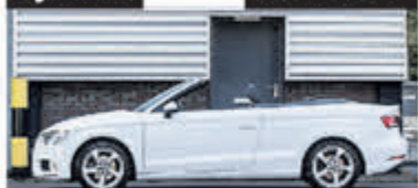
Audi A3 Cabriolet 1.5 TFSI CoD De.PL.+ € 27.950,-