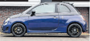
Fiat 500C 1.4 T-Jet Abarth Ela € 15.900,-