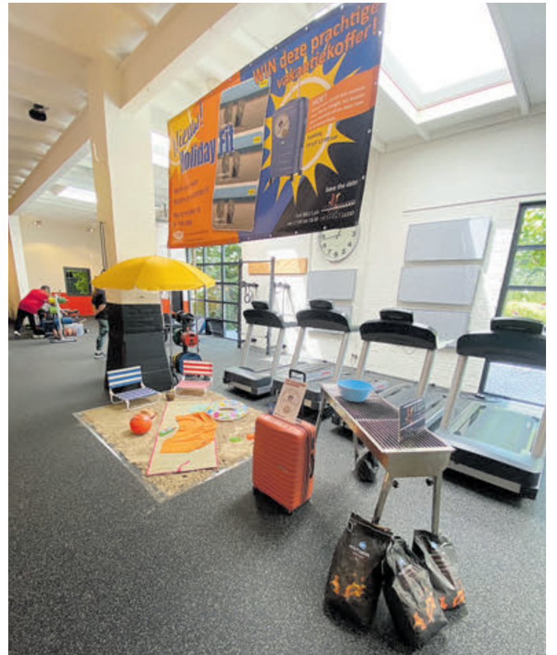
Strandje in club met aankondiging lancering sportapp: maak kans op koffer en club BBQ.