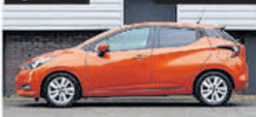
Nissan Micra 1.0L Visia+ € 14.750,-