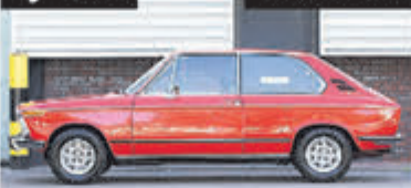
BMW 2002 1802 Touring € 12.950,-