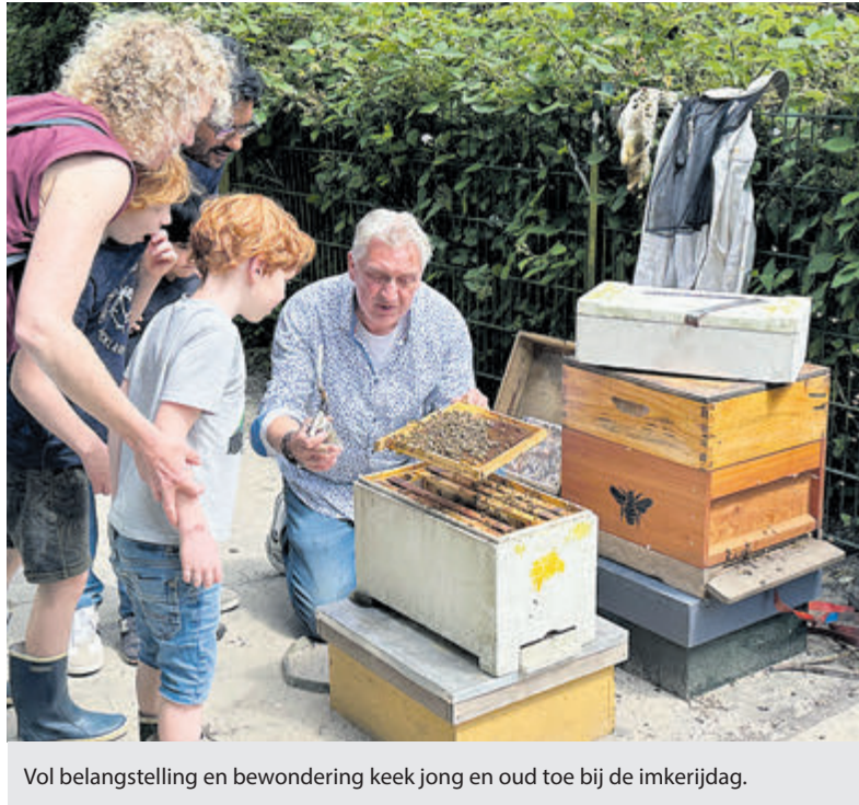
Vol belangstelling en bewondering keek jong en oud toe bij de imkerijdag.