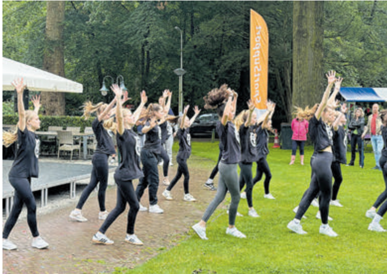
Heerlijk samen bewegen.