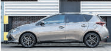
Toyota Auris 1.8 Hybrid Dyn. Ult. € 19.700,-