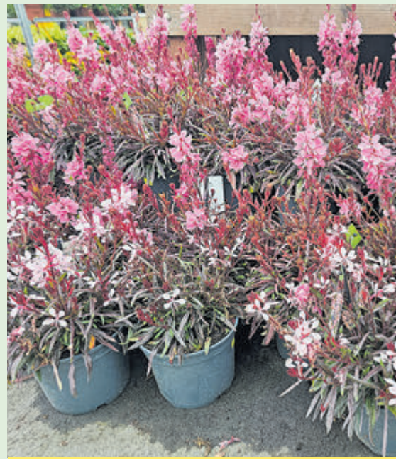
De Gaura lindheimeri oftewel prachtkaars.

Het is namelijk wel een vaste plant, wat wil zeggen dat hij elk jaar opnieuw terugkomt, maar dan wel een kortlevende. Dat heeft voor een groot deel te maken met de extreem uitbundige bloei. Hij steekt zo veel energie in de bloemen, dat er niks overblijft om de winter door te komen. Om dit te ondervangen kan hij in de herfst gesnoeid worden. Door de bloemen af te knippen krijgt de plant de kans de in de herfst nog opgedane energie op te slaan voor het volgende jaar. Mocht u dat niet over uw hart kunnen verkrijgen, dan heb ik daar alle begrip voor. Als u ze laat staan bloeien ze door tot de eerste vorst, en is er kans dat ze zichzelf uitzaaien. Dan weet u alleen niet welke kleur de bloemen van volgend jaar gaan zijn, want ze vermengen makkelijk met elkaar. Maar dat is een verrassing die makkelijk voor lief genomen kan worden, want lelijke kleuren bestaan er niet van.