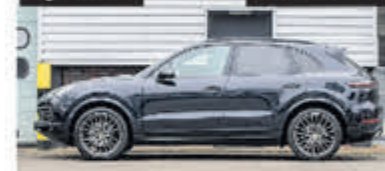
Porsche Cayenne 3.0 € 58.950,-