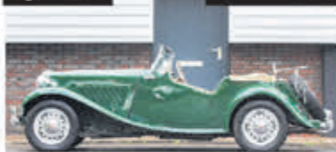
MG TD Roadster € 28.950,-