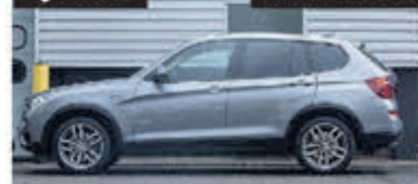
BMW X3 xDrive20i Hi.Ex.xL. € 27.900,-