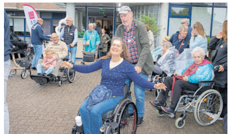
Ondanks de regen gaan bewoners van De Heemhaven met veel plezier van start met de wandeling.