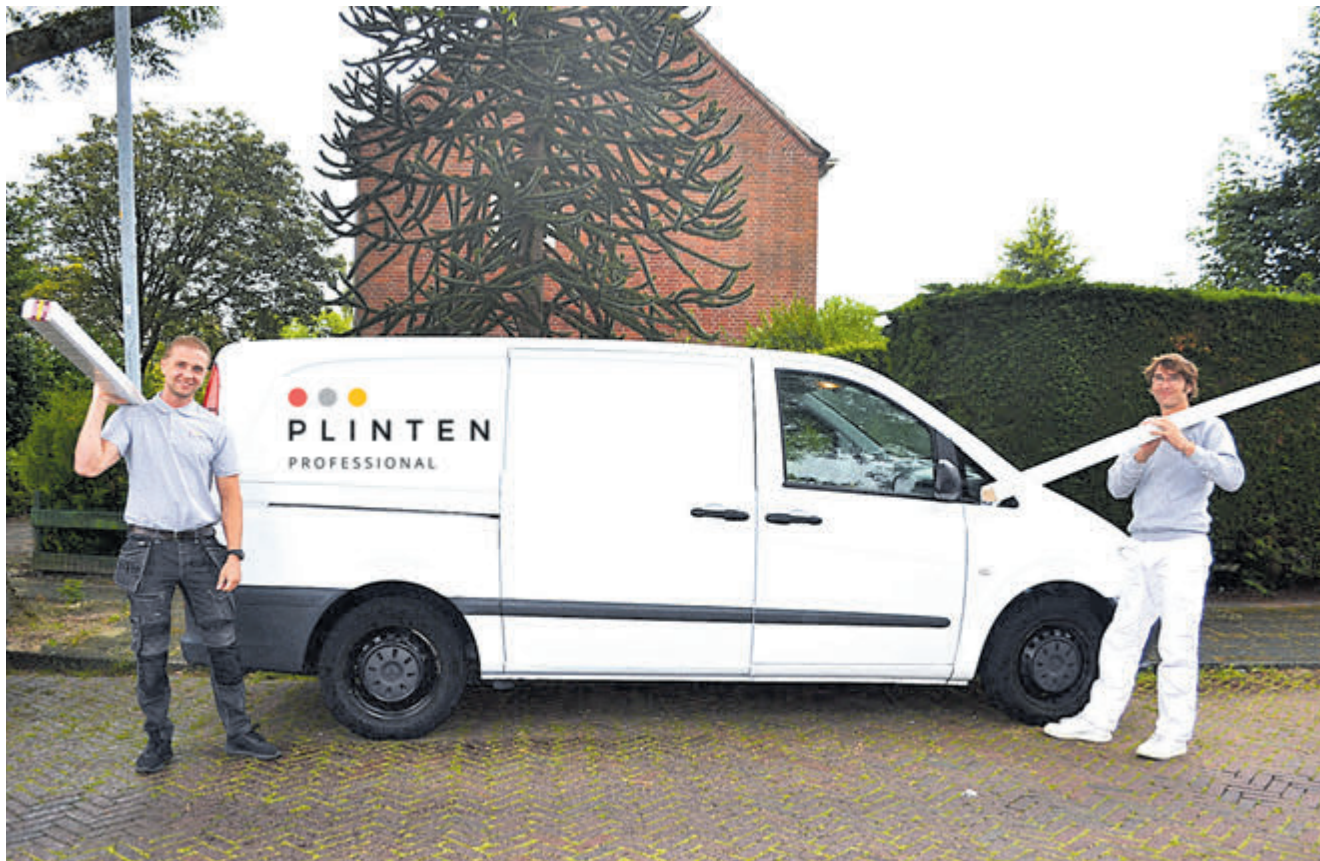
Plinten vakkundig binnen een dag gemonteerd.