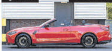
BMW 4-serie Cabriolet M4 xDrive Competit € 159.000,-