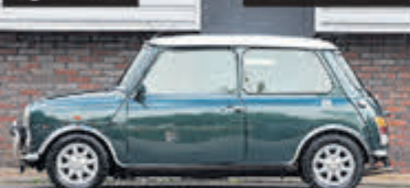
Mini Cooper 1.3 Cooper € 12.900,-