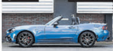
Fiat 124 Spider 1.4 M-Air T Abarth € 28.950,-