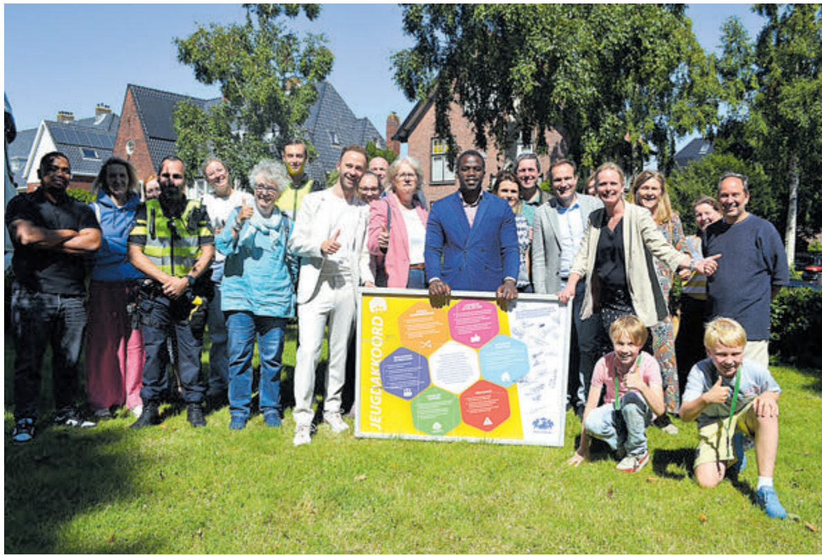
Groepsfoto na de gezamenlijke ondertekening van het Heemstedse Jeugdakkoord.