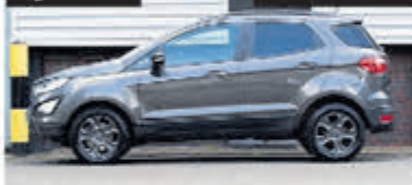
Ford EcoSport 1.0 EB Titanium € 17.900,-