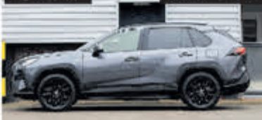
Toyota RAV4 2.5 Hybrid Style € 31.900,-