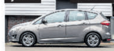
Ford C-Max 1.0 Edition € 8.900,-