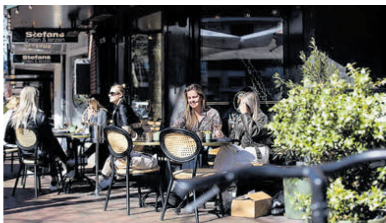
Heerlijk toeven op het terras van Brasserie de Canette.