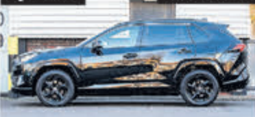
Toyota RAV4 2.5 Hybrid AWD Executive € 34.900,-