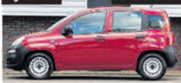
Fiat Panda Panda € 3.950,-