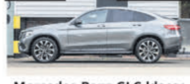
Mercedes-Benz GLC-klasse Coupe 250 4MATIC Premium € 49.950,-