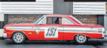
Ford Usa Falcon FUTURA SPRINT € 79.000,-