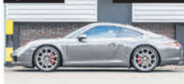
Porsche 911 3.8 Carrera S € 84.900,-