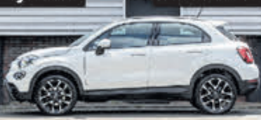
Fiat 500 X 1.3 GSE Lounge € 21.900,-