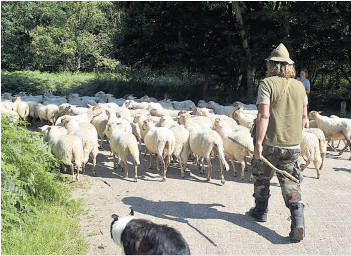
De kudde schape weet de weg snel te vinden in de Waterleidingduinen.

Vogelzang - Ook dit jaar weer neemt een kudde van rond de 100 schape bezit van de Amsterdamse Waterleidingduinen / Waternet. De schape doen er hun graaswerk met als beloning een volle buik. Zij gaan als dierlijke grasmaaier het grote gebied te lijf om zo de vegetatie binnen de perken te houden. Om de natuur te herstellen en alles wat kan groeien en bloeien zijn de dieren van belang. De vegetatie is de plek waar insecten zich graag ophouden. Zij vormen weer de maaltijd voor de vogels en zo grijpt alles in elkaar. Lang waren er (te) veel damherten in het gebied. Herten zijn kieskeurig en zijn, niet zoals schape te sturen. Ook konijnen zijn eerder al uitgezet om de vegetatie kort te houden. Nu doen de schape hun eigen ding en eten naast gras ook blaadjes en takjes, al is het gras de hoofdmaaltijd.