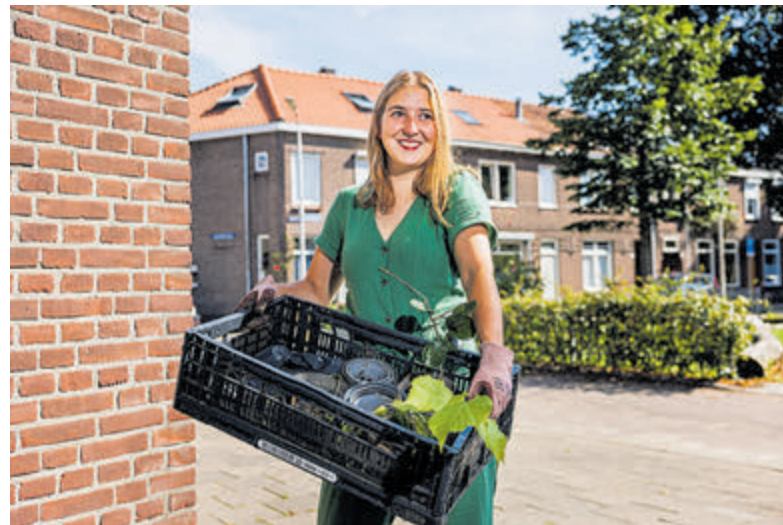
Klimaatburgemeester gezocht.

Klimaatburgemeesters kunnen gemeenten helpen bij het stimuleren van anderen om duurzaam te gaan leven. Zij zijn de verbinding en inspiratiebron voor mede-inwoners. Met activiteiten en initiatieven brengen Klimaatburgemeesters anderen in beweging voor het klimaat, met als hoogtepunt de Nationale Klimaatweek (11-17 november 2024).