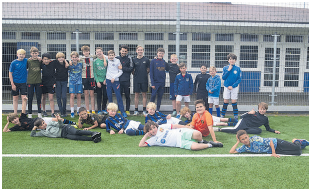
We hebben er zin in!

was een heerlijke BBQ, daarna een beetje voetbal, vuurkorfje met marshmallows. Daarna werd het tijd om te gaan slapen. De stoere mannen probeerden natuurlijk zo lang mogelijk wakker te blijven, Zondag 14 juli werd er om negen uur het ontbijt genoten, maar al snel werden de ballen gezocht en waren de kinderen lekker op het veld bezig. Het programma gaf nog even een potje Belgisch voetbal. Inmiddels was de buikglijbaan uitgerold en nat gespoten, gelukkig was het deze zondag warmer dan zaterdag, de kinderen kregen er geen genoeg van en zo werd er naar het einde van het Jeugdweekend gegleden. Mooi dat met simpele spelletjes een heel weekend gevuld kan worden, nu vakantie, want in september begint de competitie weer en is RCH verheugd dat naast zaterdag 1 ook Kon. HFC zijn thuiswedstrijden bij RCH gaat spelen. Verder is er ook weer groei in de jeugd.