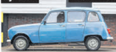
Renault R 4 R 4 € 4.950,-