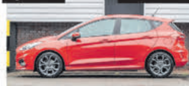
Ford Fiesta 1.0 EcoB. ST Line € 17.900,-