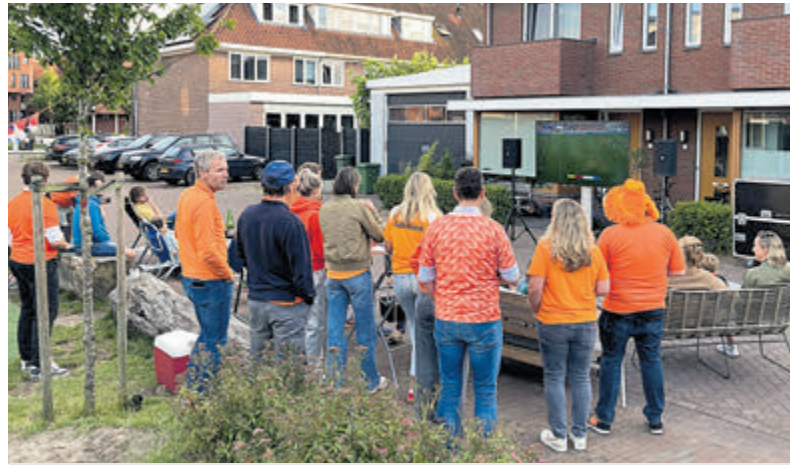
Spannend was de wedstrijd wel!

gens te volgen. Via de buurtapp van de Havendreef kwam het idee ook een scherm neer te zetten, lekker buiten met 'n allen. Het scherm was snel geregeld. Best verrassend, want je zou denken dat veel schermen wel verhuurd zouden zijn. Tegenover het speelplaatsje in de Zeilstraat verzamelde zich jong en oud, met versnaperingen in de buurt. Een fris windje trotserend. Kortom, één en al gezelligheid En dan die laatste minuut... maar snel vergeten: op naar het WK.