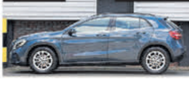
Mercedes-benz GLA-klasse 180 Bus. Solution € 25.900,-