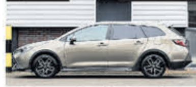
Toyota Corolla Touring Sports 2.0 Hybrid Trek € 26.700,-