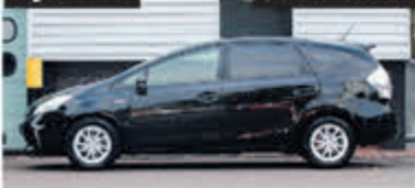
Toyota Prius Wagon 1.8 Aspiration € 14.900,-