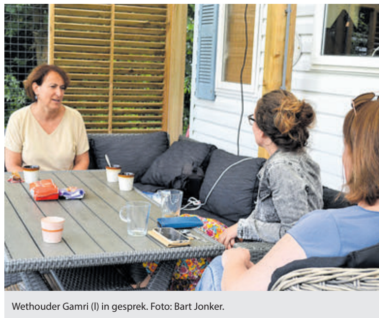
Wethouder Gamri (l) in gesprek.

Word jij de Klimaatburgemeester van gemeente Bloemendaal of Heemstede? Kijk voor de spelregels en hoe je je kunt aanmelden op www.nkw2024.nl/klimaatburgemeester .