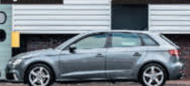
Audi A3 Sportback 35 TFSI CoD ProL. € 24.700,-