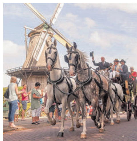
Route der Rijtuigen. Foto aangeleverd.

gemeentehuis langs, RA Ter Hoffstedeweg-Hoge Duin en Daalseweg, RA Midden Duin en Daalseweg, RA Karmelweg, RA Lage Duin en Daalseweg (Halve Maantje), RA Zomerzorgelaan (ronde rechtdoor), LA Sterreboslaan, LA Donkerelaan, RA Brederodellaan, LA Bergweg, parkeren op de parkeerplaats, pauze ca. 12.45/13.00-13.30, Vervolg van de weg RA Bergweg, LA Brederodellaan, LA Zocherlaan (voormalig PZ terrein), LA Duin en Beeklaan-Duinzichtlaan, LA Brederodellaan, LA Velsenderlaan, RA Middenduinerweg, RA Wijnoldy Daniëls laan, LA Olga van Gotschlaan, RA Hardraverslaan, LA Clarionlaan, LA Wüstelaan, LA Velselhoofllaan (molen)-Dinkgrevelaan, RA Kieftendellaan, LA Wulverderlaan, LA Valckenhoeflaan, RA Dokter de Grootlaan, RA J.T. Cremerlaan-(Hagelingerweg oversteken) Antillenstraat, RA Hoofdstraat, RA Hagelingerweg, (direct na rotonde) RA Kweekerslaan, RA Biezenweg, einde rit ca. 15 uur en afsluiting.