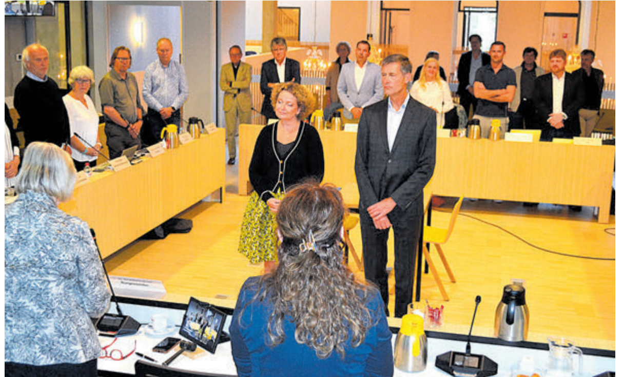
Beide wethouders worden beëdigd.