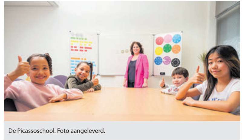
De Picassoschool. Foto aangeleverd.

Ook ziet ze vaker kinderen met leerachterstanden. "Het wegwerken van deze achterstanden lukt op het regulier onderwijs vaak niet. Er is niet genoeg ruimte in het bestaande lesprogramma om deze kinderen te begeleiden. Of er is niet voldoende gespecialiseerd personeel. Als leerprobleemspecialist ben ik fulltime bezig met het zoeken naar oplossingen, naar manieren om leerlingen verder te helpen."