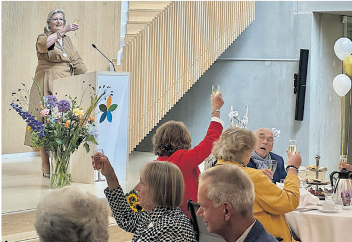
Burgemeester Ankie Broekers-Knol brengt een toast uit op alle 50-jarige huwelijksparen.

Bijzondere gebeurtenissen in 1974 De jubilarissen werden deze middag gastvrij ontvangen door een team dat hen trakteerde op koffie en thee. Hierna was het tijd voor de groepsfoto, waarna ieder kon aanschuiven