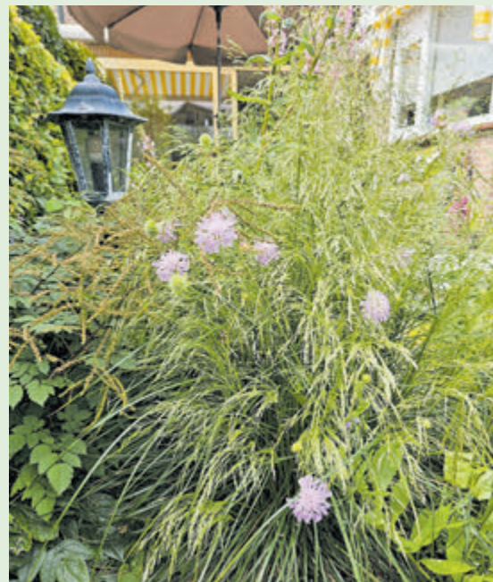
Siergras ruwe smele.

Hillegom/Vijfhuizen - Siergrassen worden meestal in verband gebracht met de nazomer en herfst, en het is waar dat we dan het meest genieten van een prachtige verscheidenheid in bloeiaren. Toch klopt dat beeld niet helemaal, want de eerste siergrassen beginnen al veel vroeger met bloeien. Daarnaast zijn er ook nog eens siergrassen die niet voor de pluimen maar voor de sierwaarde van het blad gewaardeerd worden, bijvoorbeeld omdat het blad mooie streepjes heeft.