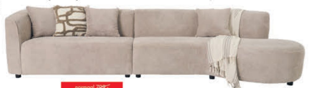
Loungebank Cliff Moderne loungebank met ronde longchair. Leverbaar in diverse bekledingen. In afgebeelde bouclé-stof snel leverbaar. In stof Supreme:

normaal 299,- nu 679,- met 15% extra XL-korting