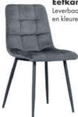
Eetkamerstoel Trentino Leverbaar in diverse bekledingen en kleuren. In stof Supreme:

DIRECT LEVERBAAR normaal 69,- nu 58,- met 15% extra XL-korting