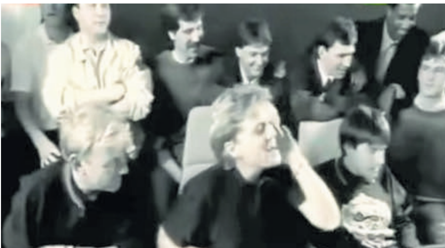
Het Engelse voetbalteam in de studio in 1988.