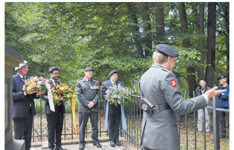
Veteranen en actieve militairen met bloemstukken.

Uiteindelijk versloegen de Spanjaarden de manschappen van Willem van Oranje nabij het Manpad. De actie was opgezet om de onder vuur liggende stad Haarlem te voorzien van voedsel. Na een langdurige belegering die zeven maanden duurde gaf Haarlem zich over aan de Spanjaarden.