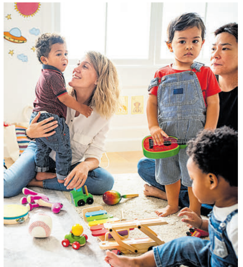
De speelgroep.

Geïnteresseerde vrijwilligers kunnen zich opgeven bij de vrijwilligerscoördinator van Welzijn Bloemendaal Monique Coffeng. Via e-mail: monique@welzijnbloemendaal.nl of telefonisch 023-525 03 66.