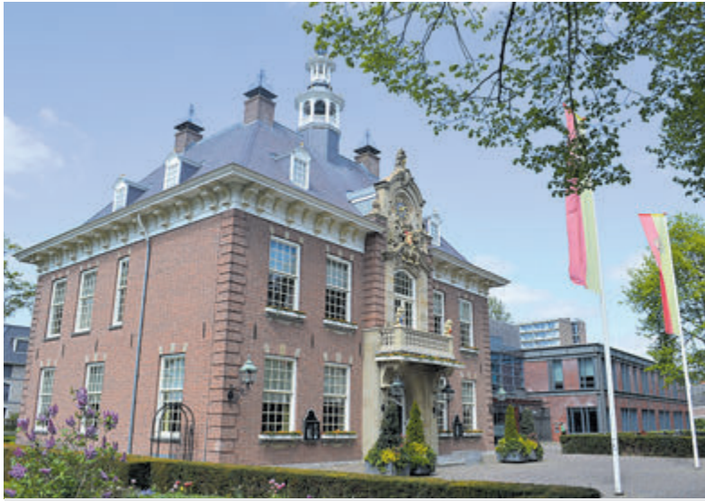
Raadhuis Heemstede.