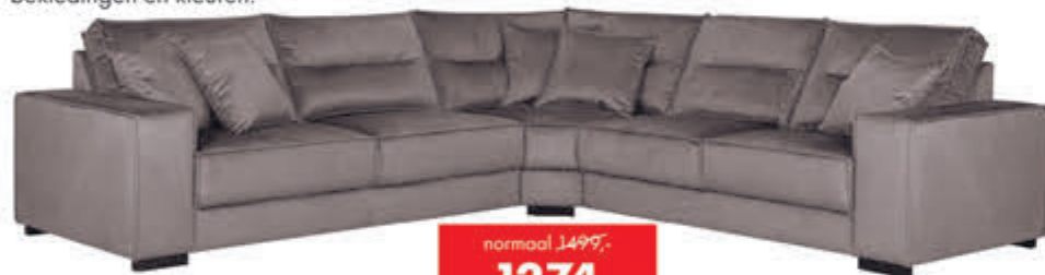
Hoekbank Dallas Hoekbank in stof Supreme. Ook mogelijk in fluweelstof en diverse andere bekledingen en kleuren.

normaal 1499,- nu 1274,- met 15% extra XL-korting