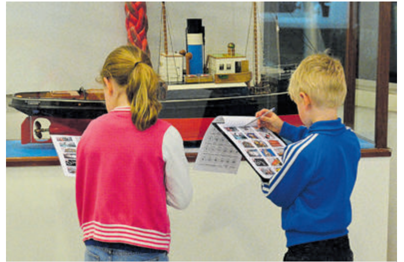
Wat voor weer het ook is, in het Zee- en Havenmuseum is altijd wat te beleven

Adres: Havenkade 55, IJmuiden. www.zeehavenmuseum.nl .