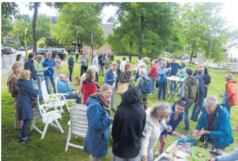
Jong en oud gezellig met elkaar aan het kletsen.

Een kleine hoop is dat er in de toekomst ook gebruik gemaakt kan worden van de koffiekamer, dat gepland staat binnen de bouw van woningen op de plek van het huidige Princehof. De burgemeester en wethouder namen dit mee.