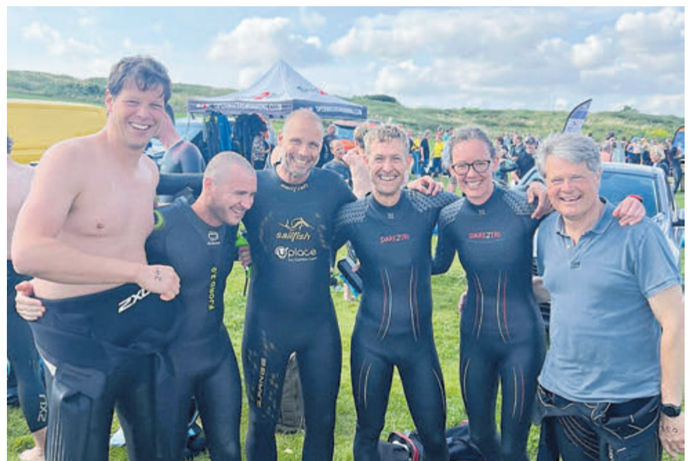
De HPC-afvaardiging bij de Mooie Nel Swim.