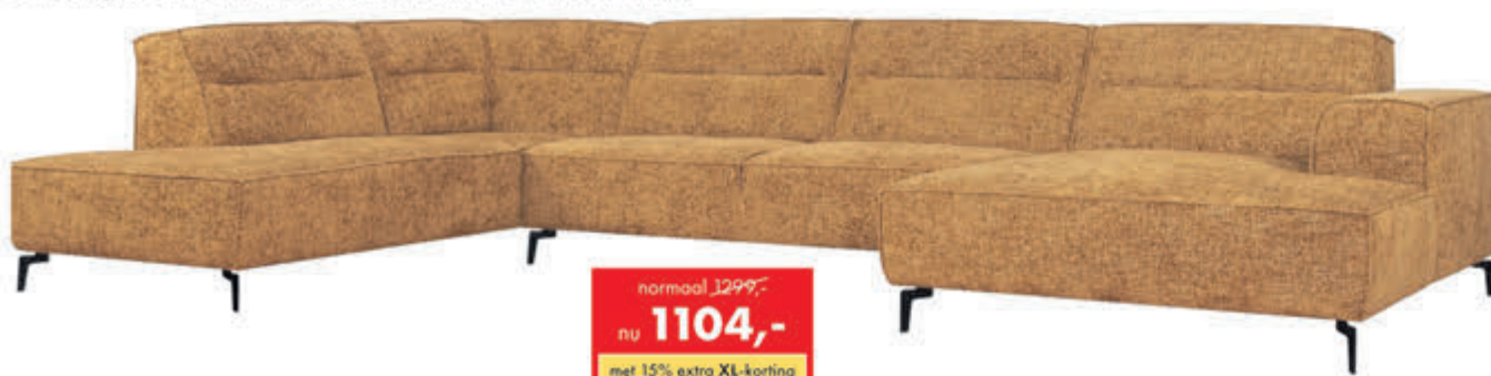
Hoekcombinatie Porto In stof Supreme. Als Terminal-1½+Hoek+3+Longchair: normaal 1899,- nu 1614,-. In talloze opstellingen, bekledingen en kleuren leverbaar. Als Terminal-1½+Hoek+3-zits:

normaal 1299,- nu 1104,- met 15% extra XL-korting