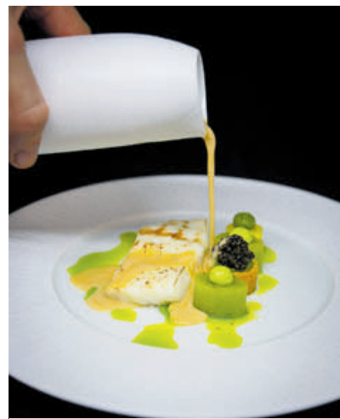
Tarbot van de Shichirin met Impérial kaviaar, gekonfijte prei en beurre blanc met Pernod.