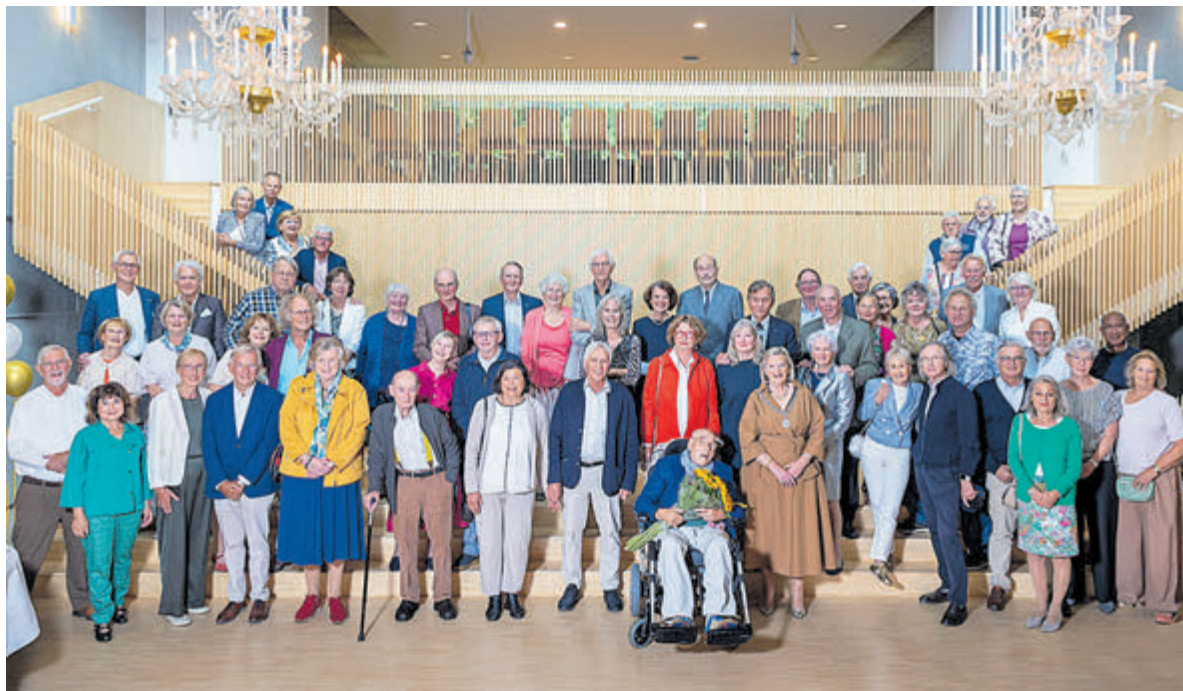
Alle 50-jarige huwelijksparen bij elkaar met de burgemeester.

Meer weten of aanmelden? Ga naar www.verspreidnet.nl of bel 0251-674433.