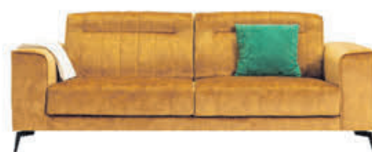
2½+2 zits Matera Trendy bankstel in stof Supreme. Diverse bekledingen en kleuren mogelijk.

normaal 1499,- nu 1274,- met 15% extra XL-korting