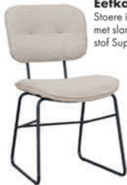
Eetkamerstoel Pacific Stoere industriële eet- kamerstoel met slank metalen onderstel in stof Supreme.

DIRECT LEVERBAAR normaal 129,- nu 109,- met 15% extra XL-korting