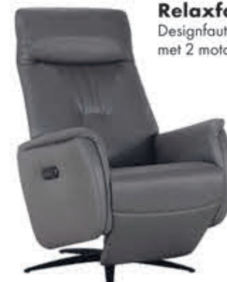
Relaxfauteuil George Designfauteuil, elektrisch uitgevoerd met 2 motoren. In Stofcategorie 1:

normaal 1199,- nu 1019,- met 15% extra XL-korting