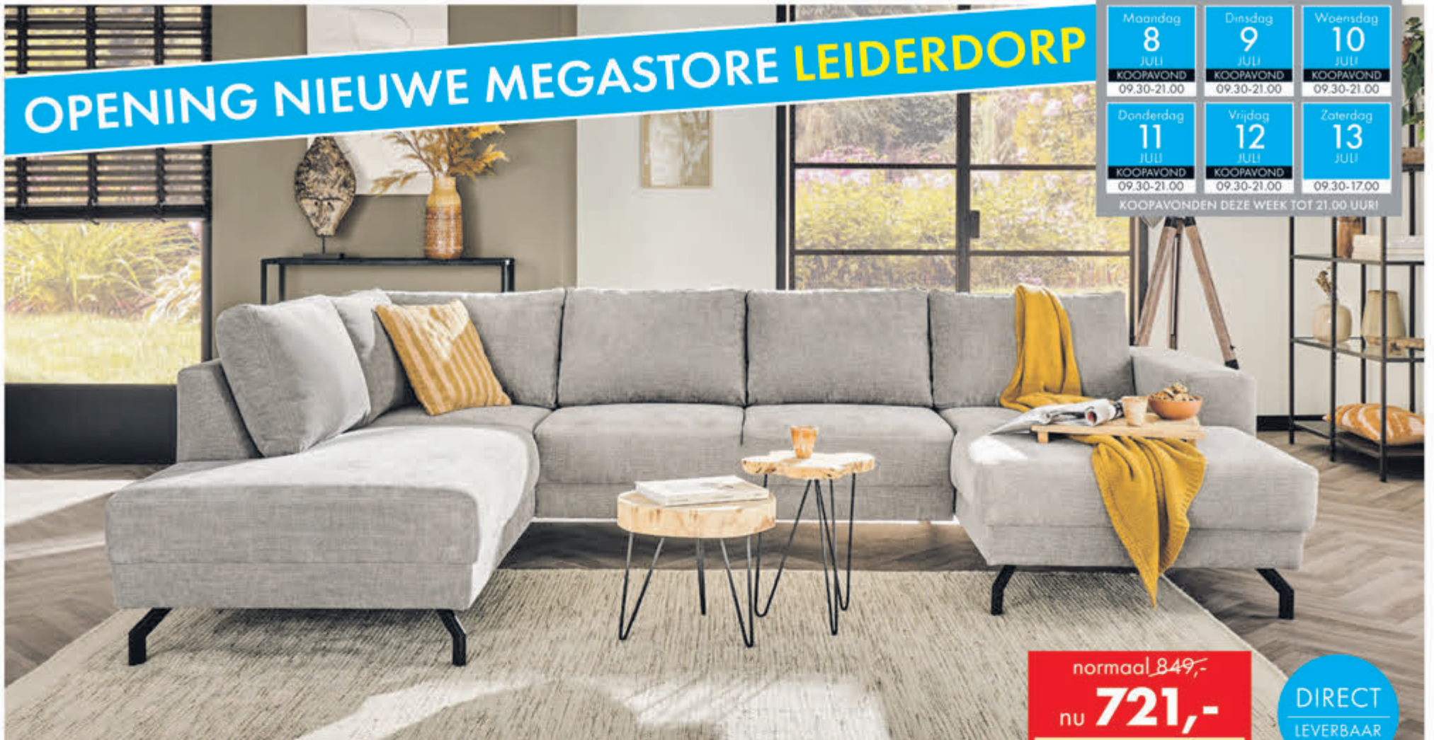
Hoekbank Capri In stof Supreme. Als Terminal-1+Hoek+2+Longchair: normaal 1249,- nu 1061,-. Als Terminal-1+Hoek+2:

normaal 849,- nu 721,- met 15% extra XL-korting