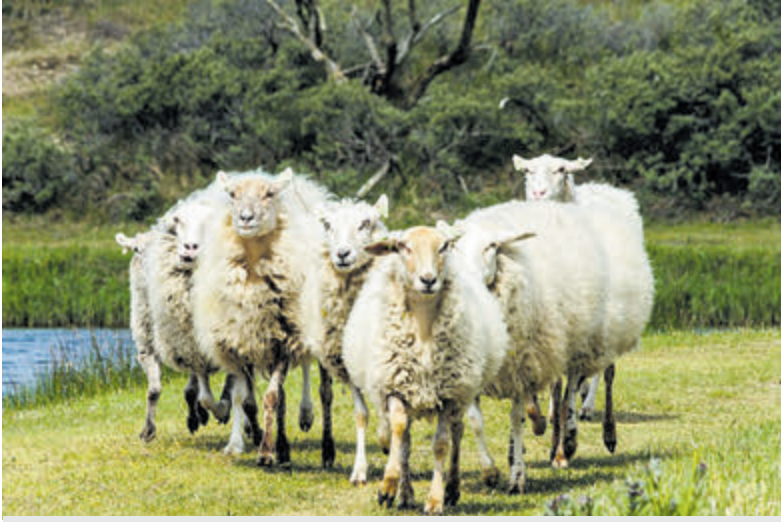
De schapen komen weer helpen grazen tegen vergrassing.