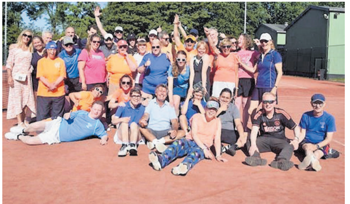
Het Padeloernooi was een gezellig en groot succes. Foto aangeleverd.

Benieuwd of de Picassoschool bij jouw kind past? Doe de online test op www.picassoschool.nl . Daar kun je je ook aanmelden voor een vrijblijvend kennismakingsgesprek.