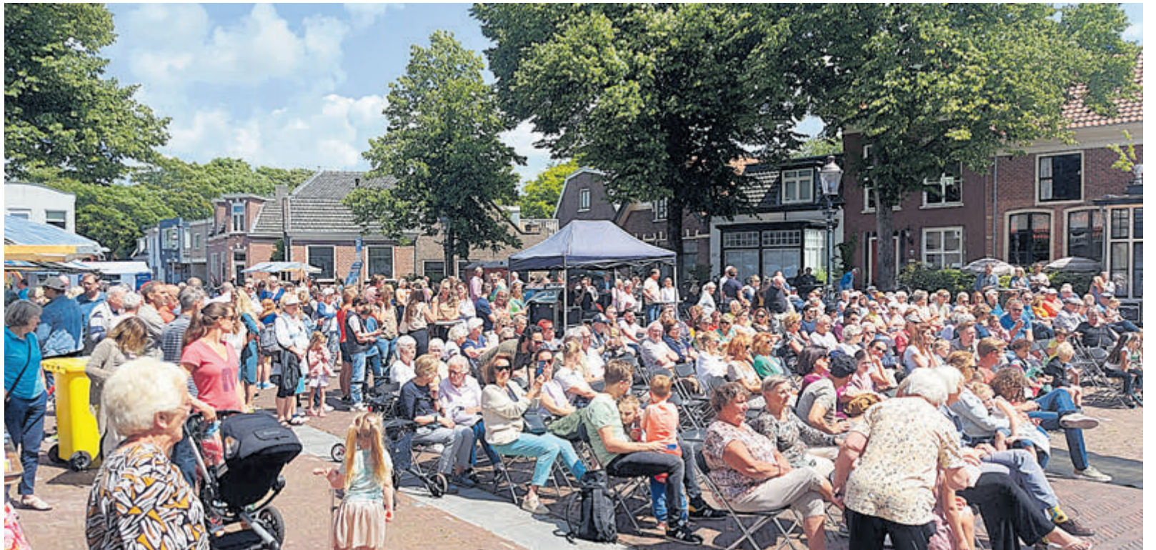
Beleef Heemstede.

Naast de traditionele opening van Harmonie St, Michael staan er twee