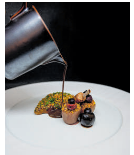
Anjou duif op karkas gegaard met kersen, crème de volaille en jus met Madeira. Foto's aangeleverd.