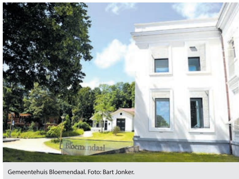
Gemeentehuis Bloemendaal.

Maar er zijn ontwikkelingen waardoor het noodzakelijk blijft voldoende buffers achter de hand te houden. Ankie Broekers-Knol: "Dat komt onder andere door de open einderegelingen in het sociaal domein en de opgaven op het gebied van klimaat en duurzaamheid. Ook reserveren we kredieten voor onderwijshuisvesting zodat onze scholen toekomstbestendig zijn en blijven. En er is aandacht voor de huisvesting van kwetsbare groepen. Dit alles noodzaakt ons scherp te blijven en te sturen op structureel financieel evenwicht."