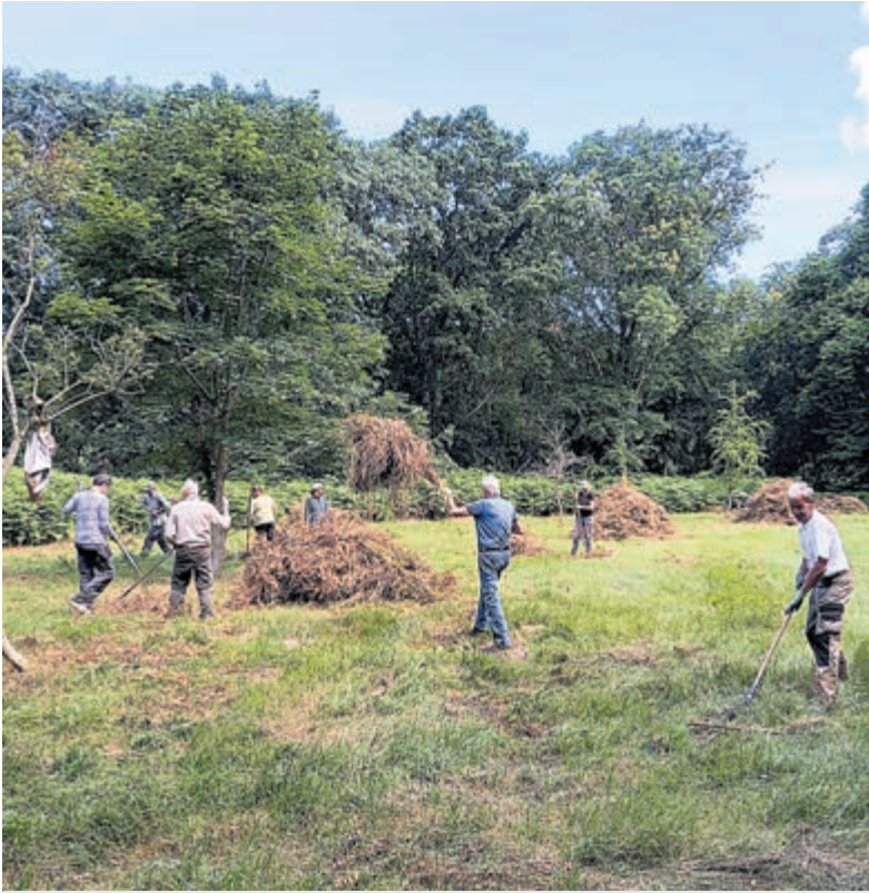
Hooien op Leyduin.

Aanmelden/informatie bij Marc van Schie, 06-22 5757 48 of kijk op www.ivn.nl/zk .