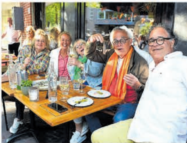
Met zijn allen genieten op het terras van de Canette.