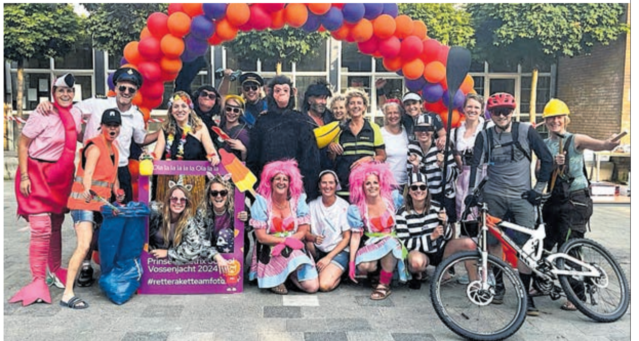
De 'vossen' van de Vossenjacht op Prinses Beatrixschool.

Bij terugkomst op het plein werd iedereen feestelijk ontvangen door de oudercommissie van de school. Het was een groot succes, een echt memorabel moment voor de leerlingen uit hun schoolcarrière op de PBS.