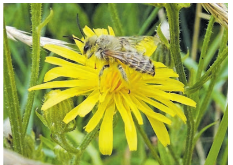
Pluimvoetbij op streepzaad.

Informatie: info@thijsseshof.nl of op www.thijsseshof.nl .