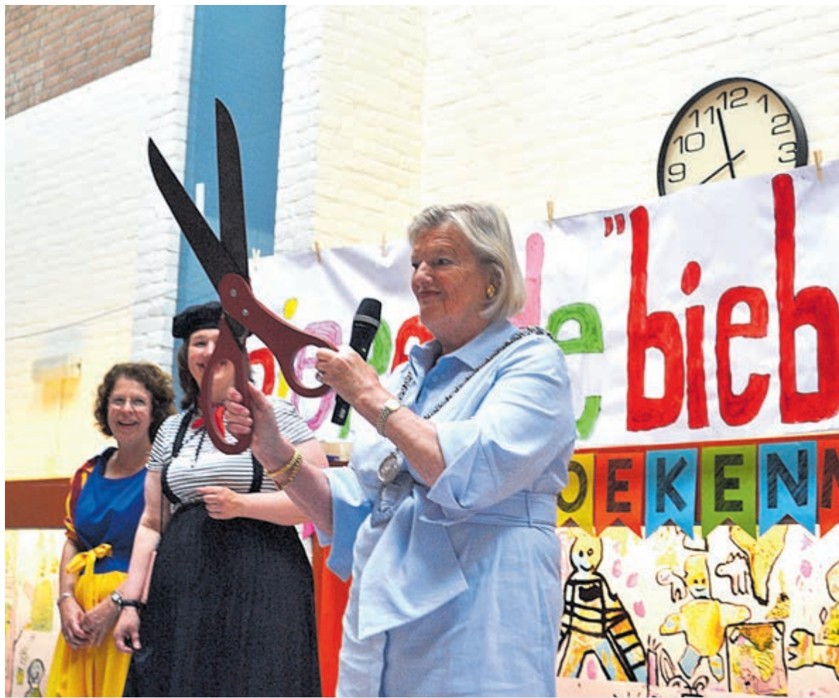
De burgemeester hanteert de reuzenschaar voor de opening.

“En nu hebben jullie zo'n mooie bibliotheek in de school met fraaie boeken. Lezen is echt leuk en best belangrijk”, vervolgde ze. “Je kunt in jullie mooie eigen bibliotheek voor van alles terecht. Eerst begin je plaatjesboeken te bekijken en dan word je