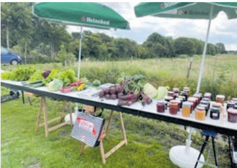
Open dag bij amateur tuindersvereniging BATV.

en tegen een kleine vergoeding zijn er pannenkoeken en koffie, thee en limonade verkrijgbaar. Om 15 uur is de prijsuitreiking van de wedstrijd 'Wie heeft de zwaarste Courgette?' en wordt de middag afgesloten met frisdrank, wijn of een biertje. Bij vertrek krijgt elke bezoeker een inheems bijenplantje cadeau. Tot ziens op 6 juli aan de Zandlaan 250 meter voorbij nummer 36 in Bennebroek.