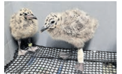
Jonge meeuwen in de opvang.