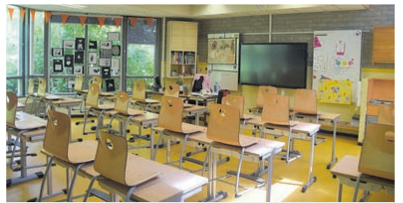
Nog even les, maar binnenkort wordt het leeg opgeleverd.

Voor de leerkrachten is er dan nog geen vakantie, want in twee dagen moet de hele school leeg gemaakt worden. Er staan al vele verhuisdozen klaar, maar daar gaan nog heel veel dozen bijkomen. Op vrijdag 19 juli wordt definitief de sleutel ingeleverd. Een week later nog een extra controle en dan gaat de sloop beginnen. Deels is er al opgeruimd, want op het plein was er markt voor de verkoop van overtollige zaken.