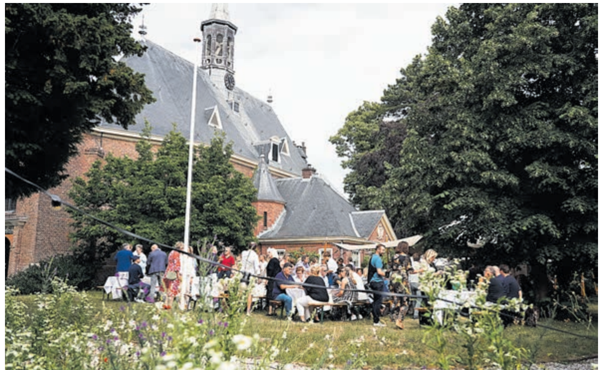
Gezellige Bloemendaalse Zomeravond in 2023. Foto aangeleverd.

De Bloemendaalse Zomeravond is een initiatief van lokale ondernemers die in de tuin van de Dorpskerk en op het Kerkplein een 4 gangendiner verzorgen. Het is een ideale manier om elkaar beter te leren kennen,