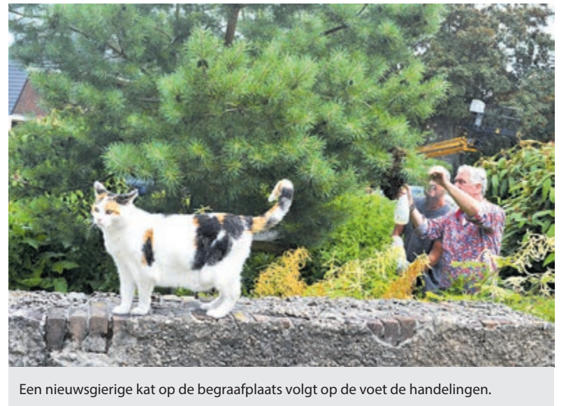
Een nieuwsgierige kat op de begraafplaats volgt op de voet de handelingen.