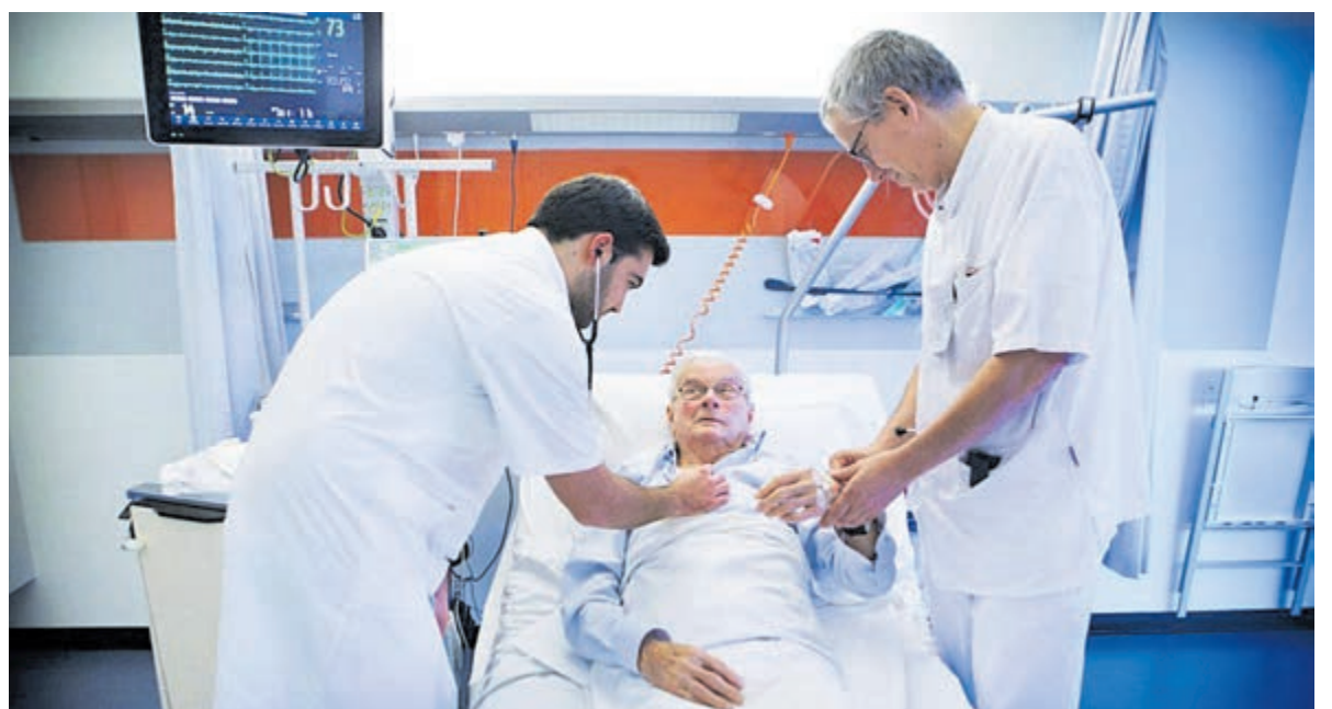
Eerste hart long hulp in Haarlem-Zuid.

ziekenhuis de plannen verder uitwerken. Dat gebeurt in dialoog met externe en interne betrokkenen. In 2025 wordt duidelijk hoe de zorg over de locaties verdeeld wordt. De ambitie is om de veranderingen vervolgens in 2028 gerealiseerd te hebben.