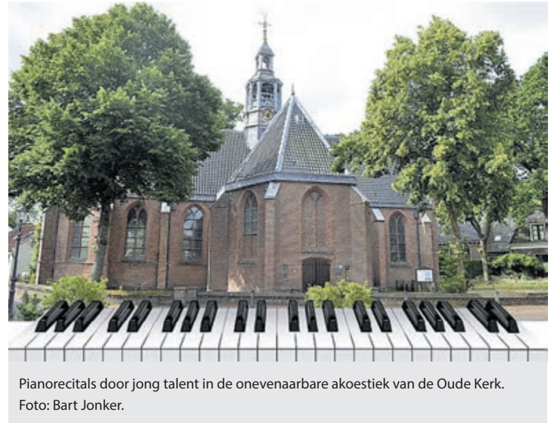
Pianorecitals door jong talent in de onevenaarbare akoestiek van de Oude Kerk.

De entreprijs is 15 euro en voor kaarten kunt u terecht op www.stichtingpianopiano.nl .