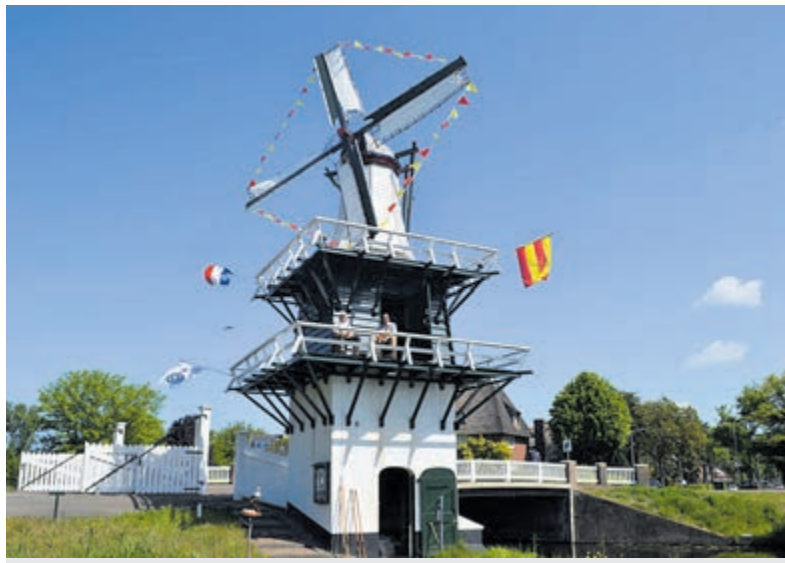
Het Molentje van Groenendaal.