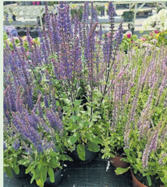
Fraaie paarse Salvia nemorosa.

Er zijn niet veel tuinplanten die kunnen tippen aan deze fantastische plant, de Salvia nemorosa of bossalie.