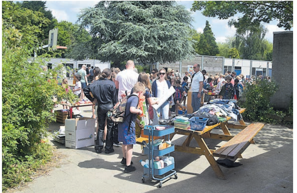
Gezellige markt met overtollige schoolspullen.

Woensdag 17 juli helpen de kinderen een handje met het overbrengen van o.a. de schoolstoelen naar de noodlocatie. Een mooi moment om afscheid te nemen van hun oude school en kennis te laten maken met hun tijdelijke school. Op dit moment wordt er nog aan de inrichting gewerkt.