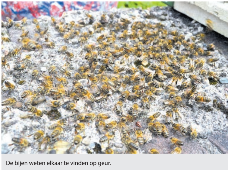
De bijen weten elkaar te vinden op geur.