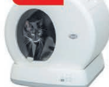
Trixie zelfreinigende kattenbak Kattenbak van stevig kunststof, die zichzelf reinigt. Geen gedoe meer met schepjes!