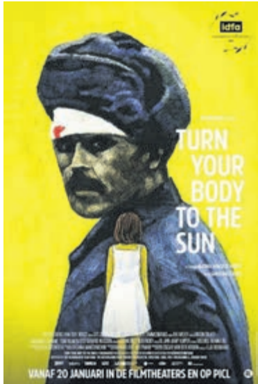
Filmplakkaat 'Turn your body to the sun'.

Aerdenhout – Op dinsdag 2 juli is in de Sociëteit Aerdenhout op de Oscar Mendliklaan 3, 2111 AS Aerdenhout de documentaire te zien 'Turn your body to the sun'. Aanvang film om 10.45 uur, inloop met koffie/thee om 10.30 uur. Het is het ongelooflijke verhaal van een Sovjetsoldaat van Tataarse afkomst die in de Tweede Wereldoorlog gevangen werd genomen door de Nazi's. Nu probeert zijn dochter Sana, via zijn dagboeken en verschillende persoonlijke en openbare archieven en registers, het spoor van haar zwijgende vader terug te volgen, om te begrijpen wat hem maakte tot de man die zij als kind kende. Terwijl ze Sana op haar zoektocht vergezelt, spit regisseur Aliona van der Horst ook filmarchieven uit om sporen te vinden van de miljoenen Sovjetsoldaten die in de vuurlinie lagen van oorlogvoerende dictators; zij die erbij waren maar voor het gemak uit het