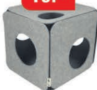
I Love Happy Cats speelkubus Nala Lichte speelkubus voor jouw kat, om mee te spelen of in te verstoppert.