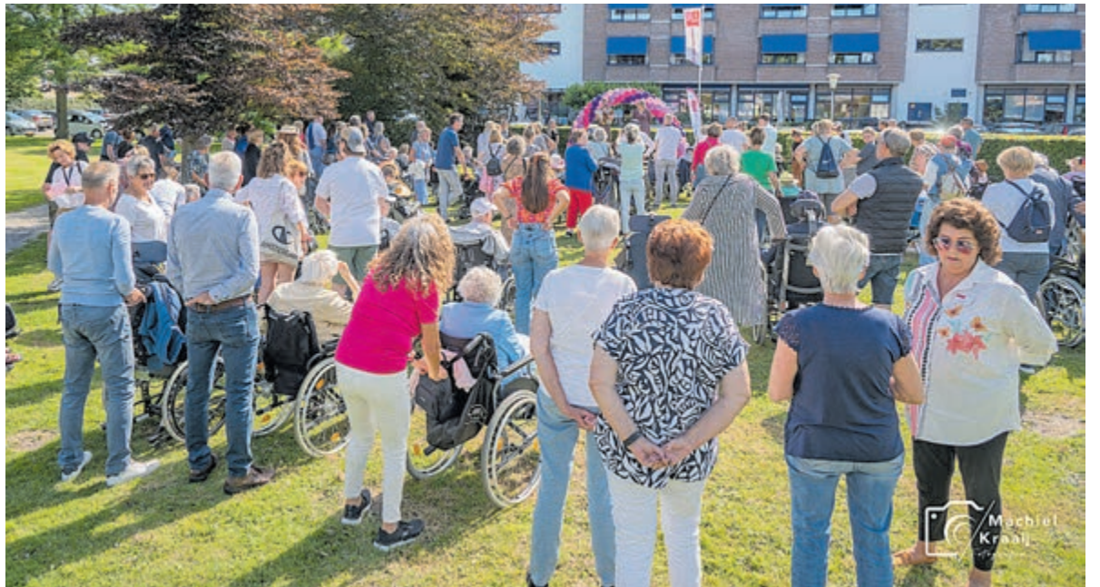
Verzamelen van de wandelgroepjes bij De Heemhaven.

Wilt u zich aanmelden als stop in de buurt, als medewandelaar/rolsoelduwer of heeft u andere vragen? Neem dan contact op met m.kraaij@zorgbalans.nl .