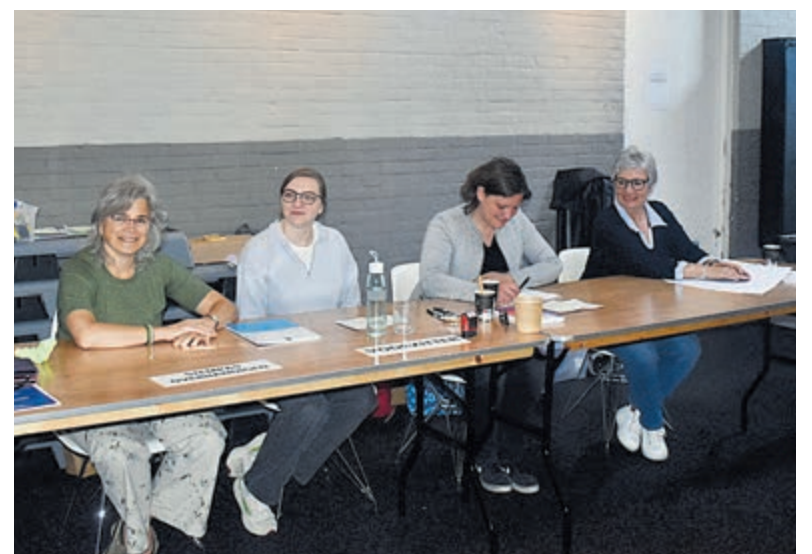
Stemmen bij FMHealth Club.

Plan EU 13, Van de Regio 9. Blanco stemmen: 11, ongeldige stemmen: 13.