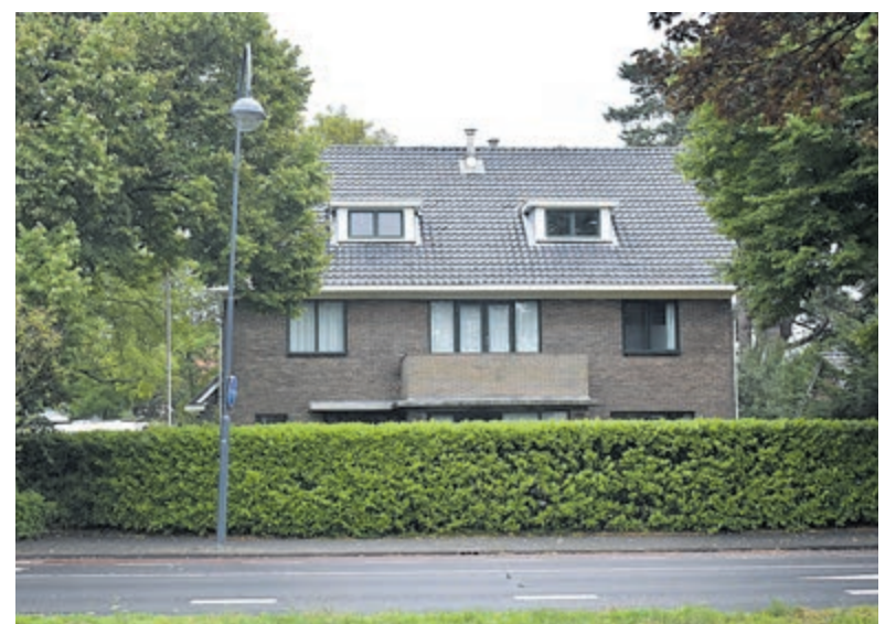
Het pand aan de Heemsteedse Dreef.

De aannemer schat nu in eind juli klaar te zijn en vervolgens wordt het pand intern ingericht. De opening is nu voorzien op 1 augustus. Al met al een onbevredigende uitkomst van voor de gemeentelijke schatkist.