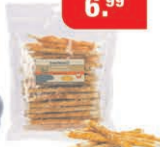
Kauwstaafjes kip 40 st Kauwsnack van runderhuid, omwikkeld met laagjes kip.