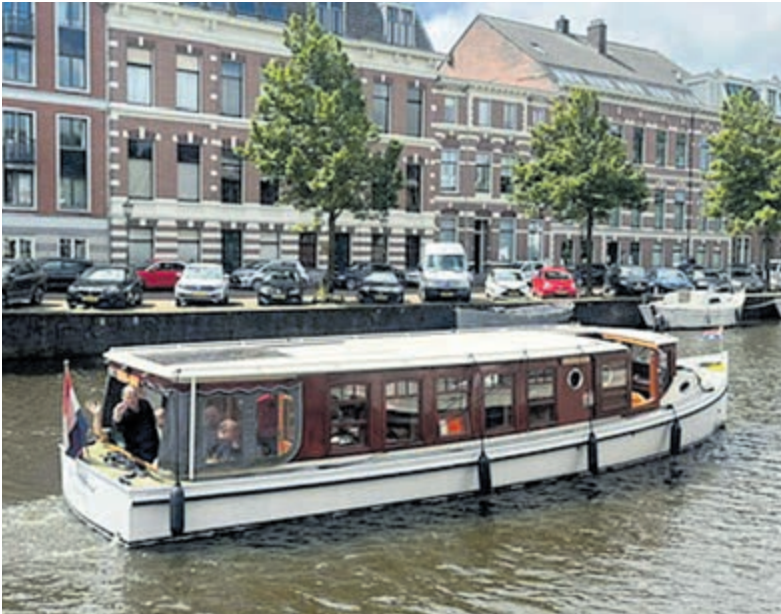
Salonboot 'De Heerlijkheid' van Rederij Haarlem. Foto aangeleverd.