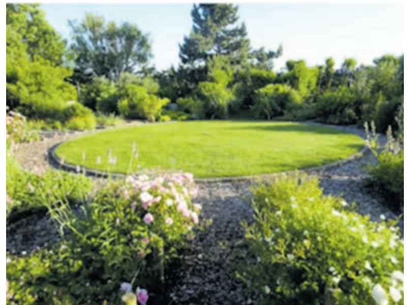
Stiltetuin de Regenboog.

Haarlem - Zondag 16 juni tussen 11 en 4 uur is er open dag bij Stiltetuin de Regenboog aan het Marcellisvaartpad in Haarlem in samenwerking met Groei en Bloei. Je kunt dan (zonder telefoon en of camera) de tuin bezoeken. In de tuin zitten om de stilte en schoonheid van de tuin te ervaren. Die dag zijn biologische plantjes te koop waarvan de opbrengst ten goede komt aan de tuin. Verder is de tuin iedere dinsdag- en donderdagmiddag open tussen 14-16 uur. Je bent van harte welkom. Zie www.de-regenboogtuin.nl .