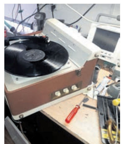
Repaircafé Vogelenzang voor allerhande reparaties.

U kunt vooraf contact opnemen met repaircafevogelenzang@gmail.com of op tel.nr. 06-53561413.