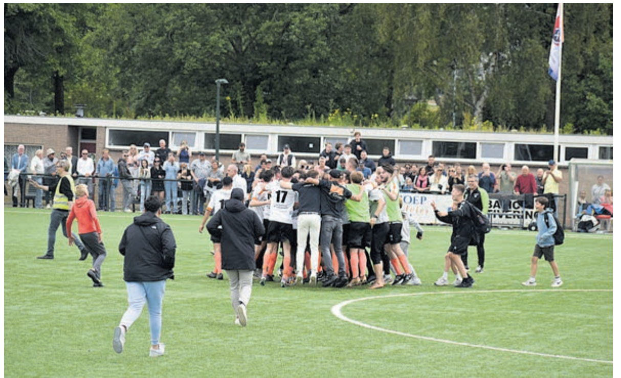
Victorie alom: HBC triomfeerde tegen JOS Watergraafsmeer.

Na de pauze een sterker JOS dat een groot aantal kansen kreeg op de aansluiting. Alle pogingen strandden echter op Verhage en zijn verdedigers. Mohammed Bekkach mocht na de pauze invallen bij HBC, spelmaker Jeroen de Bruijn bleef achter in de kleedkamer. Bekkach stichtte regelmatig verwarring in de defensie van JOS. Jordy Assendelft zag zijn inzet door de doelman tot corner verwerken. Weer trof JOS de paal naast Verhage. De druk op HBC werd groter en groter. Verhage moest opnieuw tweemaal redding brengen en hield zo HBC op de been. Van de invallers