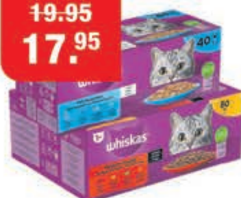
Whiskas natvoer Adult 40/60/80 x 85 gr 40x 19.95 17.95 | 60x 28.99 25.95 80x 36.95 32.95