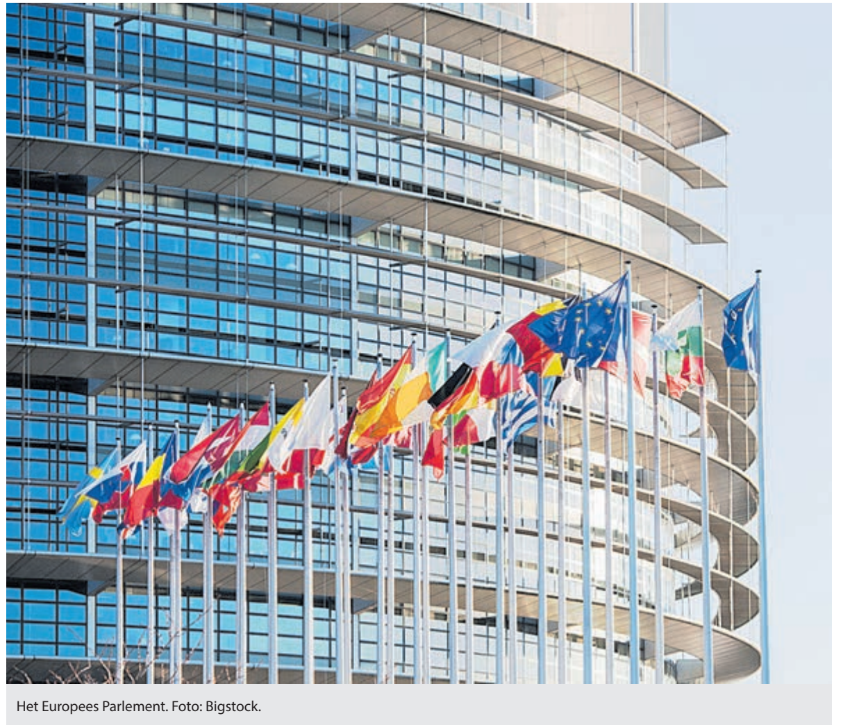
Het Europees Parlement.

De komende 5 jaar zitten de gekozenen op het pluche. Wegstemmen kan men niemand, alleen de voltallige commissie kan naar huis worden gestuurd, al gebeurt dit in de praktijk nooit. We zullen het dus met de 720 gekozenen moeten doen tot de volgende verkiezingen in 2029.