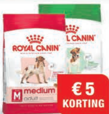
Royal Canin hond Adult Mini, Medium, Maxi of Giant 4 kg Mini 29.95 24.95 | Medium of Maxi 28.95 23.95 Giant 26.95 21.95