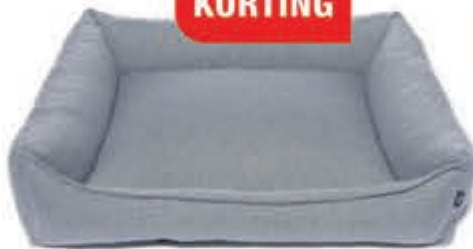
snObbs orthopedische hondenmand Kingston Diverse maten en kleuren. Vanaf 64.95 51.96