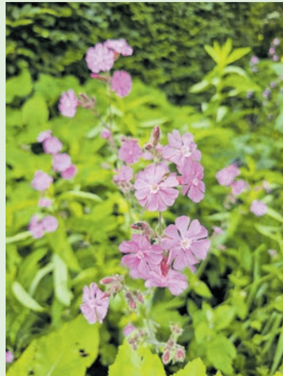
De Dagkoekoeksbloem.

De Dagkoekoeksbloem is te vinden in het veelzijdige assortiment van Tuincentrum De Oosteinde, met filialen op de Zandlaan 22 in Hillegom en op de Schipholweg 1088 in Vijfhuizen.