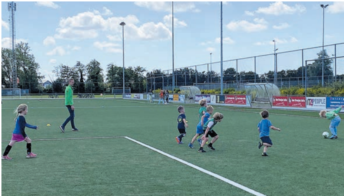
Groep 2 van de Ark had veel plezier op het schoolvoetbaltoernooi.