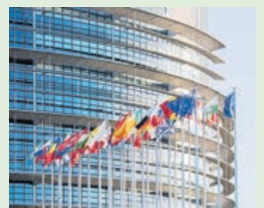
Het Europees Parlement.

In Bloemendaal gingen de meeste stemmen naar de VVD (2528) gevolgd door GroenLinks/PvdA met 2398 stemmen. D66 was derde in rij met 1739. Won landelijk PVV veel stemmen, in Bloemendaal was de partij vijfde in rij met 1035 stemmen. Volt deed het net iets beter en werd vierde in Bloemendaal met 1202 stemmen. Er werden in Bloemendaal 8 blanco en 18 ongeldige stemmen geteld.