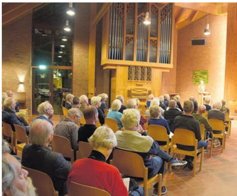
De zaal in het Trefpunt.