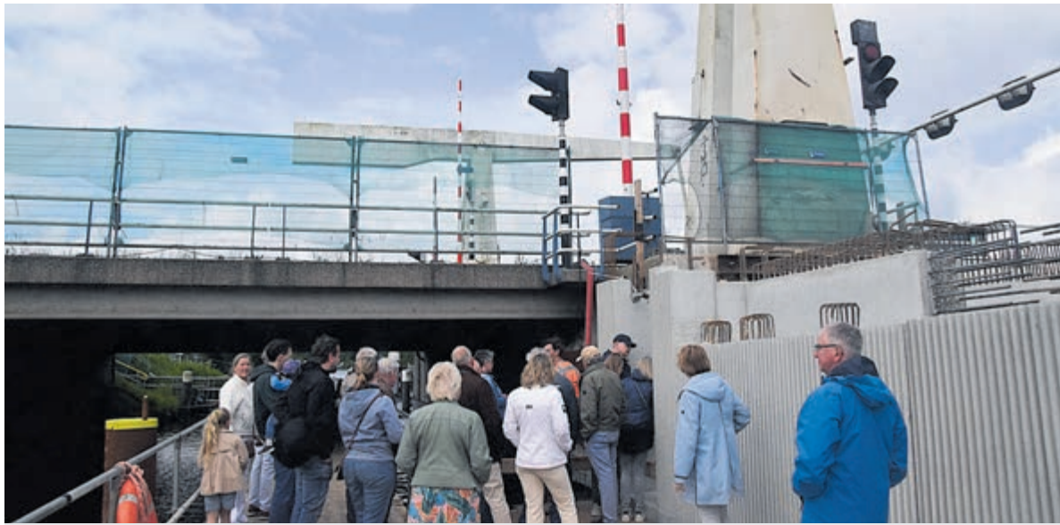
Dag van de Bouw bij de Cruquiusbrug.

Het publiek kon deze Dag van de Bouw zeer waarderen en gaf veel openheid van zaken. Een goed initiatief vanuit de Provincie. De gratis koffie met koek en een ijsje liet ook niemand aan zich voorbij gaan. Er zijn plannen om de opening in 2025 groots aan te pakken voor alle bruggebruikers.