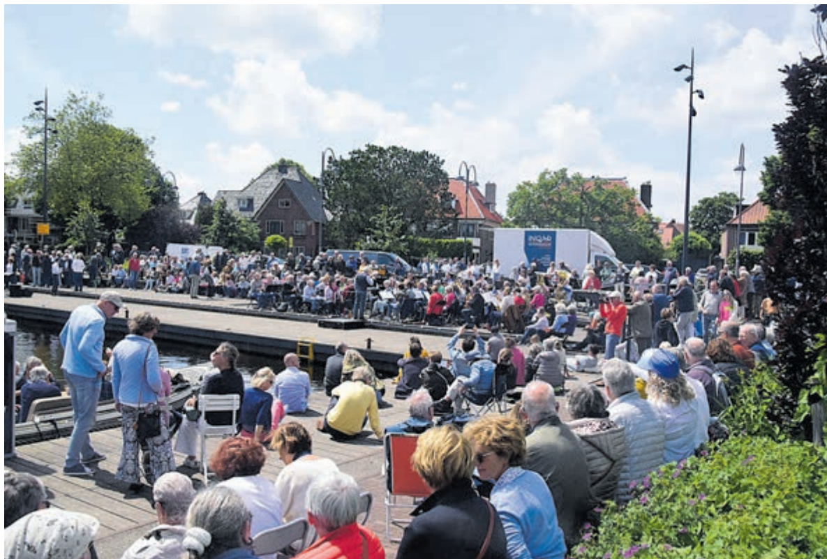
Drukte in de Haven van Heemstede voor het Havenconcert.

Het wordt een non-stop programma van 14 tot 16 uur. Het Symfonisch Blaasorkest blies de aftrap met een compilatie van musicalmuziek. Voor het Voorwegkoor was het de 'eerste keer' aan de haven. Die zongen ze dan ook van harte toe met fraaie liederen, want ze stonden met hun rug naar het publiek. Dat kon ook niet anders, want de dirigent stond aan de havenkant, evenals de muzikale begeleiding. Ook het zingen zonder microfoons en versterkers deed het vocale gebeuren tekort en dat was erg jammer. Ondertussen had de Harmonie St. Michaël zijn