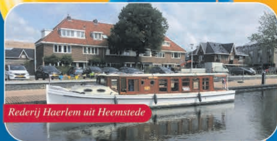
Rederij Haerlem uit Heemstede