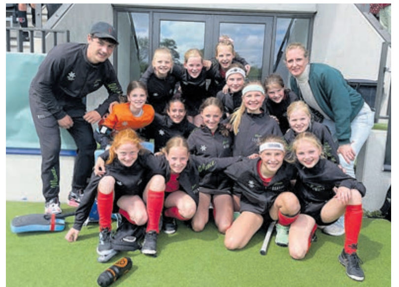
Het MO12-2 meidenteam van Alliance.

hockeyseizoen werden beloond met een kampioenswedstrijd tegen Amsterdam MO12-1 in het Wagner Stadion. Alle ouders, opa's en oma's, vriendjes en vriendinnetjes en overige supporters zaten op de tribune. Het joelen van de ouders "Alli..ance, Alli..ance", galmde door het stadion. De meiden waren zenuwachtig en dat merkten we ook het eerste kwart. Gelukkig werd het spel beter en werden er echt twee goede kwarten gespeeld. Het laatste kwart was de koek op en hebben ze op vechtlust weten uit te spelen. De meiden hebben helaas met 3-0 verloren, maar een ding is zeker; ze hebben een ervaring in het Wagner Stadion met veel publiek cadeau gekregen Een betere seizoenafsluiter hadden ze zich niet kunnen wensen.