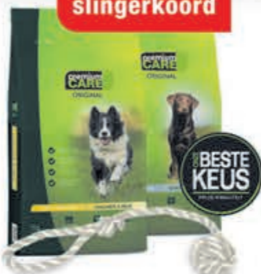
Premium Care hond 12 kg Smakelijke hondenvoeding, afgestemd op de behoeften van jouw viervoeter. Diverse soorten. Vanaf 49.95