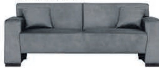
3+2 zits Toledo Bankstel in stof Supreme incl. sierkussens. Leverbaar in diverse bekledingen en kleuren.