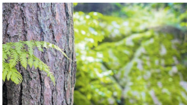
Monumentale bomen op de Algemene Begraafplaats Kleverlaan.