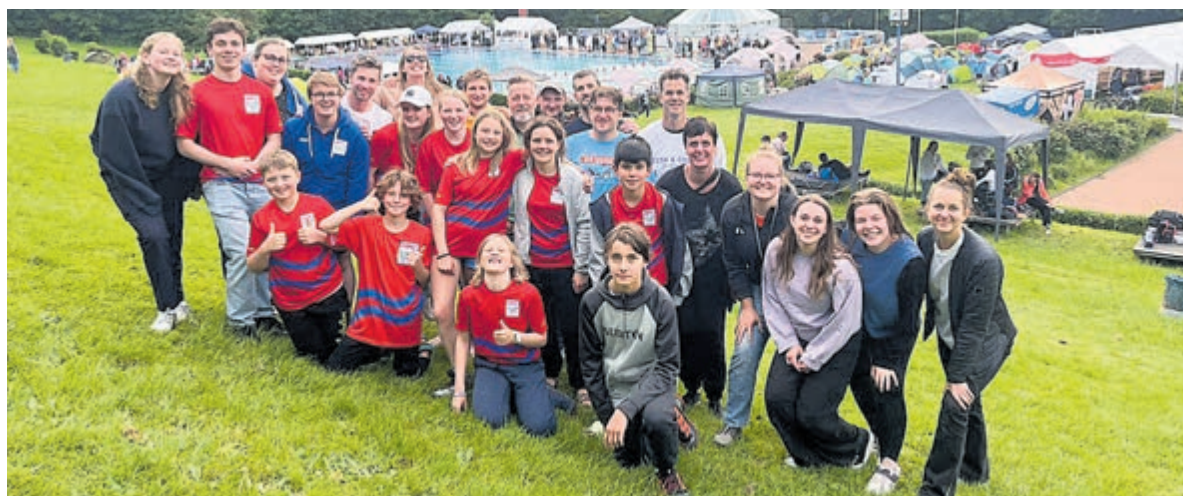
De HPC-groep in het Duitse Hagen.

Heemstede/Hagen - Ook dit jaar is zwemvereniging HPC Heemstede in het Pinksterweekend met 29 enthousiaste wedstrijdzwemmers afgereisd naar Hagen in Duitsland om daar mee te doen aan de 27ste editie van de Internationale Sprint Cup. Om op zaterdagochtend op tijd te zijn voor de wedstrijd, vertrok de bus 's morgens om 5:15 uur vanuit Heemstede richting Hagen. Aangezien de wedstrijd in een buitenbad gehouden werd, waren er onder de HPC'ers toch wat zorgen over de verwachte weersomstandigheden. Gelukkig bleef de verwachte regen en onweer op zaterdag uit en hebben de HPC'ers kunnen genieten van een lekker zonnetje aan de badrand. De sfeer zat er ook dit jaar weer goed in bij de zwemmers en begeleiders van HPC. Terwijl er hard gezwommen werd, werd er op de kant zo hard aangemoedigd dat verschillende HPC'ers al snel hun stem kwijt waren. Dat de sfeer er goed in zat, was ook wel te merken aan het feit dat er zelfs achter het startblok, terwijl er gewacht werd op