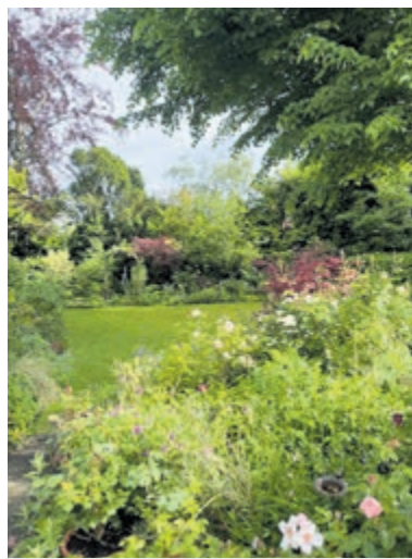
Open Tuinen Weekend in Zuid-Kennemerland.