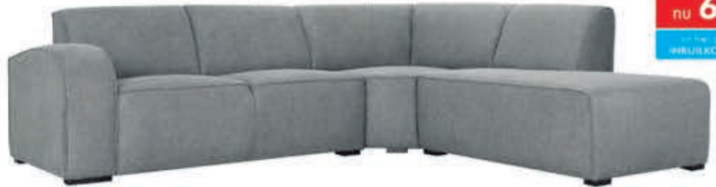
Woonlandschap Firenze In stof Supreme. Als 2½+Hoek+1-Terminal: nu 999,-. Leverbaar in diverse bekledingen, kleuren en opstellingen. Als 2½+Longchair: