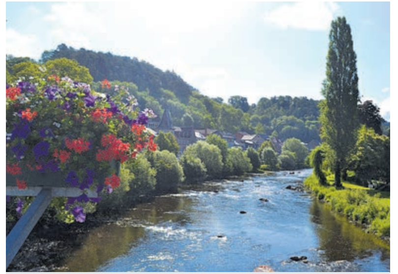
Rivier de Amblève in de Belgische Ardennen.

Verantwoording onderzoek: Emigratiegegevens van het Centraal Bureau van de Statistiek. De gegevens zijn verzameld in mei 2024. Bron: Preply.