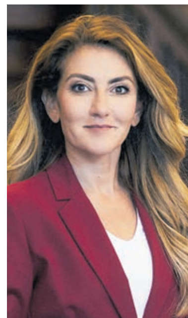
VVD-partijleider Dilan Yesilgöz.

Toch heeft ze in haar drukke agenda ruimte gevonden om op uitnodiging van VVD Heemstede en Bloemendaal langs te komen om over de politiek te spreken. Heeft u vragen voor de politica of wilt u met haar in gesprek over zaken die u bezighouden? Kom dan op maandag 10 juni naar het gemeentehuis van Bloemendaal aan de Bloemendaalseweg 158 in Overveen. De bijeenkomst start om 19.45 uur en aanmelden is niet nodig.