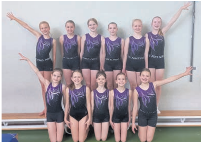
Uitstekende prestaties voor turnsters HBC Gymnastics.