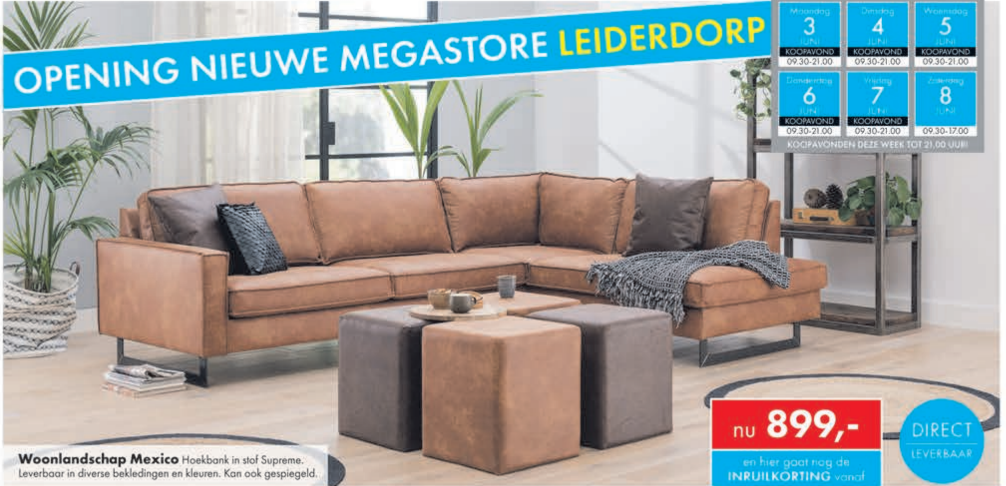
Woonlandschap Mexico Hoekbank in stof Supreme. Leverbaar in diverse bekledingen en kleuren. Kan ook gespiegeld.