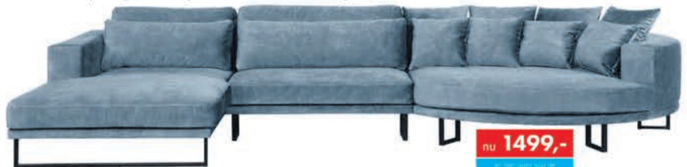
Loungebank Provence In stof Supreme. Moderne loungebank met slanke poot. Als Longchair+1½ XL+Eiland rond: nu 1999,-. In vele opstellingen, bekledingen en kleuren leverbaar. Als Longchair+Eiland rond: