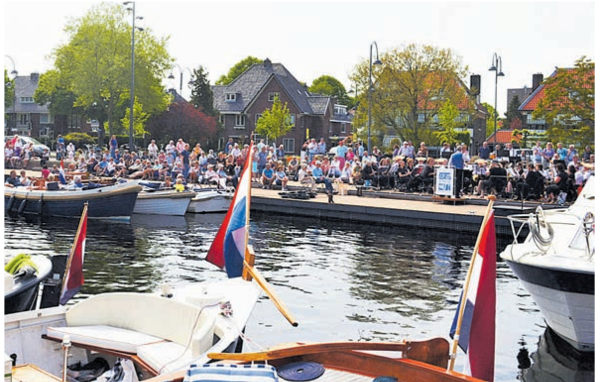
Havenconcert is ieder jaar weer een groots muzikaal spektakel.