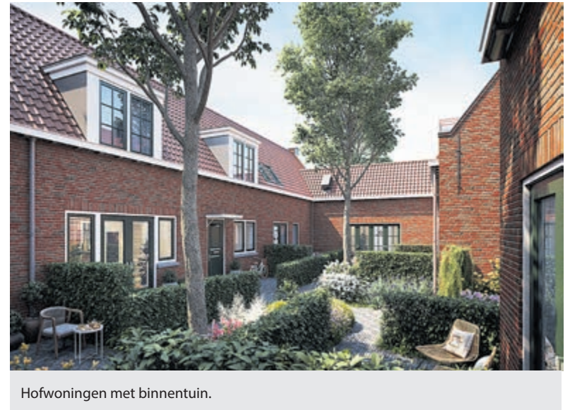
Hofwoningen met binnentuin.