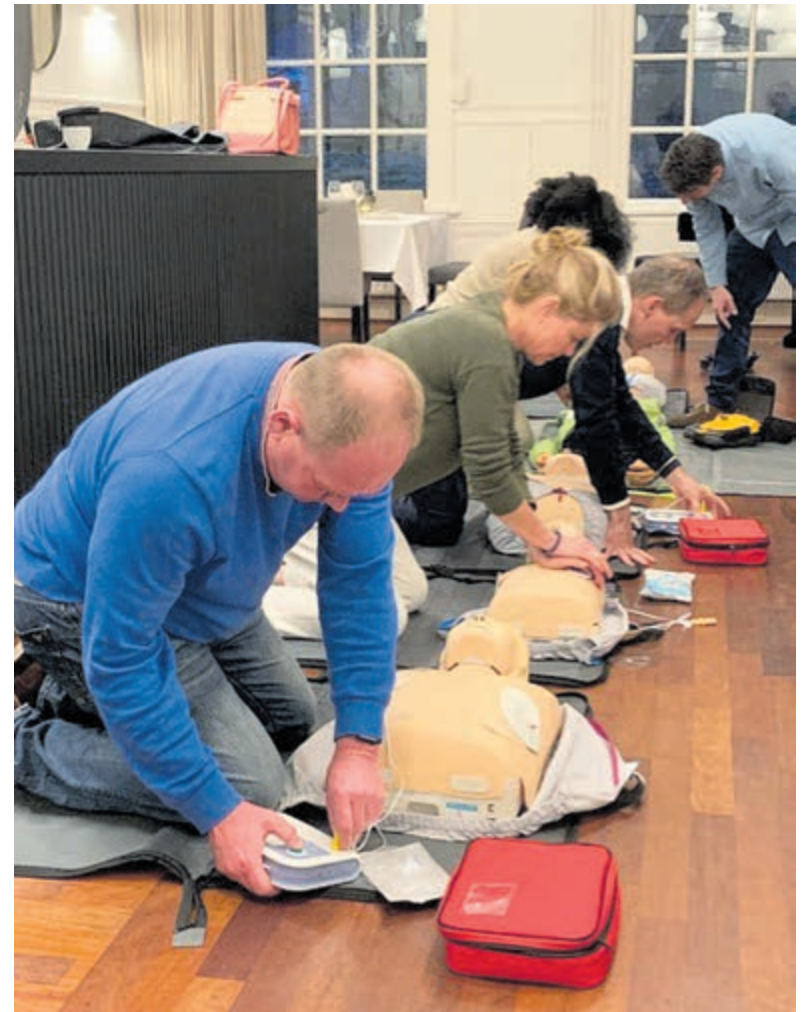
Reanimatietrainingen bij EHBO Heemstede. Foto aangeleverd.

De eerste avond was een paneldiscussie georganiseerd door Rotaryclub Heemstede waar een gereanimeerde patiënt en zijn vrouw, een vrijwilliger van de brandweer en een arts vertelden over hun ervaringen met reanimatie. Er werd onder meer gesproken over ethische kanten zoals wanneer te stoppen met reanimatie; bijvoorbeeld als de partner aangeeft dat de patiënt niet gereanimeerd wil worden en wat reanimatie emotioneel doet met hulpverleners.