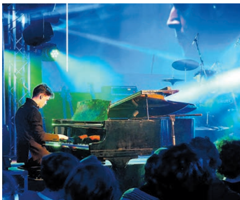
Muzikaal Hageveldtalent op podium Glad marmar.

te voet of in een bootje. Je kunt daar rustig ergens zitten of een rondje lopen onder de feestelijke klanken van deze orkesten en de toegang is geheel gratis. Nu nog hopen op droog weer. Veel plezier! Meer informatie: www.sbo-heemstede.nl .