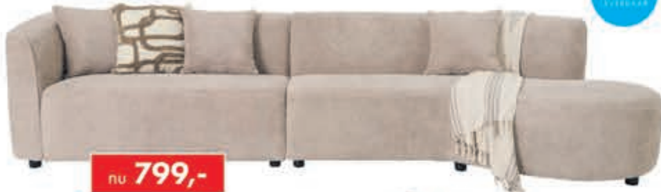
Loungebank Cliff Moderne loungebank met ronde longchair. Leverbaar in diverse bekledingen. In afgebeelde bouclé-stof snel leverbaar. In stof Supreme: