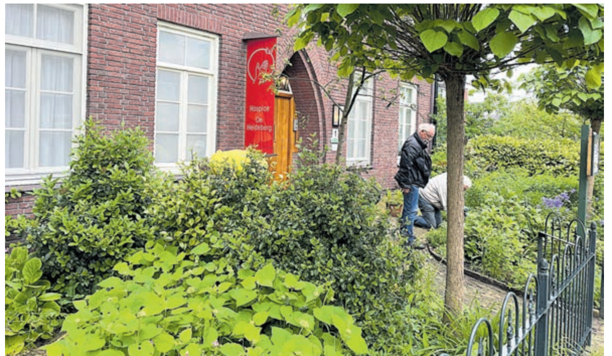
Tuin weer fraai in hospice De Heideberg.

In het hospice is geen moeite de vrijwilligers teveel en gaat de liefdevolle zorg 24 uur per dag door. Uit de vele dankbare reacties in het gastenboek blijkt hoezeer dit huis in een behoefte voorziet.