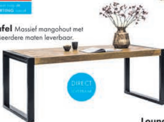
Glenwood eettafel Massief mangohout met staal in maat 160cm. Meerdere maten leverbaar.