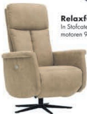
Relaxfauteuil Ascari In Stofcategorie 1, elektrisch 2 motoren 999,-. Manueel: