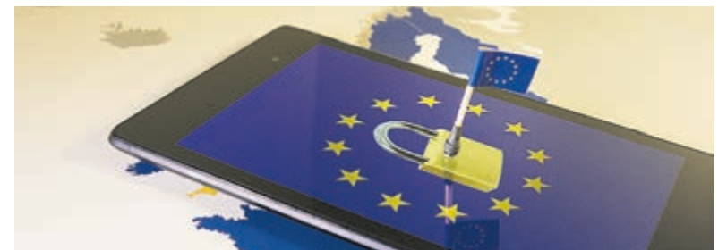
Europese Verkiezingen op 6 juni.

Kosten: € 7,50. Aanmelden: info@wijheemstede.nl of 023 - 548 38 28.