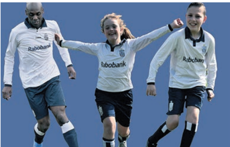
Slottoernooi op 1 juni bij Kon. HFC.

Verenigingen kunnen zich tussen 27 mei en 8 juli aanmelden via: rabo-clubsupport.nl . Vanaf 2 september kunnen Rabobankleden stemmen op hun favoriete club in Haarlem-IJmond.