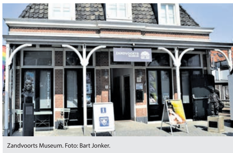
Zandvoorts Museum.