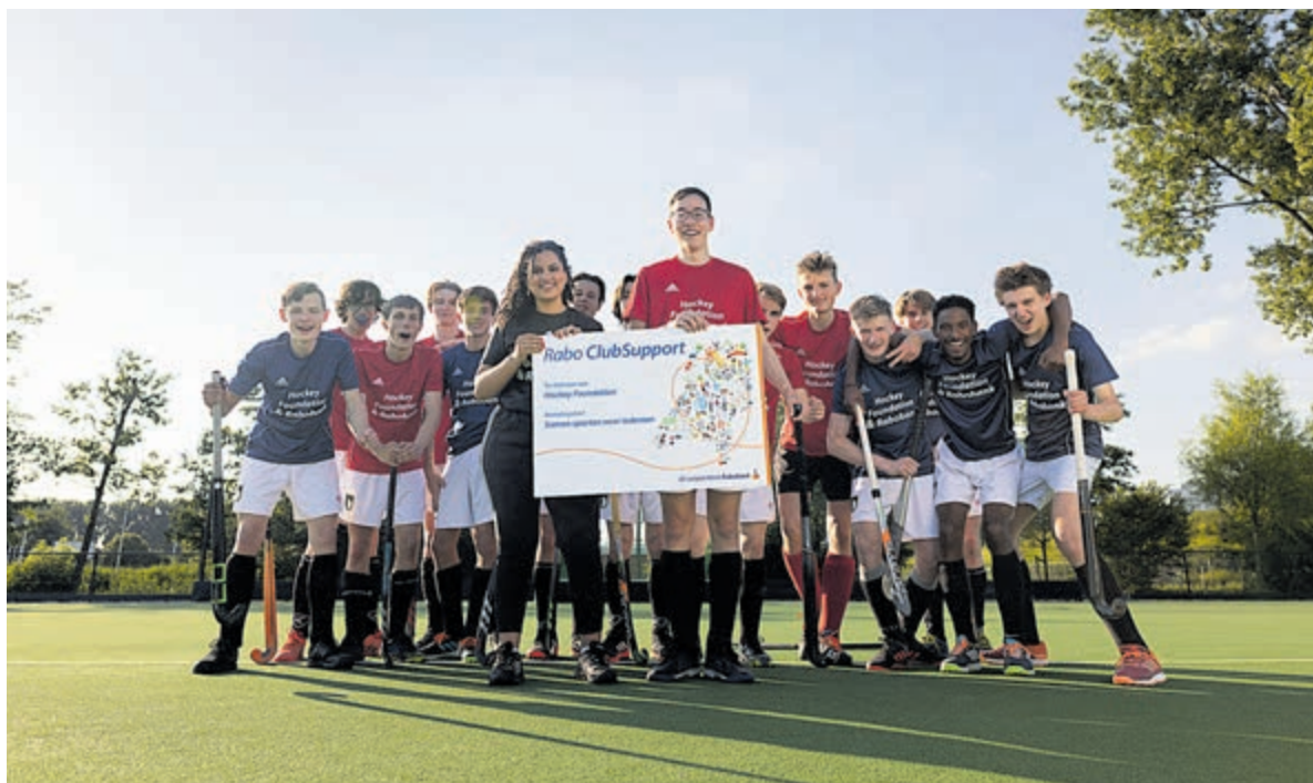
Iedereen verdient een club.

Het 11e Slottoernooi G-voetbal is dit jaar financieel mogelijk gemaakt door de Gemeente Haarlem, de Stichting Zabawas en enige anonieme gulle gevers.