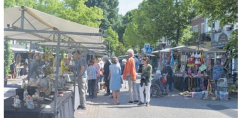
Kunstmarkt in de Jan van Goyenstraat in 2023.