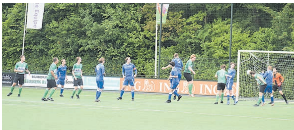
BSM overklast Voorschoten'97.