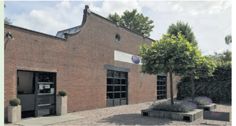
Stemmen kan nu ook bij FM HealthClub. Foto aangeleverd.

democratische betrokkenheid te bevorderen als de gemeenschap samen te brengen in een gezellige en sportieve omgeving. "We zijn verheugd om als stemlocatie te dienen en op deze manier bij te dragen aan de lokale gemeenschap," aldus Wouter Brans, eigenaar van FM HealthClub. "We nodigen iedereen uit om langs te komen, hun stem uit te brengen en te genieten van een kopje koffie of thee."