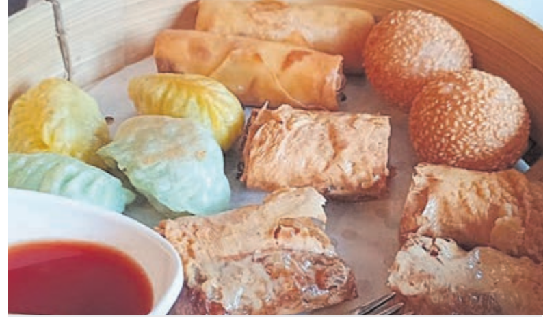
Een gezellig praatje en hapjes om elkaars cultuur te leren kennen.

Heemstede – De gemeente Heemstede nodigt nieuwkomers in het dorp uit om samen te lunchen met Heemstedenaars die al langer in de gemeente wonen. Doel is om elkaar beter te leren kennen. Doordat iedereen een eigen gerecht meeneemt, proeven de aanwezigen letterlijk van elkaars cultuur. De gezamenlijke lunch wordt mede georganiseerd door WIJ Heemstede. “Betere inburgering en integratie helpt nieuwkomers sneller zelfstandig hun weg te vinden in een voor hen onbekende samenleving. Als zij meer contacten hebben, leren ze onder andere de Nederlandse taal beter en dat vergroot hun kansen op de arbeidsmarkt”, aldus de gemeente Heemstede.