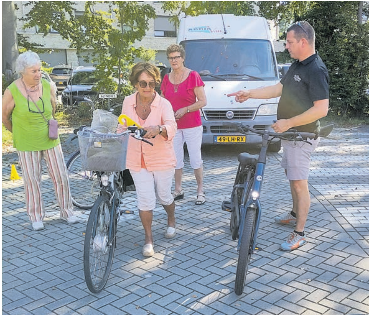
Van een gediplomeerde fietscoach krijgen de deelnemers tips.