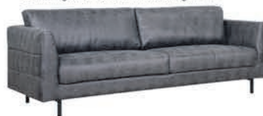
3+2 zits Buffalo Industrieel bankstel met patroonstiksel op de zijkant. Leverbaar in diverse bekledingen en kleuren. In Stofcategorie 1: