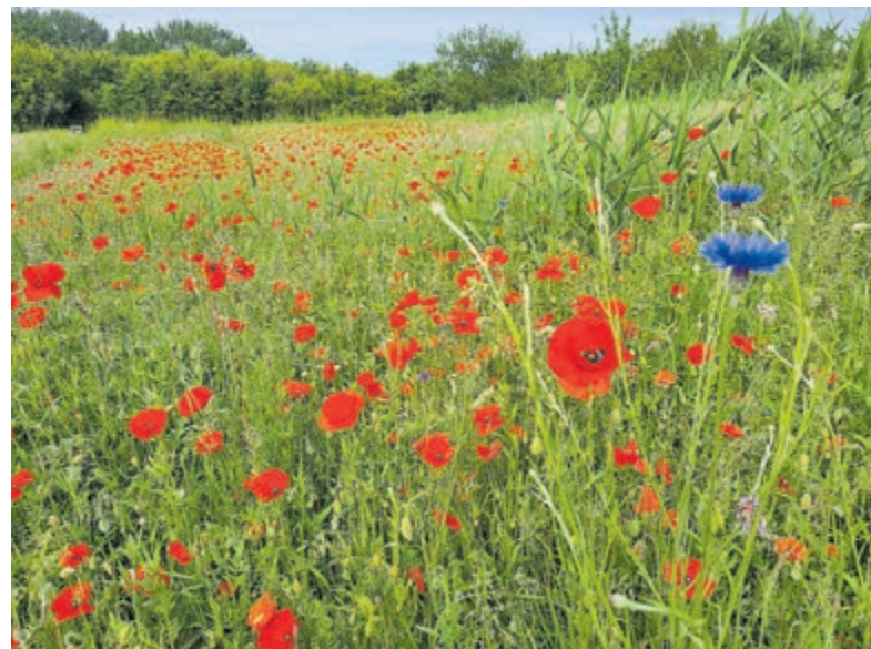
Bloeiende bloemenweides.

Verzamelaars: 1 juni, 20.00 uur, Heemstede Meermond ingang Cruquiusweg 49 (gemeentewerf) met fiets.