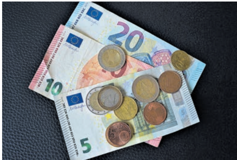
Overweging tot lastenverhogingen.

overweegt voor te stellen om de inkomsten te verhogen middels een verhoging van de leges, parkeerbelasting en een verhoging van de OZB. Geen woord over mogelijke besparingen. Uiteindelijk beslist de raad.