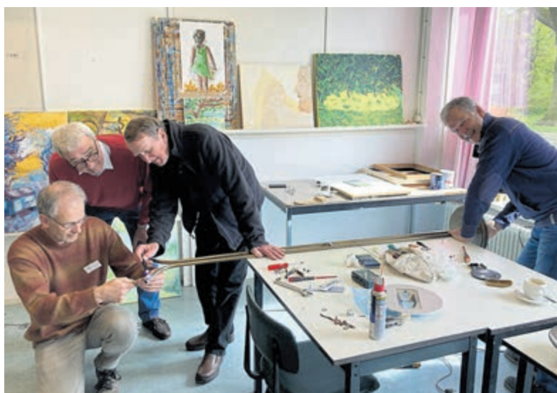
Reparaties in Repair Café Overveen.

per persoon). Indien u met de auto komt, gelieve deze dan te parkeren in de Willem de Zwijgerlaan. Indien u van tevoren vragen heeft of iets wel of niet gerepareerd kan worden, stuur dan een mailtje naar repaircafe@duurzaamoverveen.nl of bel met de coördinator op 06-51160881. Het Repair Café Overveen is een initiatief van Vereniging Duurzaam Overveen. Meer informatie via: duurzaamoverveen.nl .