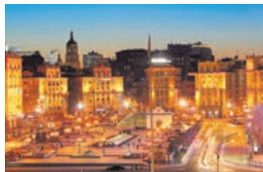
Onafhankelijkheidsplein in Kiev.