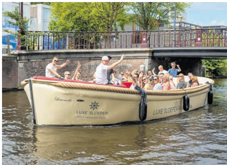
Sloepentocht tegen kinderarmoede. Foto aangeleverd.