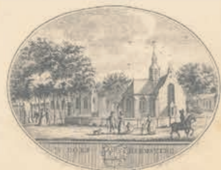
De Vensters op Heemstede en Bennebroek in vroeger eeuwen. Dit is de afbeelding van 'Land en Volk van Heemstede en Bennebroek' in 1785. Het is een afbeelding van de Vensters op Heemstede en Bennebroek in vroeger eeuwen. Het is een afbeelding van de Vensters op Heemstede en Bennebroek in vroeger eeuwen.

door Sander Wassing op dinsdag 25 juni Gedurende de 18e eeuw werden Heemstede en Bennebroek voor het eerst uitvoerig beschreven en afgebeeld. Hoe zagen Bennebroek en Heemstede er ruim twee eeuwen geleden uit? Waar hielden de inwoners zich in het dagelijks leven mee bezig? Tijdens de lezing komen veel vragen aan de orde en waant u zich in achttiende-eeuws Heemstede en Bennebroek. Beide lezingen zijn van 13.30 - 15.30 uur. Kosten per lezing: € 7,50. Opgeven voor de lezingen kan via e-mailadres: info@wijheemstede.nl of belt u 023 - 548 38 28.