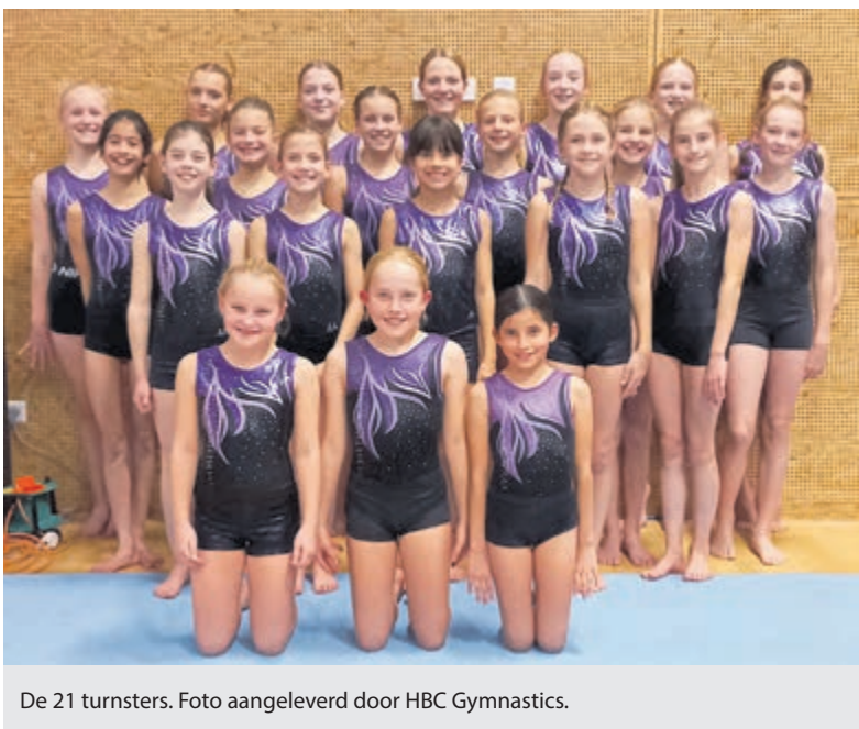
De 21 turnsters.