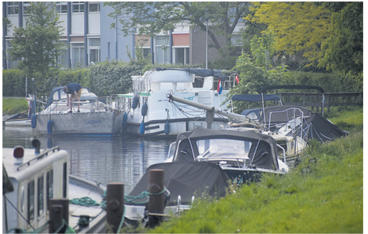
Ligplaatsen krijgen een ander regime.

plaatsen schelen. Gedacht wordt o.a. aan het IJsbaanpad. Er kan ook gedacht worden aan een specifieke ligplaats voor kleine scheepjes. Nu komt men in aanmerking voor een ligplaats als deze in het gebied waar men woont vrijkomt. Dit wil het college loslaten en één wachtlijst maken voor heel Heemstede. Dat houdt wel in dat men dan verder van huis een ligplaats krijgt. Waar het technisch wel mogelijke is, maar eerder ongewenst was - wegens vallende bladeren, stuifmeel of hars - wil het college die nu wel gaan benutten. Aan de huurder de ligplaats al dan niet te accepteren. Het algemeen belang moet prevaleren boven het privébelang. Dit houdt in dat inwoners met een ligplaats achter hun eigen terrein deze eventueel moeten opgeven en in de nabijheid een nieuwe plek krijgen toegewezen. Door ook de boten aan privégrond te administreren wordt er duidelijk hoeveel boten er in Heemstede zijn. Door inclusiviteit te bereiken moeten