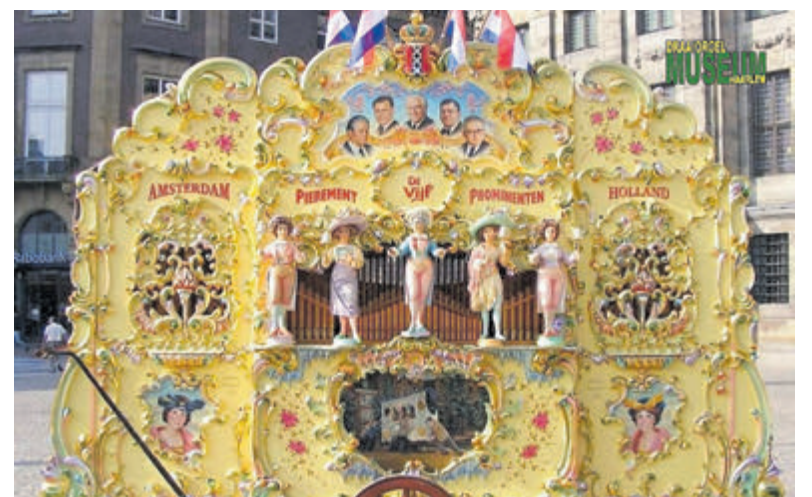
Het orgel 'de Vijf Prominenten'.

2e Pinksterdag speelt de Vijf Prominenten van 12 tot 18 uur; op beide dagen afwisselend met de orgels uit de museumcollectie. Vrij entree.