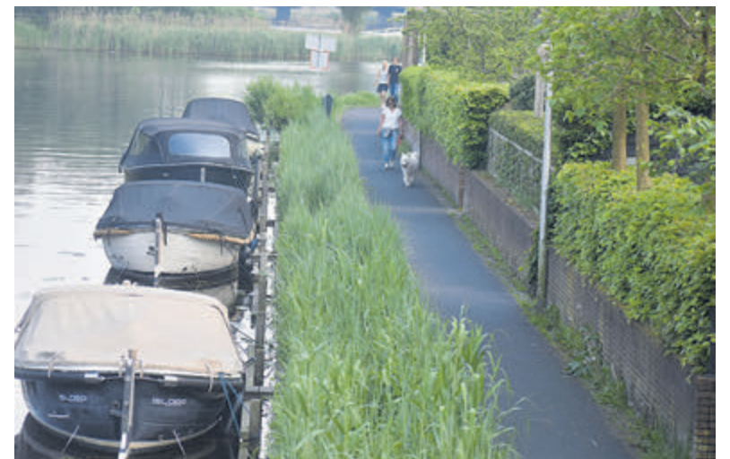
Het IJsbaanpad.

In het nieuwe plan, dat het college nu voorstelt voor het heralloceren van de ligplaatsen in Heemstede, wordt het IJsbaanpad expliciet genoemd als een plek waar veranderingen kunnen komen. De aanwonenden zullen hier ongetwijfeld niet blij mee zijn en een gang naar de bezwarencommissie of de rechtbank valt niet uit te sluiten.