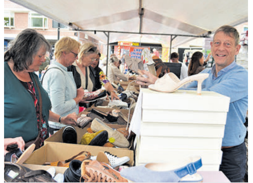
Lentefair 2023.

markt of een plekje bemachtigen aan één van de picknicktafels.