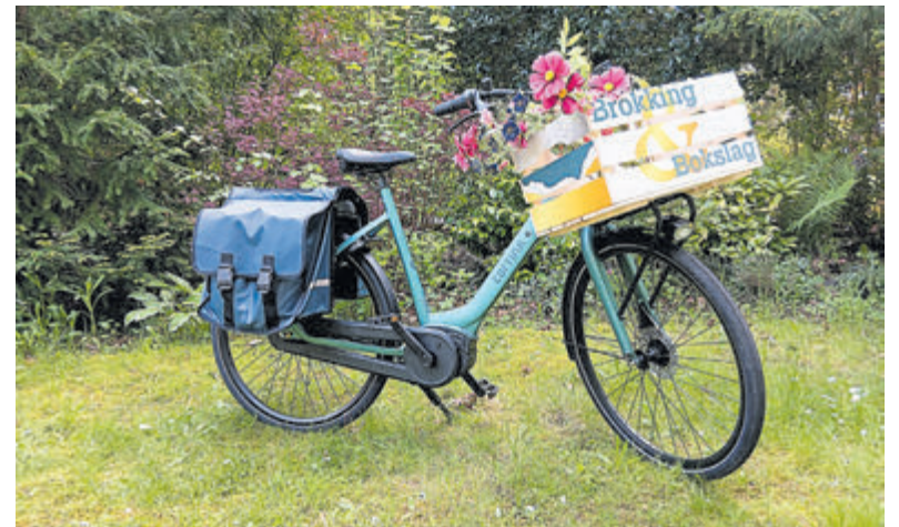
Wat zit er in de fietstassen van Brokking & Bokslag? Ontdek het op de Lentefair.