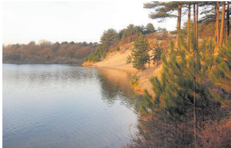
De Oosterplas.

verspreiden zij hun stuifmeel. Er is dus voldoende te leren over de duinen. Vanaf het uitzichtpunt Starrenberg heb je een mooi uitzicht op de duinen en kun je zowel de binnenduinenrand als het strand zien. Dit is een excursie in het Nationaal Park Zuid-Kennemerland. Verzamelen bij Bleek & Berg, ingang Nationaal Park Zuid-Kennemerland, bij Parkeerplaats ingang Bleek & Berg in Bloemendaal. Reserveren/aanmelden (verplicht) via: www.np-zuidkennemerland.nl . Informatie: dinsdag t/m zondag via: 023-5411123.