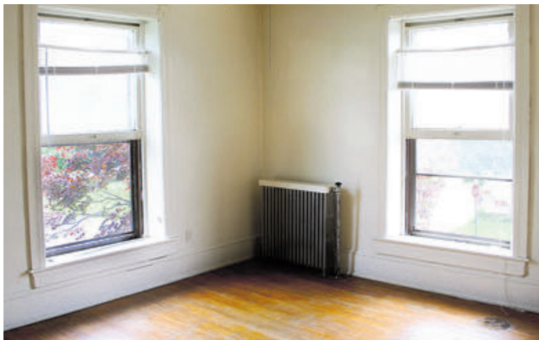
Een leegstaande kamer verhuren kan uitkomst bieden tegen de nijpende woningnood.

Ook kunt u inzake kamerverhuur terecht op de webpagina van de gemeente Bloemendaal: www.bloemendaal.nl/kamerverhuur .