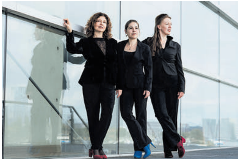
Het MirAnDa trio.

Meer informatie via 023-5378625 of via www.mosterdzaadje.nl . Half uur voor aanvang is de deur open. Toegang vrij, na afloop collecte met richtlijn €10,-.