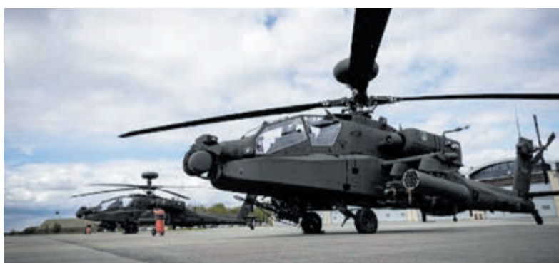
Defensie Helikopter.