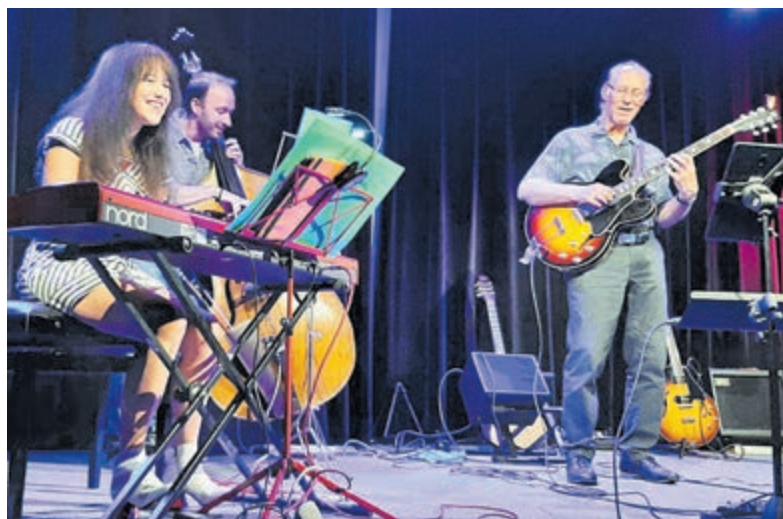
Trio Paul Prins.

Het wordt een cross-over tussen het klassiek lied en blues/jazz. Klassieke liëderen, die ook best jazzy klinken, worden afgewisseld met bluesstandards, waarbij er lustig op los geïmproviseerd wordt.