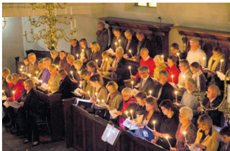
Een moment van stilte en bezinning.