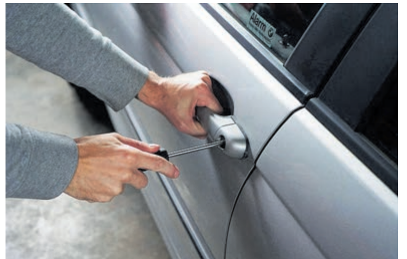
Auto-inbraken zijn aan de orde van de dag.