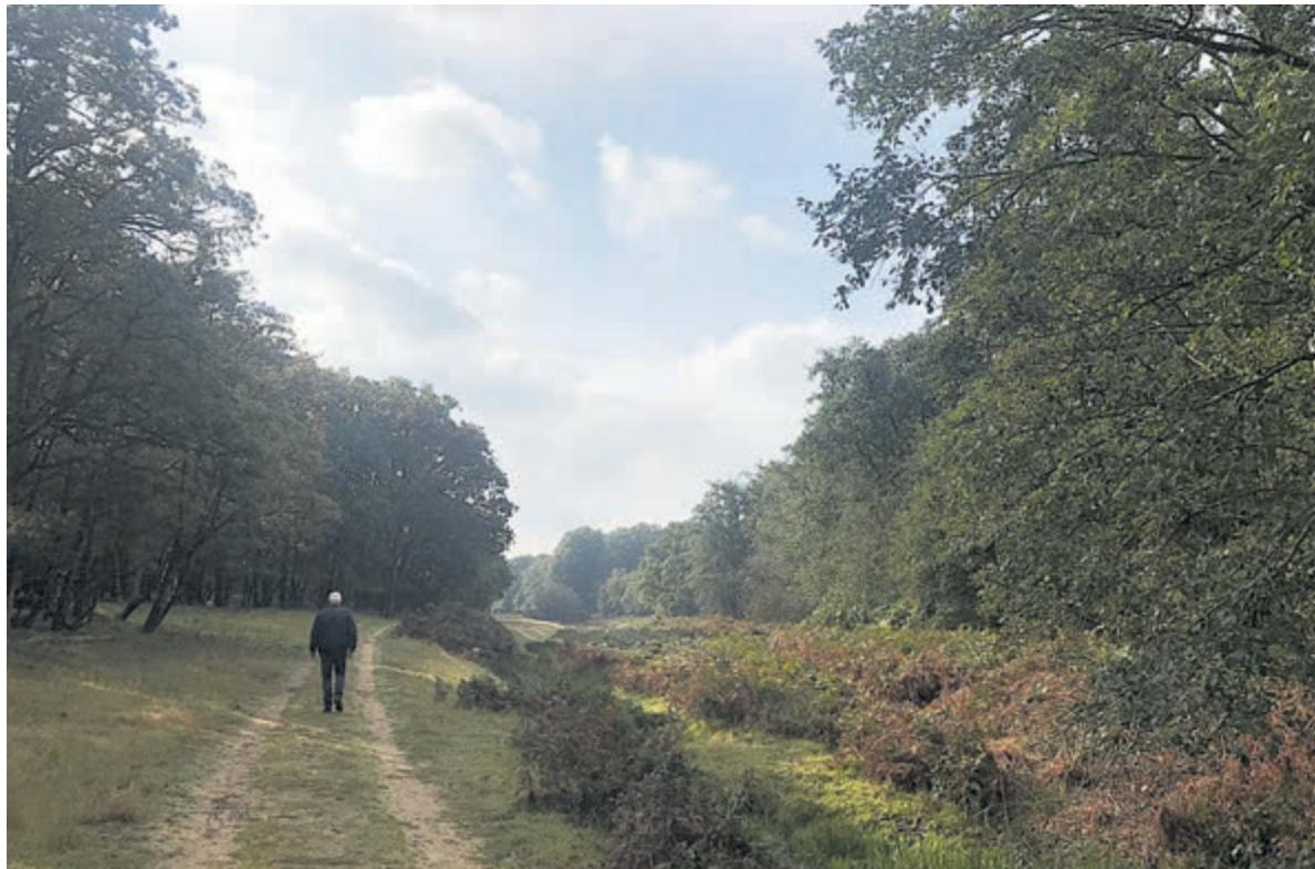
De huidige Amsterdamse Waterleidingduinen.