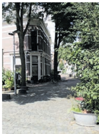
De 'Jordaan' van Haarlem.