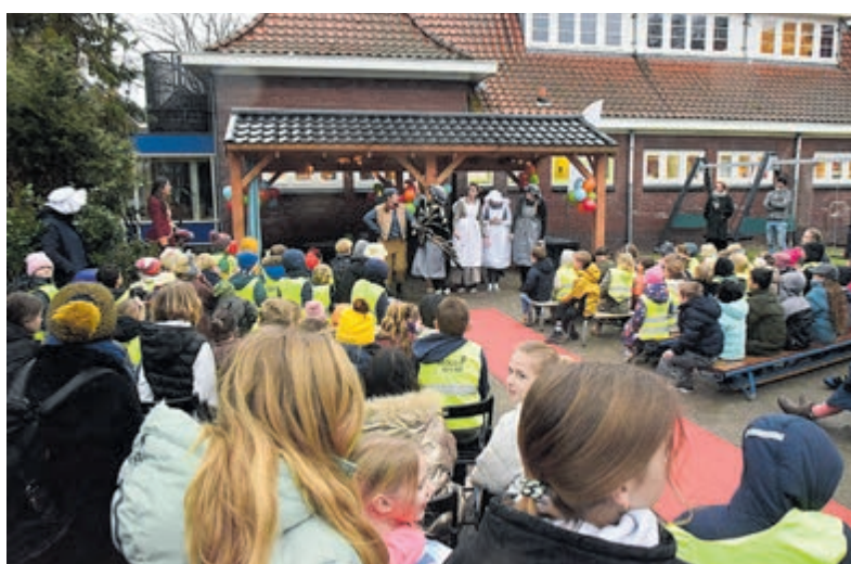
Kinderen zijn blij met hun buitenlokaal.