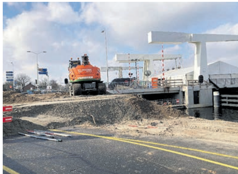
Er wordt duidelijk gewerkt aan een stukje verhoging van de weg.