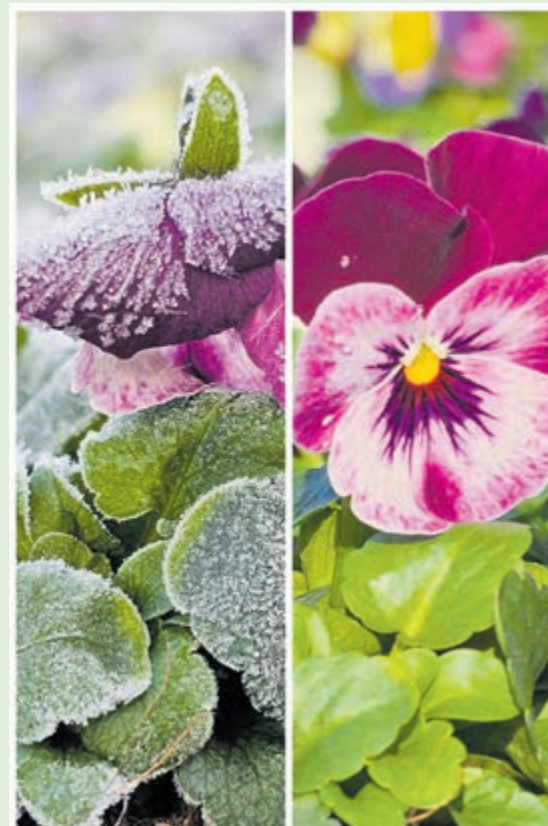
Planten in de winter.

Voor de meeste tuinplanten helpt het om ze pas in het voorjaar af te knippen, de afgestoven plantdelen beschermen de 'slappende' plant die eronder zit. Kwetsbare planten hebben onze hulp nodig om de kou te kunnen trotseren. Voor veel tuinplanten is het genoeg om ze in te pakken als het vriest. Een goed stuk vliedoek of jute eromheen en zorgen dat dat niet afwaait is voldoende. Vergeet dan niet om dat weer eraf te halen als het niet meer vriest, planten moeten kunnen 'ademen'. Sommige planten zijn echte kuipplanten en worden dus best ook in een kuip (of pot) gehouden. Dat maakt het makkelijk om ze binnen te zetten als het buiten te koud wordt. Dan is een onverwarmde maar vorstvrije binnenruimte met natuurlijke lichtinval het beste, dus bijvoorbeeld een garage of schuur met ramen. Vergeet ook niet om de potten die buiten blijven in te pakken met noppenfolie, de meeste potten kunnen namelijk ook stukvriezen!