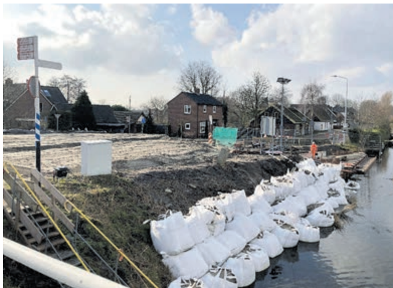
Hier moet de af/oprit komen van de fietsbrug.

In april zou dan de nieuwe brug klaar zijn en vervolgens gaat de oude brug richting Hoofddorp eruit voor renovatie. Een datum wordt nog bekendgemaakt.