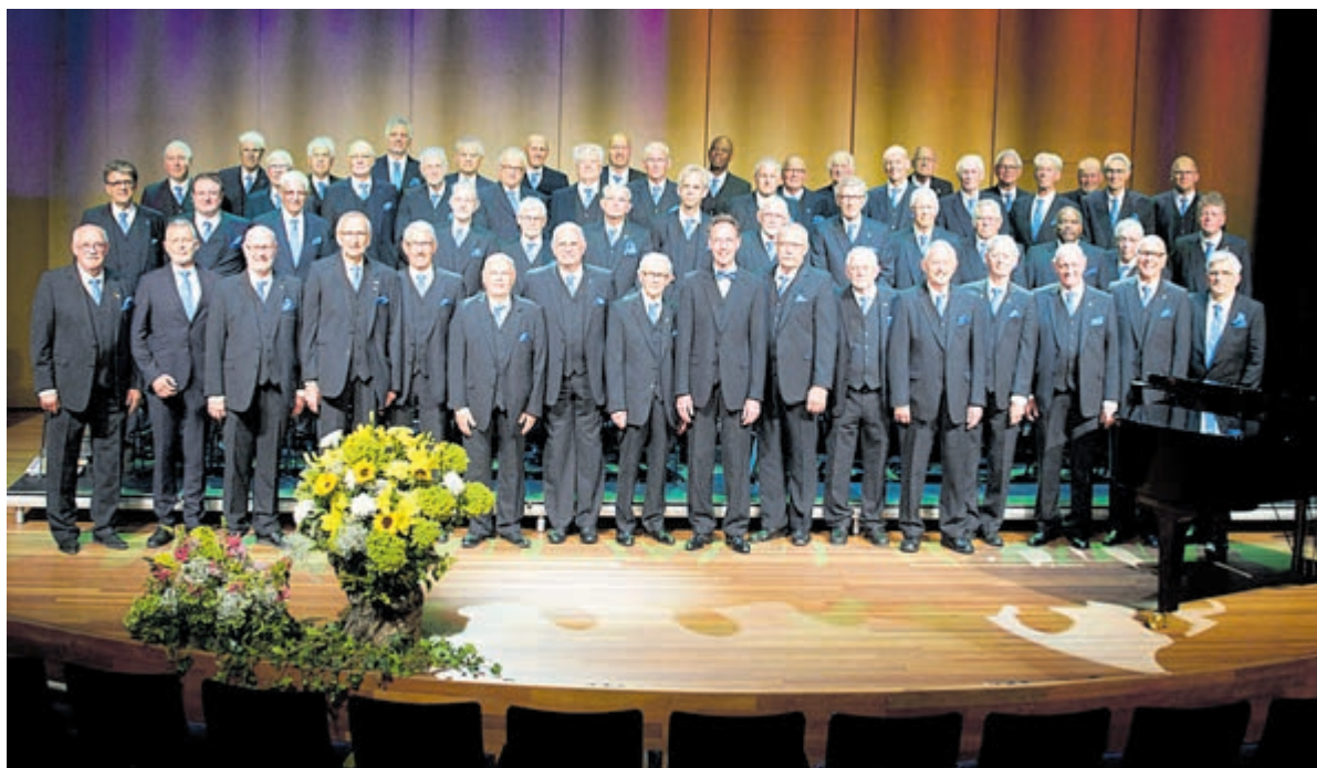
Statiefoto van het koor.

Komend najaar, op zondagmiddag 19 oktober, houdt Zang en Vriendschap een groots concert met Weense liederen, genaamd Wiener Melange. "Met een groot orkest, een vrouwenkoor en dansers in de grote zaal van PHIL Haarlem. Het wordt een groot feest passend bij ons 195-jarig bestaan", vertelt de voorzitter. "Als projectzanger kun je hier aan meedoen. Zingen in de grote zaal van de PHIL is een heel bijzondere ervaring."