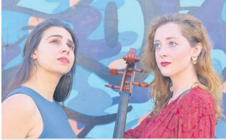
Ischico en Florianne.

't Mosterdzaadje, Kerkweg 29, Santpoort-Noord, 023-5378625 en www.mosterdzaadje.nl . Half uur voor aanvang is de zaal open. Toegang: collectie met richtbedrag €12,50.