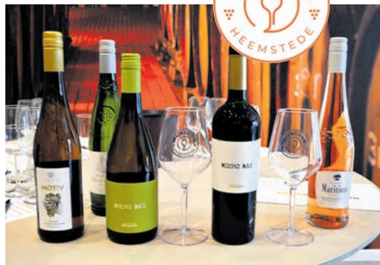
Tijdens de Wijntour kunnen er fijne wijnen worden geproefd. Je kunt meedoen met een speciaal Wijntour-glas, hier op de foto.

Dit jaar introduceert de organisatie (WCH) bij De Wijntour een stempelkaart die de deelnemer laat afstempen bij elke winkel waar hij/zij een glaasje wijn haalt.