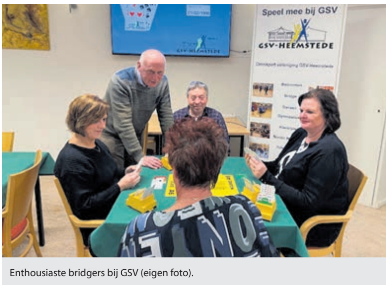
Enthousiaste bridgers bij GSV.

Meer informatie en tuintips zijn te vinden op: www.deoosteinde.nl