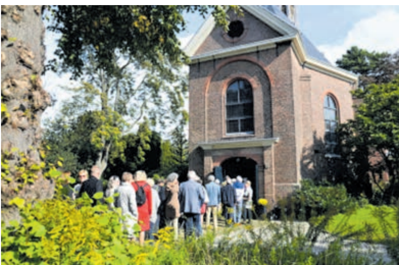
Dorpskerk Bloemendaal.

Voor gasten, data en meer informatie zie www.dorpskerkbloemendaal.nl .