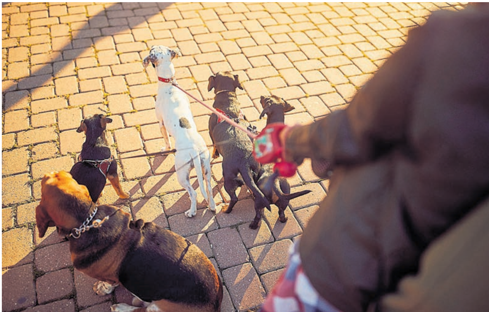
Losloopgebieden voor honden vastgesteld.