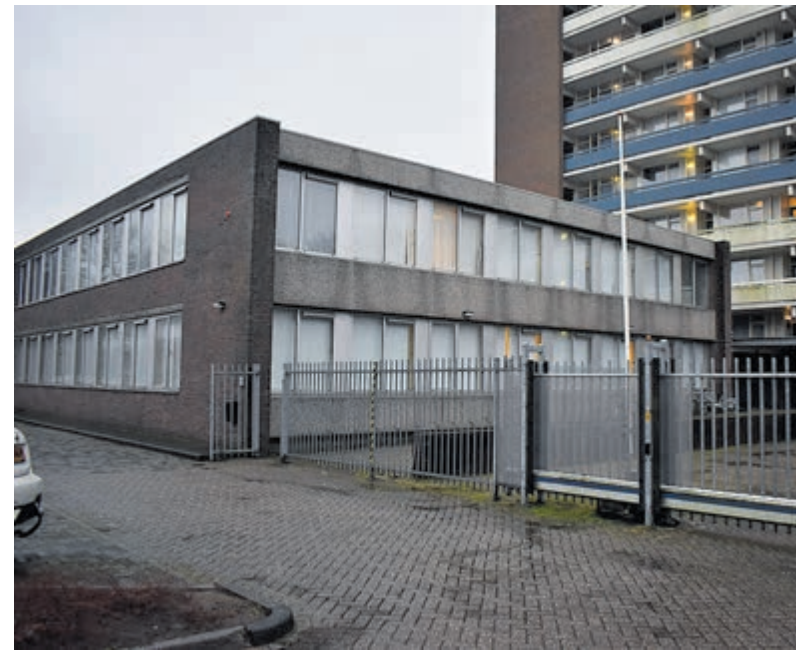
Voormalig politiebureau Kercklaan.

Wethouder Van der Have (HBB) was schoorvoetend bereid het persbericht niet te versturen en eerst verder te spreken met de raadsleden. De gemeente is sinds 2018 eigenaar van het oude politiebureau dat oorspronkelijk in de race was als tijdelijke school. Het gebouw blijkt daarvoor te klein. Momenteel wordt het gebouw antikraak bewoond en als het plan van het college doorgaat wordt het een zogenaamde tussenlocatie. Als de mannen zijn herenigd met hun familie moeten zij elders worden gehuisvest. De omwonenden zouden reeds op de hoogte zijn gesteld van het voornemen. Er komt voor de omwonenden nog een informatieavond.