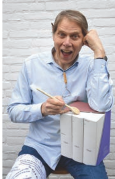
Wim Daniëls.

Nederland kent Wim Daniëls vooral van zijn columns bij 'Spijkers met Koppen', zijn talloze boeken over taal en zijn taalbeschouwingen, waaronder de roemruchte bespreking van het Koningslied. Ook is hij een graag geziene gast in de talkshows. Sinds enkele jaren speelt hij voor volle zalen cabaret- en toneelvoorstellingen. Een avondje in de keuken van Wim Daniëls, dat is "vermakelijk en interessant", aldus de Volkskrant over zijn programma 'Associëren'.