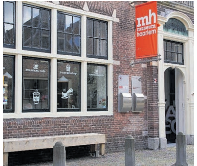
Museum Haarlem.

Half uur voor aanvang is de zaal open. Richtlijn collectie 10 euro.