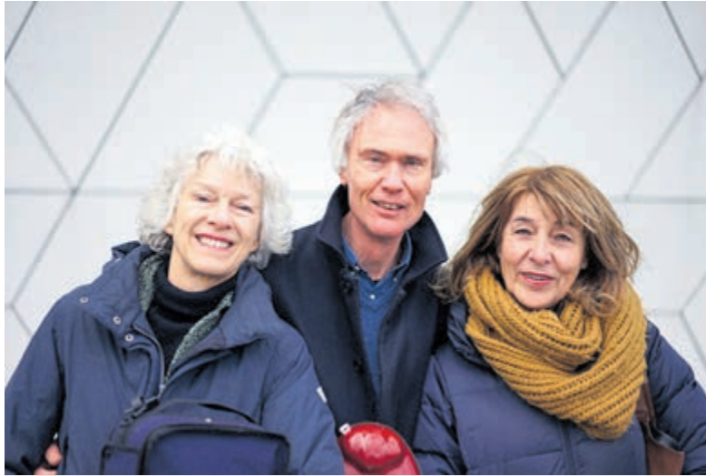
Het Rogeri Trio.