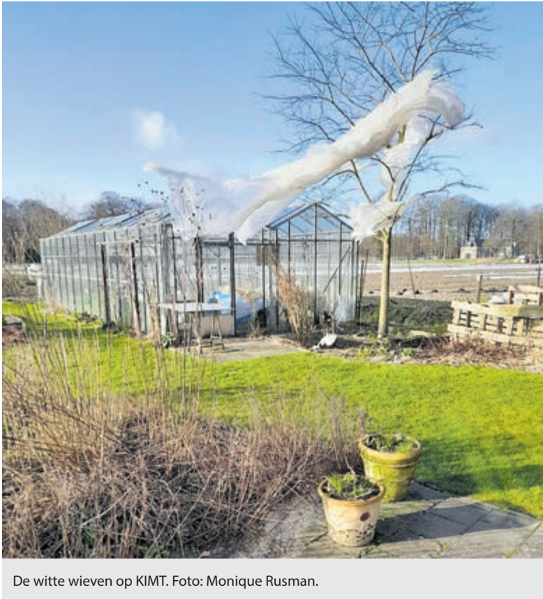
De witte wieven op KIMT.

Meer informatie over KIMT: www.kominmijntuin.com of Facebook: Kom In Mijn Tuin.