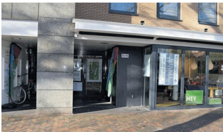
De pop-up winkel van HeemSteeds Duurzamer.

Er kan een afspraak worden gemaakt met energiecoaches die thuis op maat advies komen geven. Alles kan aan bod komen dus ook het vergroenen van tuinen, meer warmte halen