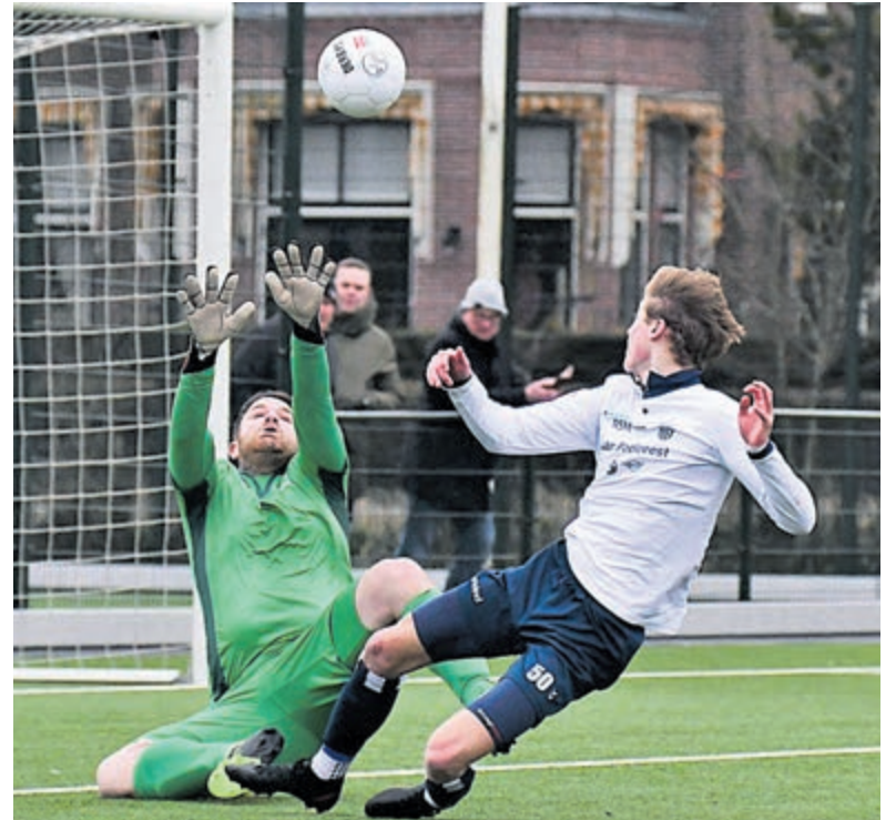
Duel HFC - Olympia.