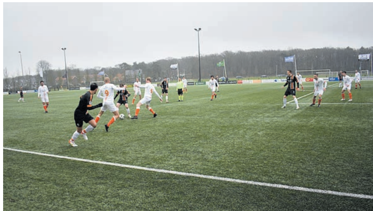
HBC vs. Bloemendaal.

Op 20 maart treffen de twee ploegen elkaar in Heemstede.