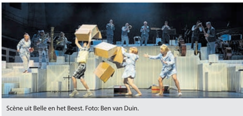
Scène uit Belle en het Beest.

Haarlem - Het Balletorkest, Philharmonie Haarlem en Stichting Hart Haarlem slaan de handen ineen om zoveel mogelijk Haarlemse kinderen in aanraking te brengen met symfonische muziek. Het artistieke team is nu verantwoordelijk voor de muzikale familie- en schoolvoorstelling Belle en het Beest die op zaterdag 26 maart a.s. in première gaat in Philharmonie Haarlem.