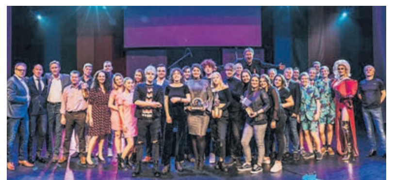
Deelnemers vorige festival in 2019.