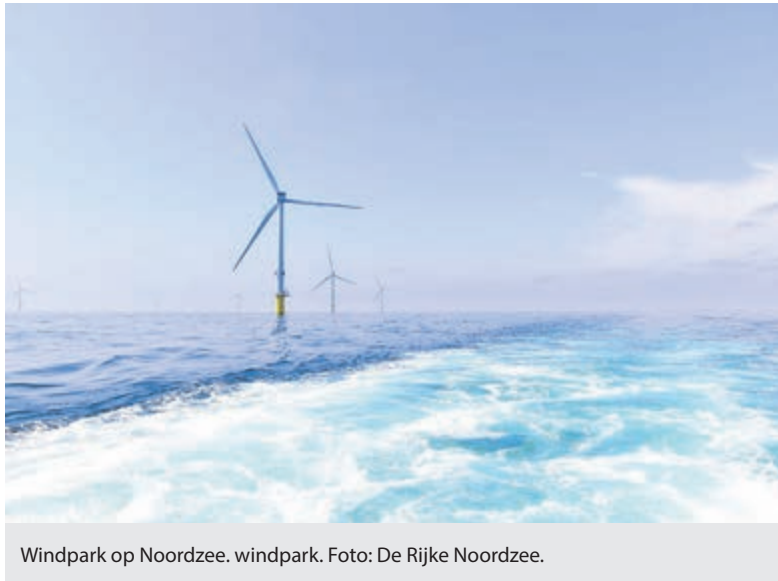
Windpark op Noordzee. windpark.

De Noordzeenatuur is verarmd. Nederland moest eigenlijk in 2020 al ‘de goede milieutoestand’ bereiken: een toestand waarbij de zee schoon, gezond en productief is, een grote ecologische verscheidenheid kent, met alleen duurzaam gebruik. Het gaat nu bijvoorbeeld slechter met sommige zeevogelpopulaties en de zeebodem wordt nog steeds substantieel verstoord.