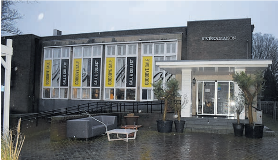
Het voormalig postkantoor.