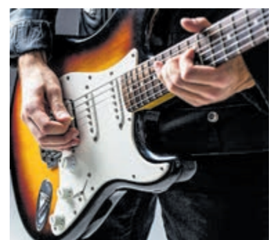
Heerlijke live-muziek horen kan weer op Bevrijdingspop.

Volgende week weer een nieuwe kruiswoordpuzzel met nieuwe kansen.