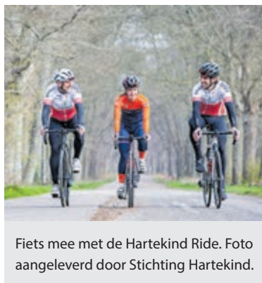
Fiets mee met de Hartekind Ride.

Stichting Hartekind financiert wetenschappelijk onderzoek om de overlevingskansen en kwaliteit van leven van hartekinderen verbeteren.