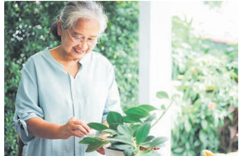
Senioren geven om duurzaamheid.

Langer Thuis in huis is een online gids voor senioren die graag veilig en prettig in hun eigen huis willen blijven wonen.