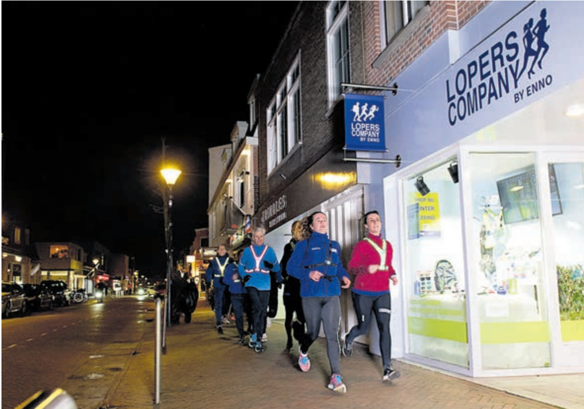
Leer de juiste hardlooptechnieken met de cursus Hardlopen voor Beginners.

opbouw, waarbij hardlopen met stukken wandelen wordt afgewisseld, leer je in 13 weken om 40 minuten aaneen te kunnen hardlopen. Er is nog plaats voor nieuwe cursisten, dus schrijf je snel in! Alle informatie hierover staat op: www.loperscompanyheemstede.nl/hardlopen-beginners/ . Bellen kan ook naar 0620 41 00 66 of loop binnen bij Lopers Company by Enno op de Binnenweg 35 in Heemstede. Daar kun je gelijk alle antwoorden op je vragen krijgen.