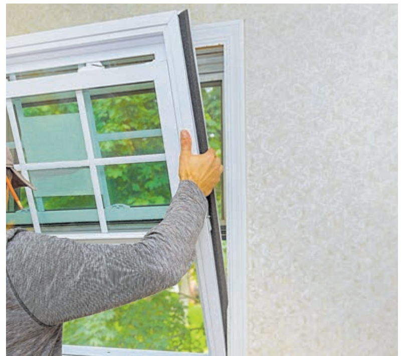
Duurzaam en gezond wonen.

Alkmaar 072-5312000 Haarlem 023-5121400 Velsen 0255-547800