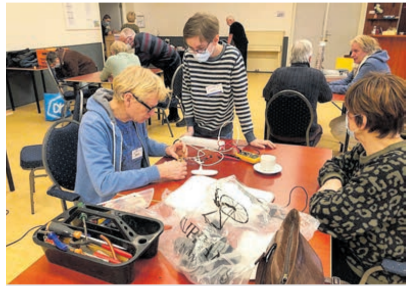
Repaircafé afgelopen januari.

Binnenweg 67 Bennebroek Zondag 27 februari, 10u. Dhr. J.W. van de Kamp. De diensten kunt u volgen via: www.kerkomroep.nl/#/kerken/11159 . https://kerkdienstgemist.nl/stations/2528 . www.hervormdpgknbennebroek.nl