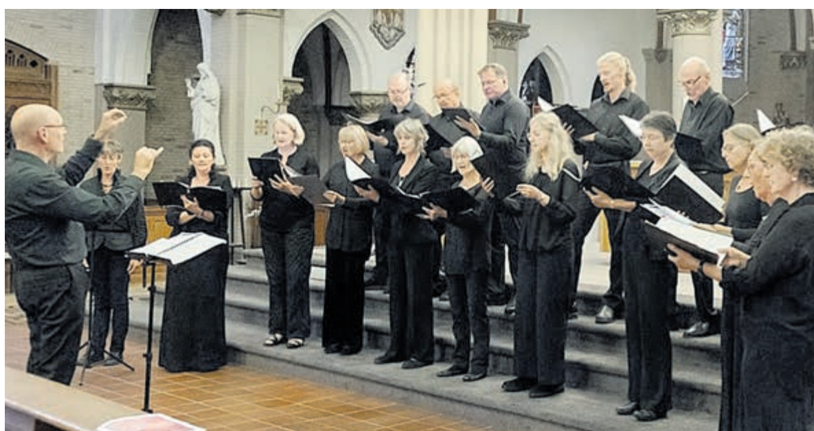
Sola Re Sonare.

De leden van het vocaal ensemble Sola Re Sonare zijn afkomstig uit Heemstede en wijde omstreken. Het koor repeteert doorgaans op woensdagavonden in de Sint Bavo in Heem-