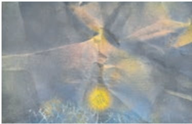
Gelaagde werken vol symbolen en tekens (werk van Gerard Polhuis).

In digitaal bewerkte en overschilderde foto's en collages onderzoekt De Joode de relatie tussen het object en haar tweedimensionale en digitale representatie. Op speelse wijze confronteert ze ons met de beperkingen van onze waarneming. Want een vette penseelstreek blijkt een digitale reproductie. En een vel papier dat haast gewichtloos zweeft, blijkt bij nader inzien een dikke plak