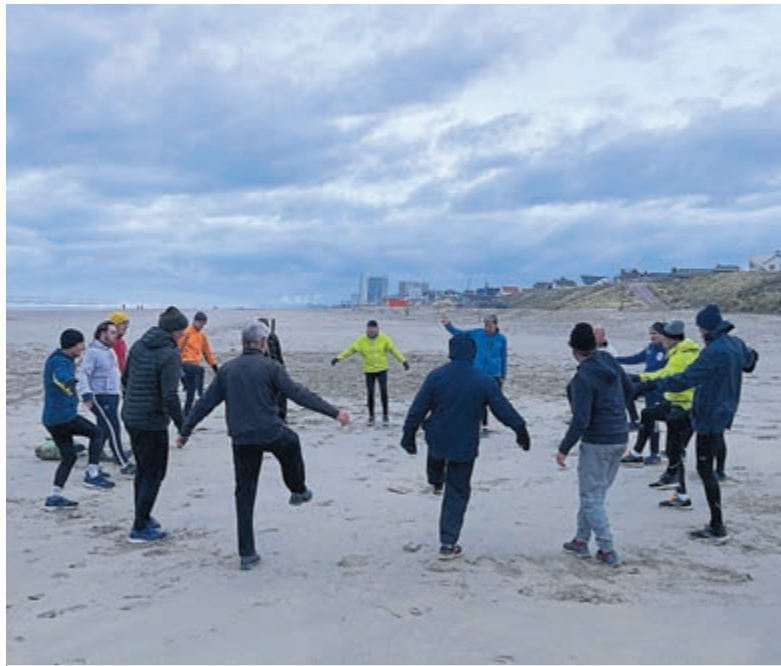
Rekken en strekken aan het strand.