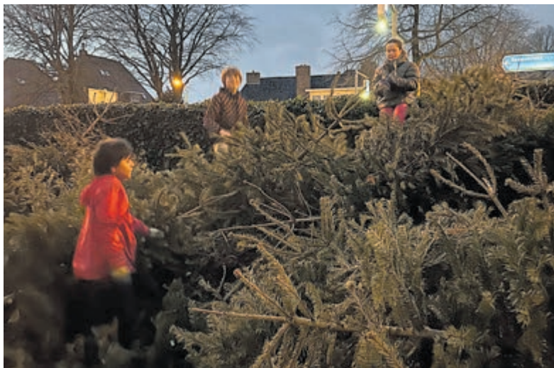
Noeste arbeid. Beeld: M. Vriskoop.