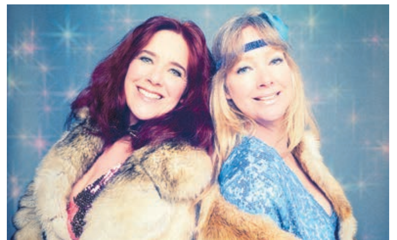
Dancing Queens. Beeld: Anne van Gelder.

twee zussen worden bijgestaan door pianist Leo Bouwmeester. Op een meesterlijke manier speelt hij ABBA's wereldberoemde songs op de piano, zoals de liedjes oorspronkelijk geschreven zijn, waaronder 'Dancing Queen', 'The Winner Takes It All', 'Knowing Me Knowing You' en natuurlijk 'Mama Mia'. Zo is hij in zijn eentje Björn én Benny. Dancing Queens is een feest der herkenning; een topavond uit voor elke generatie!