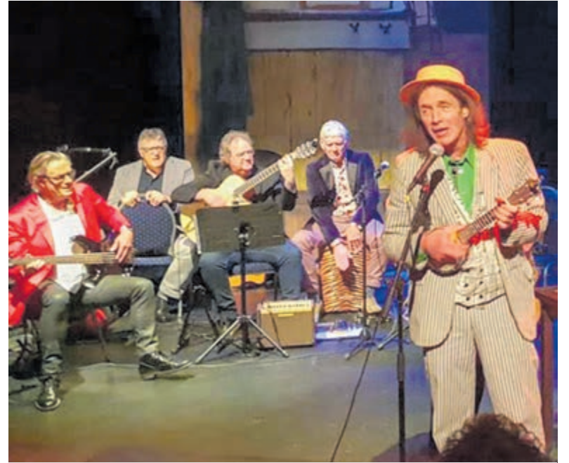
Ampzing Genootschap.

Het Ampzing Genootschap leent zich bij uitstek voor het vieren van een jubileum van een instelling als Het Trefpuntcafé, die veel met taal doet. En Het Trefpuntcafé heeft zich de afgelopen 25 jaar sterk gemaakt door actuele maatschappelijke onderwerpen uit diverse domeinen aan de orde te stellen en die door begenadigde goed ingevoerde sprekers te laten bespreken en bediscussieren. Dat alles verloopt in een ongedwongen café-achtige sfeer precies zoals Het Ampzing Genootschap ook al jaren aan de weg timmert. Dit illustere gezelschap spreekt en zingt in het Nederlands, onze moedertaal. Het Genootschap bestaat niet uit taalpuristen maar uit liefhebbers van de Nederlandse taal. Daar spelen ze mee en daar zingen ze in. Vanzelfsprekend zullen vaste bezoe-