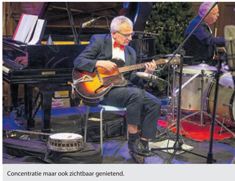
Concentratie maar ook zichtbaar genietend.

er in De Pauwehof, naast de Oude Kerk, nog even gezellig nagepraat met een drankje en gepraat op het nieuwe jaar. Meer informatie: www.oudekerkheemstede.nl/vrienden .