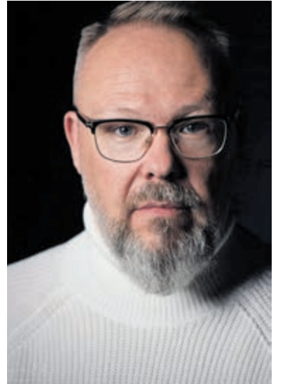
Ago Verdonshot.

Haarlem – In de nacht van donderdag 2 op vrijdag 3 januari reed een automobilist een woning binnen op het Griend in Haarlem. Er was op dat moment gelukkig niemand aanwezig in het huis. Na het ongeval ging de bestuurder ervandoor. Later in de nacht trof een voorbijganger het voertuig met flinke schade terug op de Korte Kleverlaan in Bloemendaal. De bestuurder vloog uit de bocht bij de Bibliotheek en ramde een geparkeerde auto.