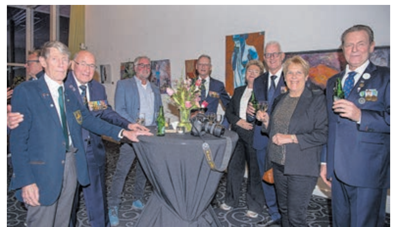
Ook de veteranen waren erbij.