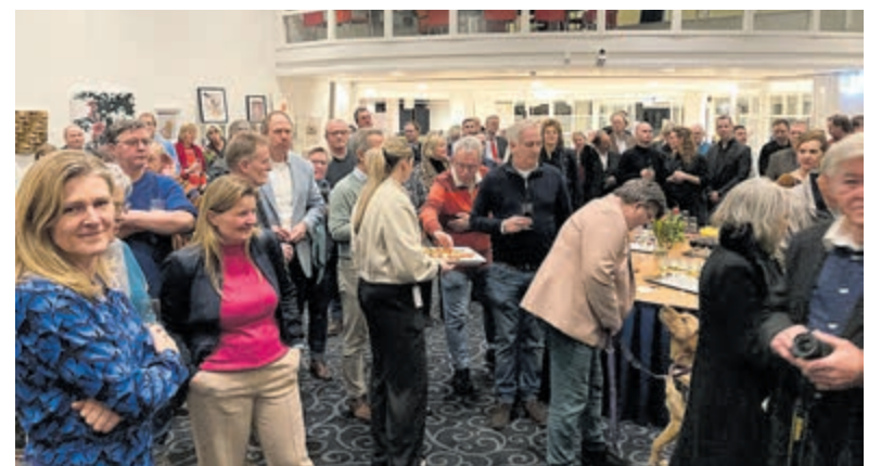
De receptie werd druk bezocht.