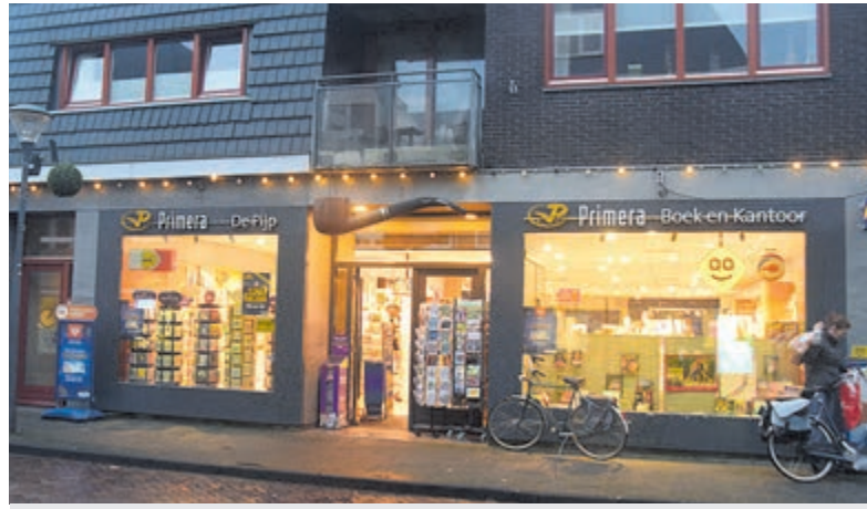
De bekende Primeravestiging in de Raadhuisstraat van Heemstede.