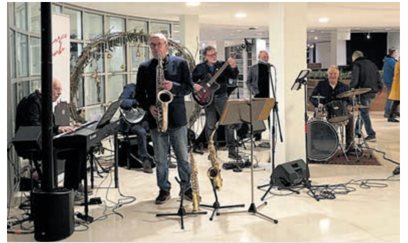
Muzikale omlijsting.