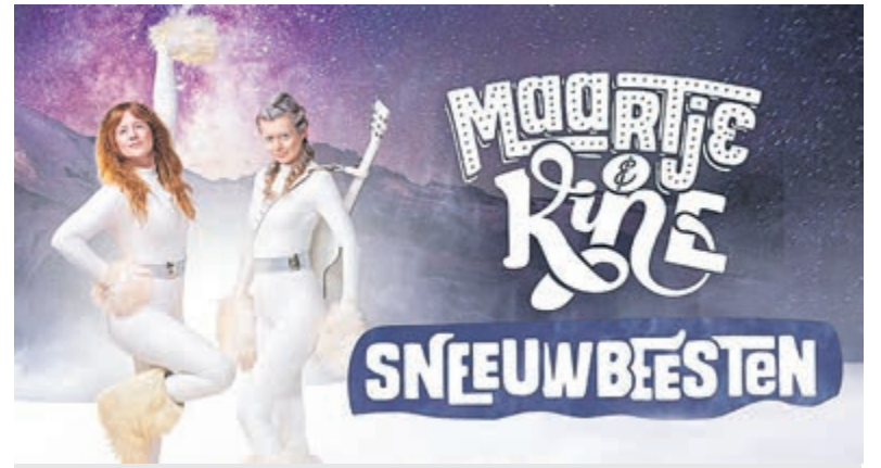
Promotiefoto voor de voorstelling Sneeuwbeesten, met Heemstedse inbreng.

Terugkerende evenementen waar het Voorwegkoor zich laat zien en horen zijn het Haarlemse Korenlint,