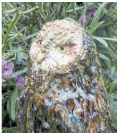
Inspiratie uit de natuur.